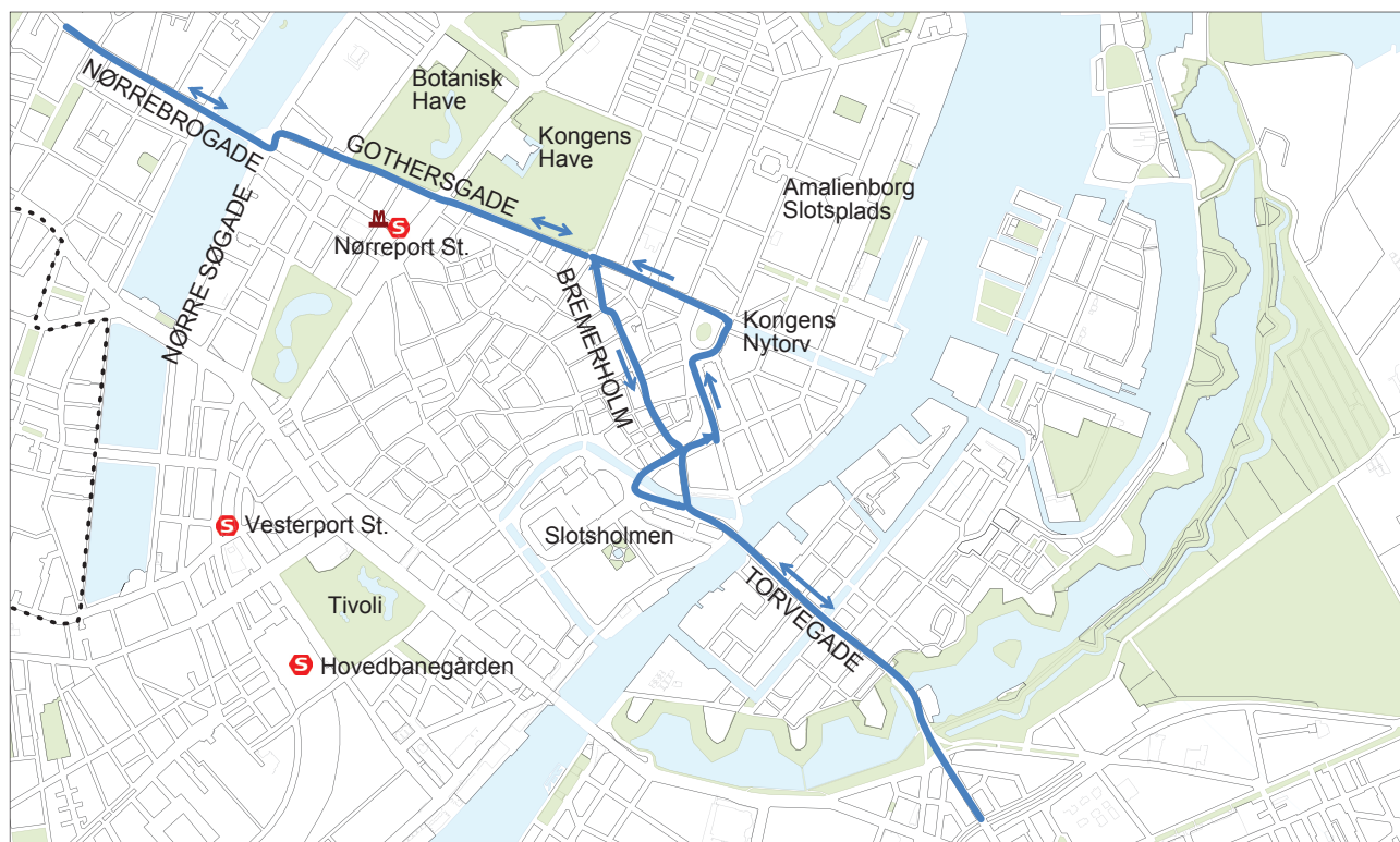
Forslag til letbane-linjeføring gennem Indre By