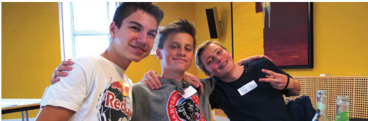
Indre By Lokaludvalg