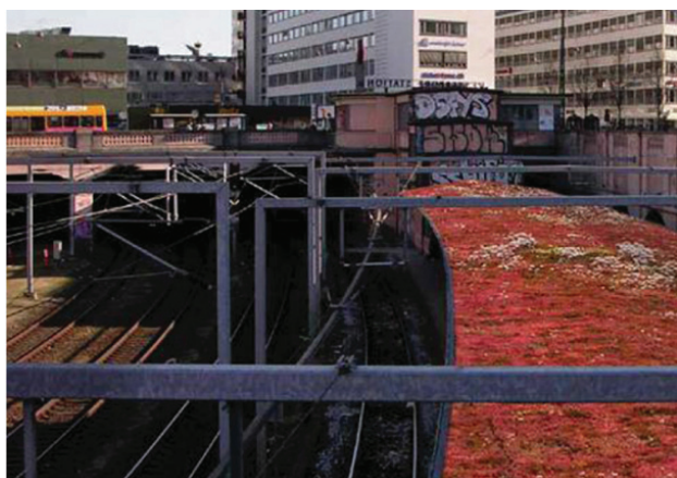
På billedet ses en animation af Vesterport Station med grønt tag.