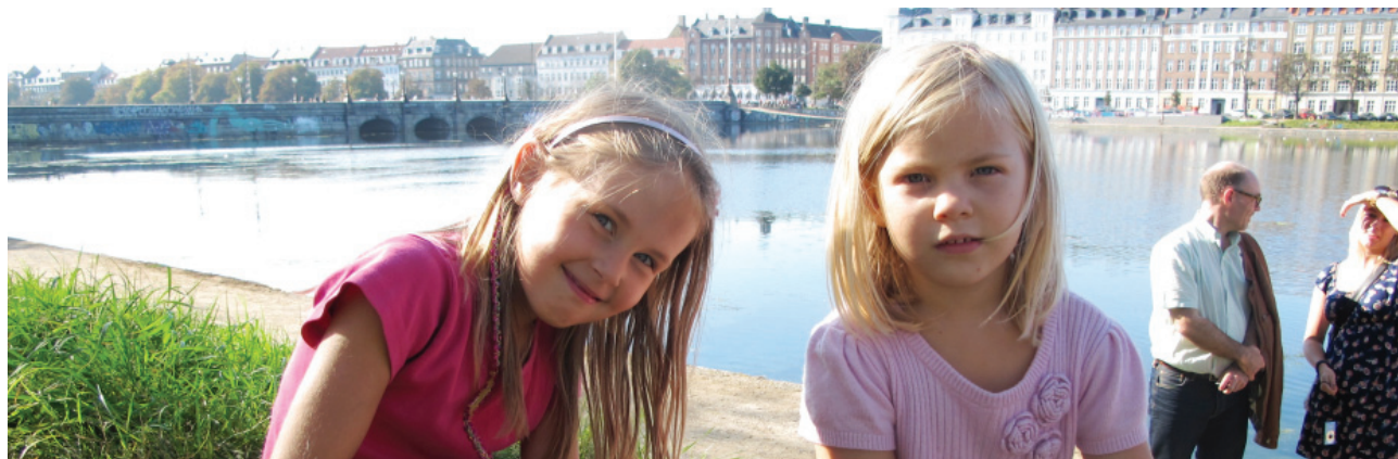
Indre By Lokaludvalg