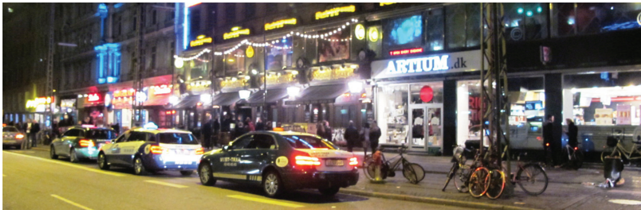
Indre By Lokaludvalg