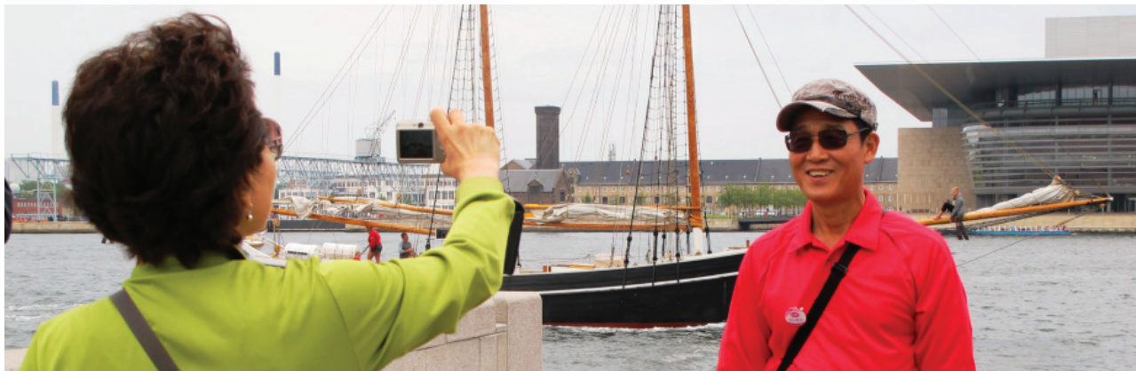
Indre By Lokaludvalg