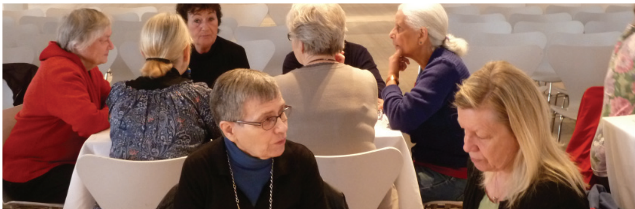
Indre By Lokaludvalg