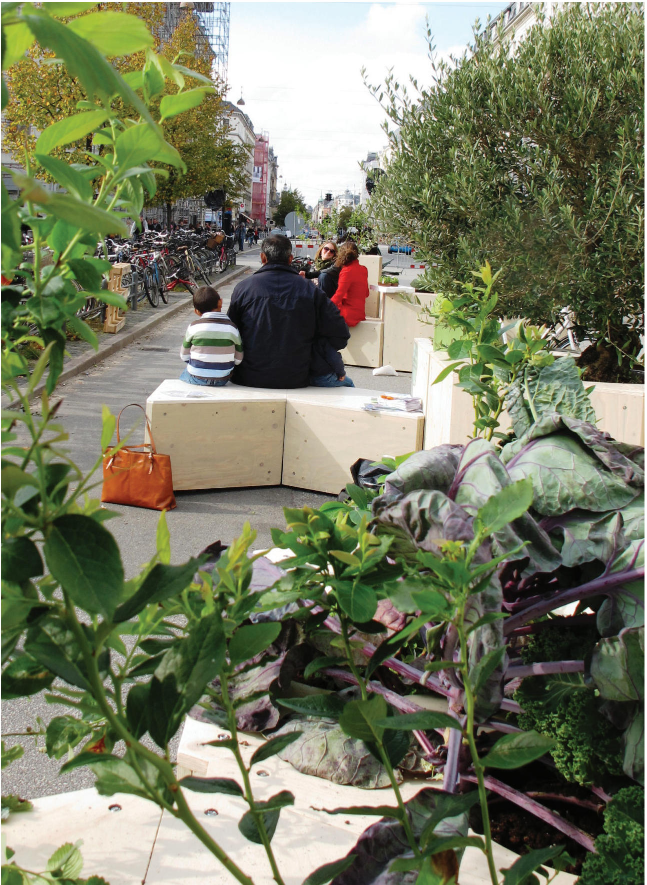
Indre By Lokaludvalg