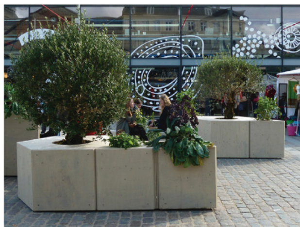
Miljøpunktets eksisterende mobile træer.

Bund laves af rør, f.eks. af isolationsrør, der bruges i industrien og til undergrunden. Heri kan stilles laurbærtræ eller buskbom og andet stedegrønt. Træpladerne samles af to dele og låser konstruktionen, og træerne kan ikke flyttes. Det gør dem nemme at opstille og besværliggør tyveri.