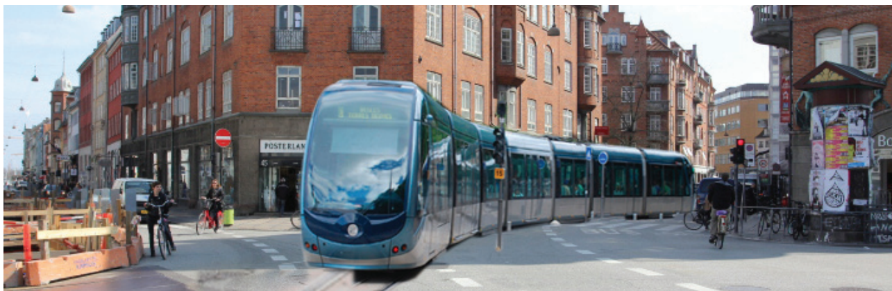
Indre By Lokaludvalg