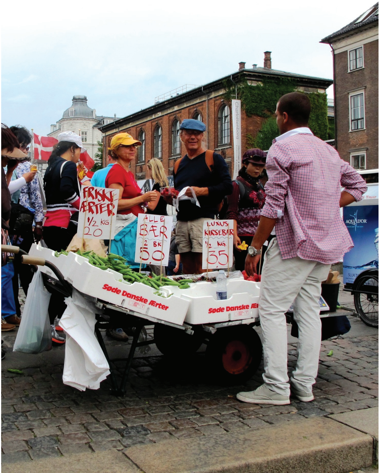
Indre By Lokaludvalg