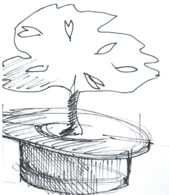
En skitsetegning af mobile træer version 2

Andre udfordringer har været bydelens kompakthed, hvor der skal tages hensyn til mange funktioner: Smalle fortove, cykelstativer og adgang for varevogne er nogle af de forhindringer, der besindigt skal med i planlægningen af flere mobile træer i bybillede, og er en udmærket afspejling af de daglige udfordringer, som bydelen møder.