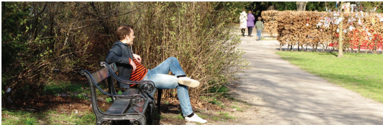
Indre By Lokaludvalg