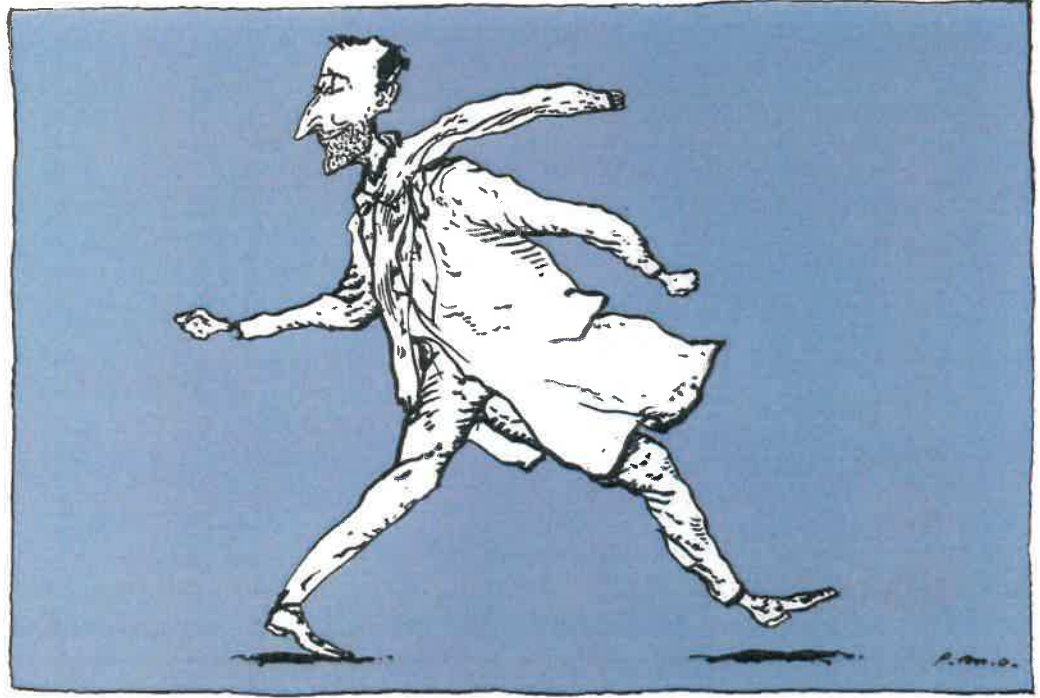
Politikeren mener: «På forbløffende kort tid er Martin Lidegaard blevet fanget af den forbandelse, der hviler over Radikale Venstre. Partiet kan ikke finde ud af at komme i regering, og det kan ikke finde ud af ikke at være i regering».