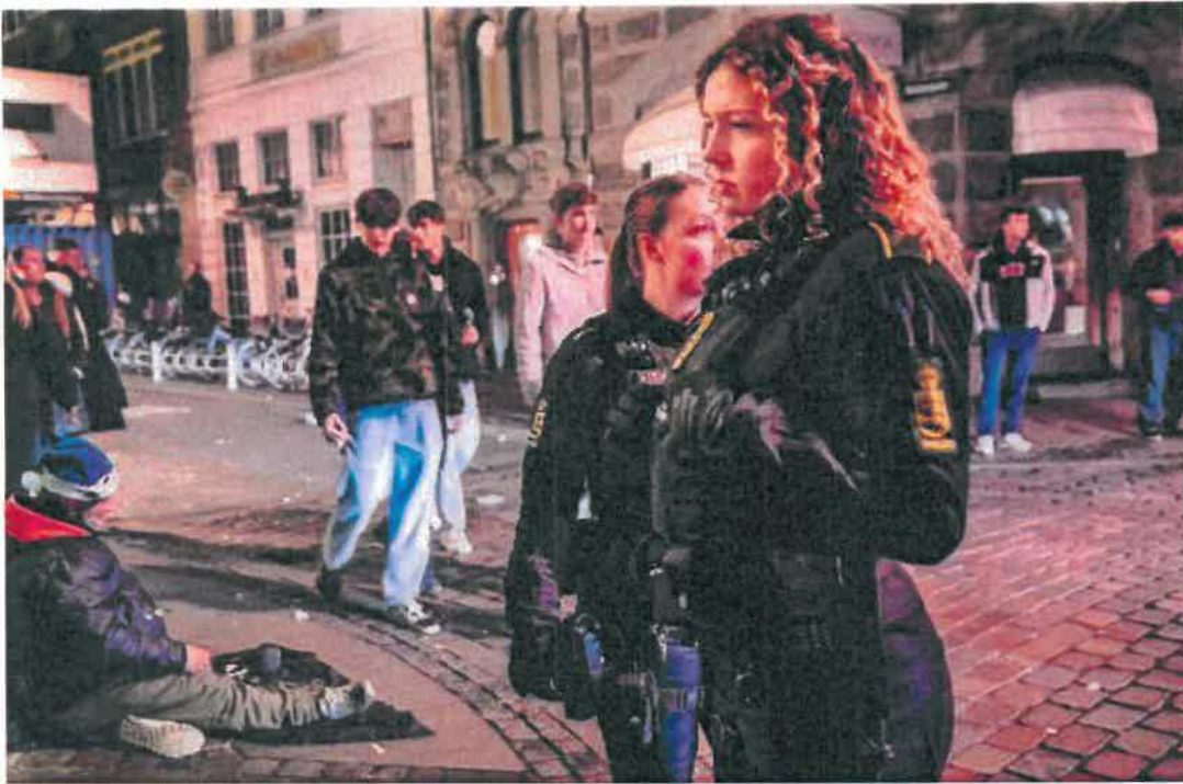
Politiet er på arbejde i festgaderne for at skabe trykthed i nattelivet. Men det er ikke nok, mener beboere, der efterlyser politisk begrænsning af natbevillingerne for at dæmpe Københavns nattefester.