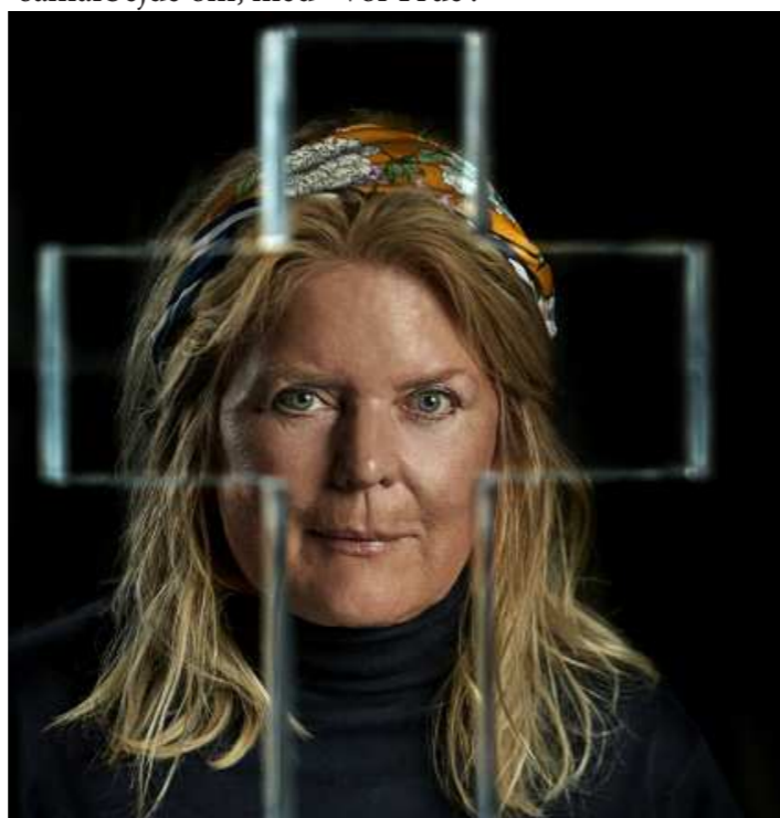
At se gennem korsets tegn. Acrylmodel i 1:5-