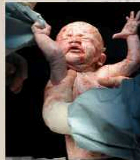
Det første sekund – Ordrupgårdsamlingen, 2013

Jeg har i hele mit liv arbejdet med Moderskabet. I teori, i kunst og i praksis, Står i 2023 over for at lave endnu en fotografisk opgave for Rigshospitalet, hvor jeg undersøger fødselsøjeblikket- samt "Hud mod Hud" døgnene derpå. Selv har jeg født 4 børn