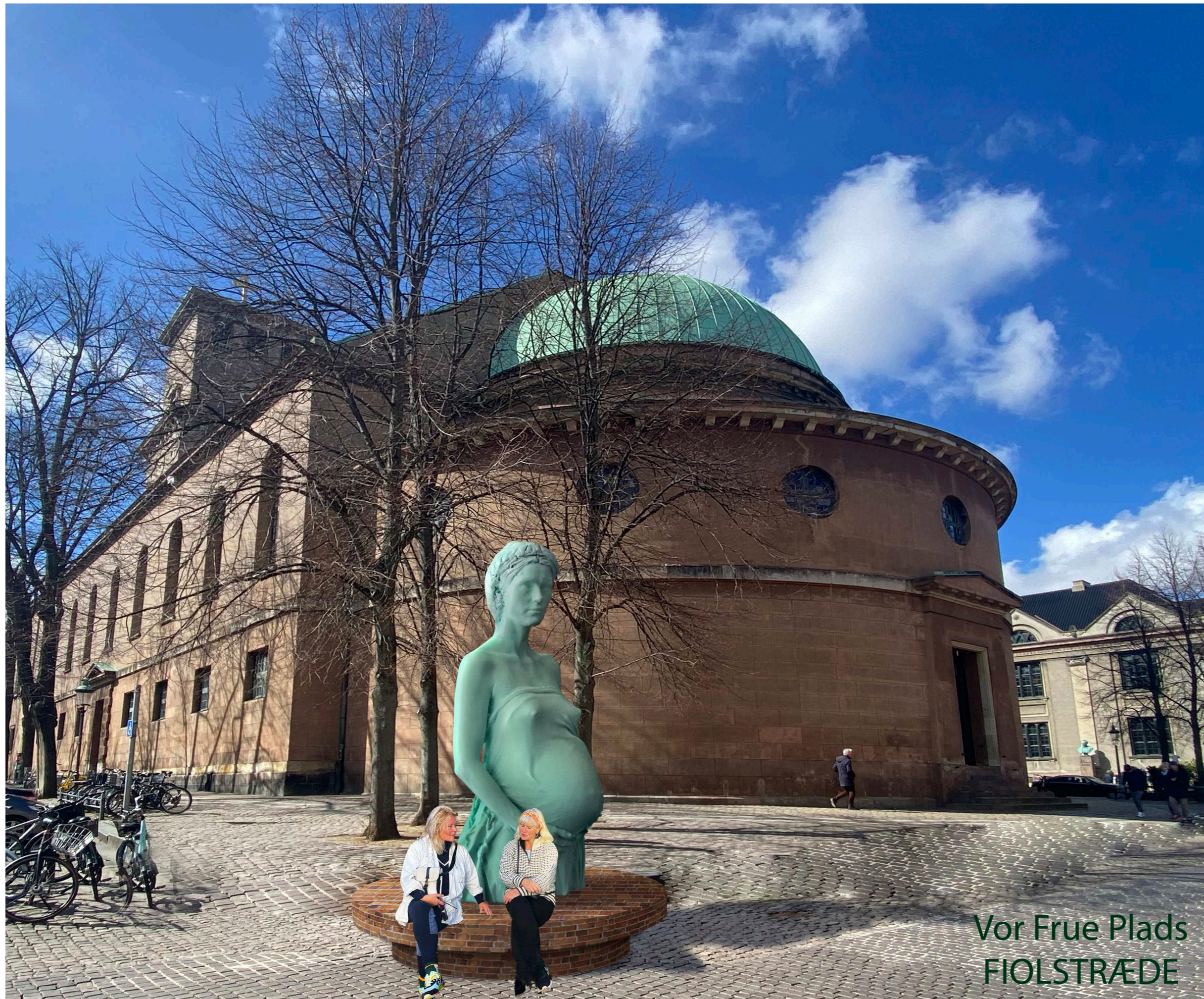
Vor Frue Plads FIOLSTRÆDE

Når jeg ønsker at placere min fortolkning af Messias komme i skulpturform, med Vor Frue Kirke i ryggen, er det fordi jeg tænker, at netop i kirken, hvor man for 2022 år siden med fryd hilste den frugtsommelige mor Jomfru Maria velkommen, netop her hvor glædesbudskabet oplæses, netop her i kirken, hvor vi stadig i 2022 lovsynger "Underet".