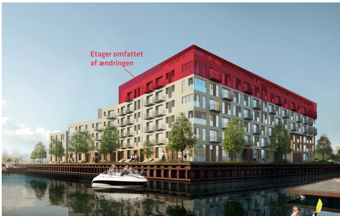
Skitse af det sktuelle projekt for byggefelt O. Etager markeret med rødt er omfattet af ændringen. Ill: Mangor & Nagel.