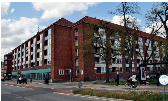
Eksisterende bebyggelse, hjørnet v. Sundholmsvej