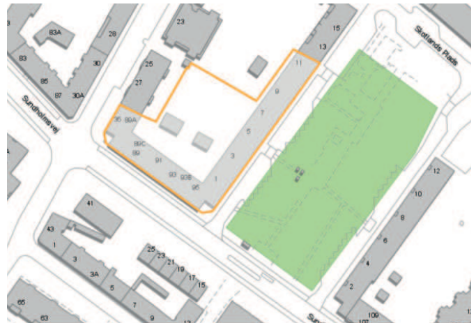
Kort med projektets placering

De nye almene boliger består af 10 familieboliger, 8 store lejligheder på ca 115m 2 , samt 2 mindre på 63-68 m 2 . Hver anden af de eksisterende trappeopgange føres op til tagetagen og danner adgang til 2 lejligheder.