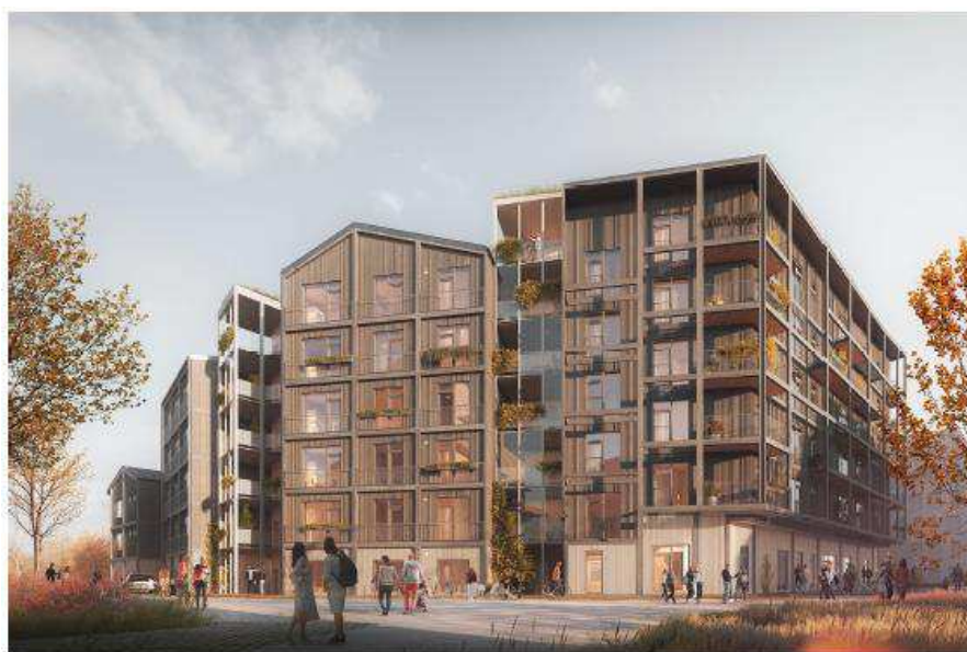
Visualisering, bebyggelsen set fra nord. Illustration: Holscher Nordberg