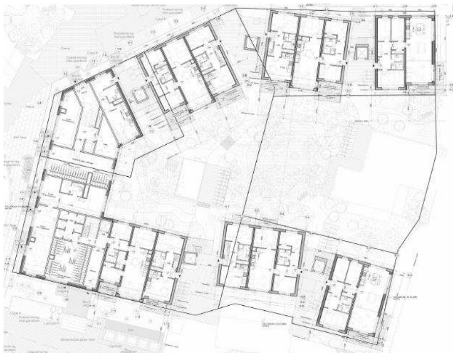
Stueplan, princip med karrédel mod vest og fem punkthuse, hvor der er naturtårne mellem. Illustration: Holscher Nordberg