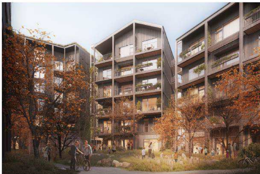
Visualisering, bebyggelsen set fra gårdrummet. Illustration: Holscher Nordberg