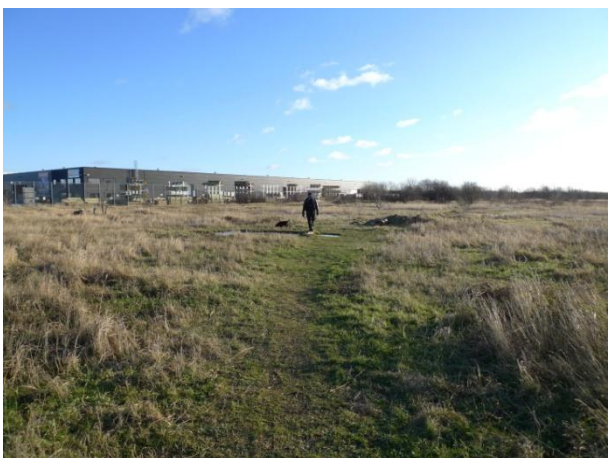
Erhvervsområdet (Stark) set fra det grønne område.