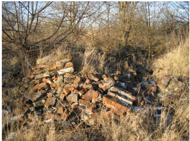
Byggematerialet i undergrunden stikker op i bunker.