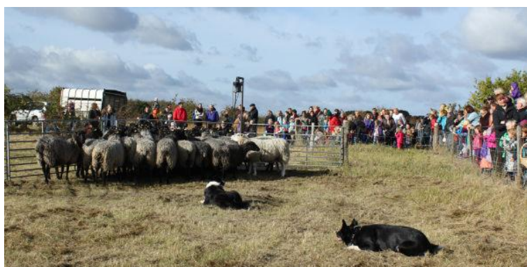
Forventningsfulde tilskuere i sekunderne inden fårene slippes fri.