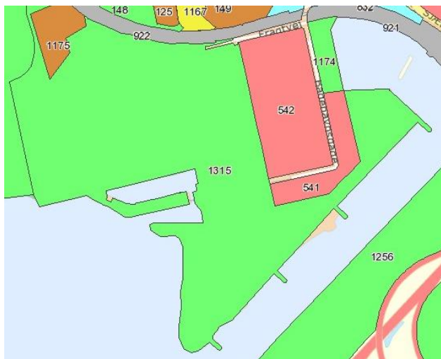
Figur 3: Kommuneplanrammerne er henholdsvis "rekreativt område" (1315) og "blandet bolig og erhverv" (541 og 542).

http://soap.plansystem.dk/pdfarchive/11_1378252_PROPOSAL_1331716196308.pdf . Se også Areal- og lodsejerlisten i bilag 1.