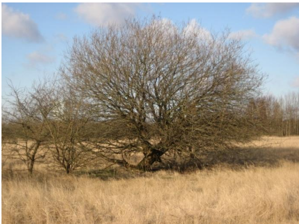
Et af de større og mere bredkronede træer i området.