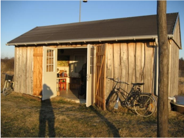
Naturskolen på Sydhavnstippen.