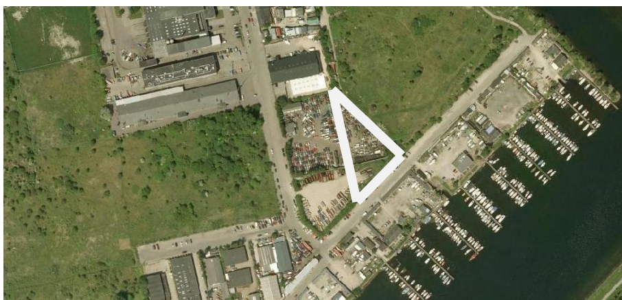
Figur 1: Den del af Stejlepladsen, som i dag fremtræder som indhegnet bil-lodseplads fremgår med hvid firkant på figuren.

I den sydvestlige del af stejlepladsen anvendes et indhegnet område til bil-losseplads, se figur 1. Eftersom området er med i fredningen af Kalvebodkilen fra 1990 formodes det, at bil-lossepladsen er opstået ulovligt. DN Kbh har anmeldt dette til kommunen. Hvis formodningen er rigtig, forventes kommunen at udstede et påbud om retablering af naturområde/stejleplads. Hvis bil-lossepladsen fandtes, da området blev fredet i 1990, indtræder der en særbestemmelse i denne fredning om retablering af området, når anvendelsen til bil-losseplads ophører. Området er ligesom resten af Stejlepladsen umatrikuleret.