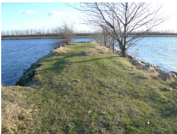
Den sydligste "mole" er et fint udflugtsmål.