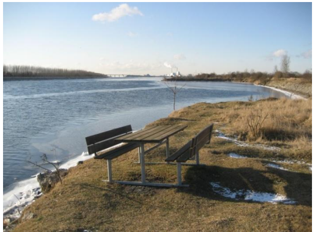
Bord og bænke med udsigt over Kalveboderne.