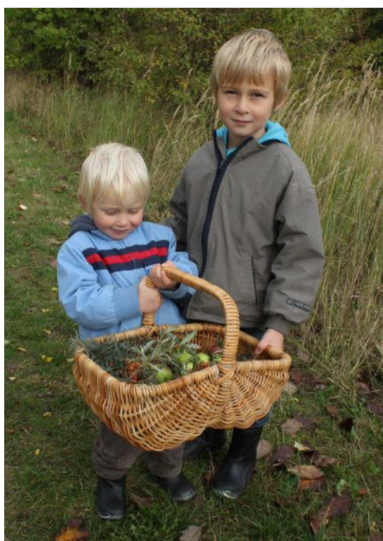
Naturens goder fra Sydhavnstippen.