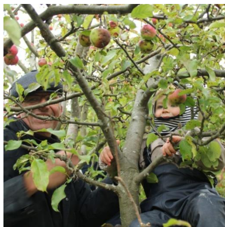
Æblehøst til høstpicnic.