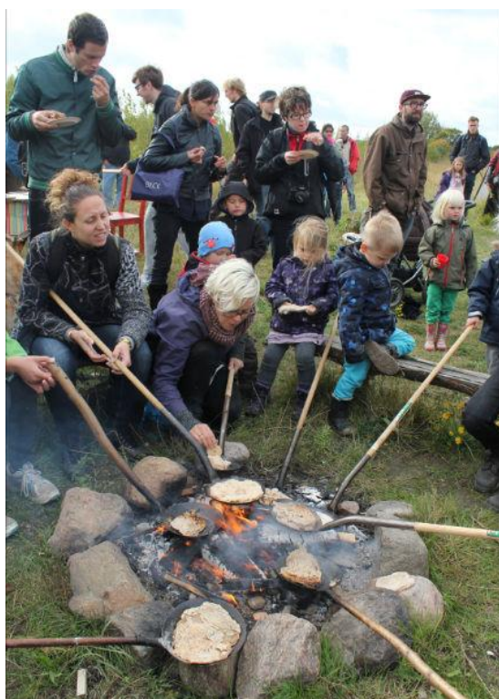
Pandekager til høstpicnic.