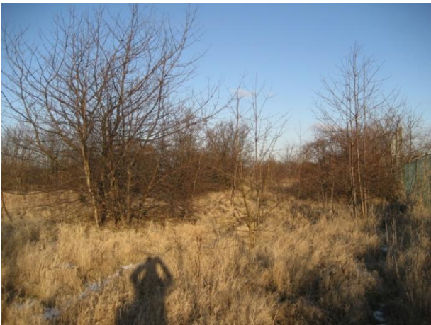
Et typisk område med spredt opvækst af træer.