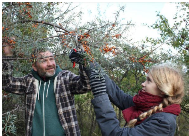
Plukning af havtorn til høstpicnic.