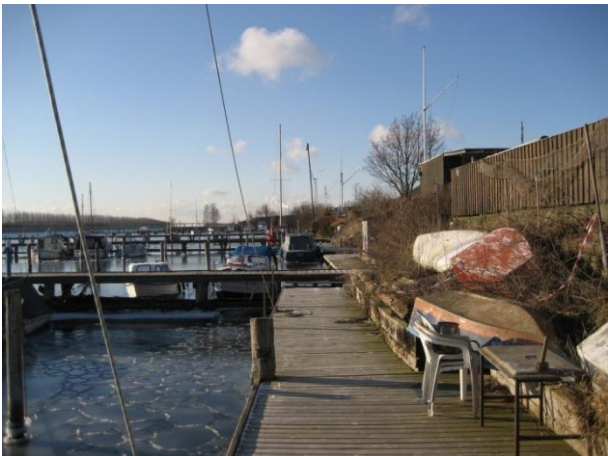
Lystbådehavnen i udkanten af fredningsområdet.