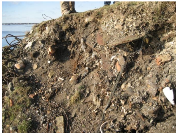
Byggematerialet ses tydeligst i kystskrænten.