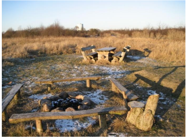
Et af picnic-stederne på Sydhavnstippen.