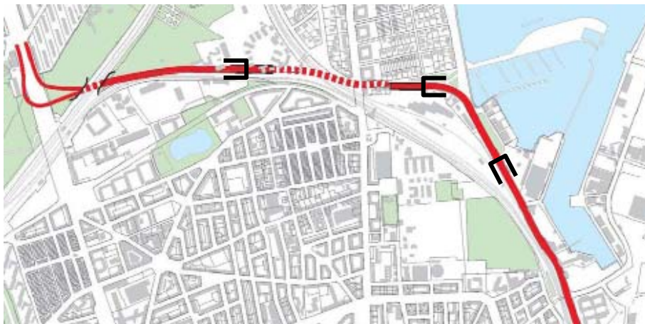
Omtrentlig placering af de alternative tunnelmundinger

I tillæg er vurderet en forlængelse af tunnelen med ca. 100 m. i begge ender, for at minimere de lokale gener. Denne forlængelse er vurderet at koste ca. 200 mio. kr. ekstra. En yderligere forlængelse af tunnelen på ca. 500 m. til Svanemølleværket er også vurderet oversigtligt, og forventes at koste ca. ½ mia. kr. Formålet er at fredeliggøre området ved Strandøre, Svanemøllehavnen og den kommende badestrand.