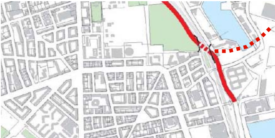
Mulig fremtidig videreførelse af vejforslag 2 mod Nordhavnen og havnetunnelen. Lader sig kun realisere, hvis hele vejen ligger i tunnel.

I forbindelse med undersøgelsen af den langsgående havnetunnel er det vurderet, at Nordhavnsvejen i 2045 – en situation med en fuldt udbygget Nordhavn, stor byudvikling på det nordøstlige Amager inkl. Refshaleøen og en langsgående havnetunnel hele vejen til Sjællandsbroen – vil blive benyttet af ca. 55.000 biler på et hverdagsdøgn. Dette svarer i dagens situation til trafikken på nogle af de største veje i kommunen og overgås kun af nogle af motorvejene samt strækningen fra Hareskovvej til Langebro samt Lyngbyvej og Sjællandsbroen. Den fremtidige trafikmængde betyder, at Nordhavnsvejen bør forbedres for seks spor i stedet for fire.