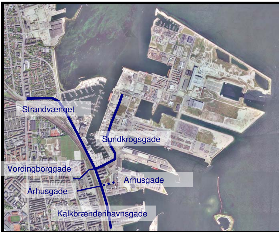
Nordhavnsområdet med den eksisterende adgangsvej (Sundkrogsgade) og den kommende adgangsvej (Århusgade)

Den videre fordeling af trafikken sker ad Kalkbrænderihavns-gade. Mod Nord forbindes Kalkbrænderihavns-gade med Strandvænget og Strandvejen. Mod syd forbindes Kalkbrænderihavns-gade med Folke Bernadottes Alle og Oslo Plads. Endelig er der også i dag en forbindelse til Østerbro ad hhv. Århusgade (ensrettet mod Kalkbrænderihavns-gade) og Vordingborggade (ensrettet fra Kalkbrænderihavns-gade).