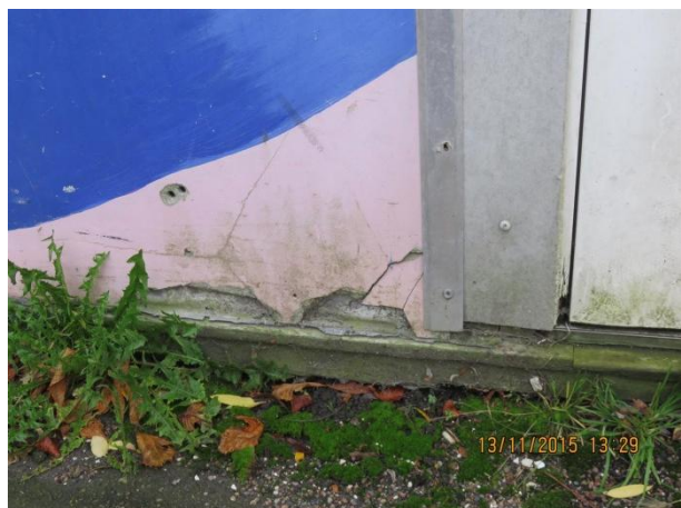
Gavl mod nord, revner i eternit beklædning