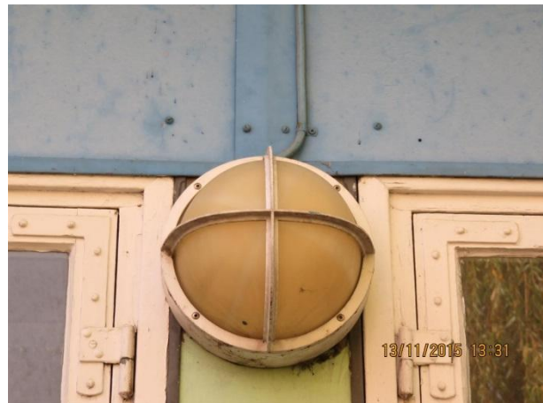
Skotlampe med stærkt gulnet skærm