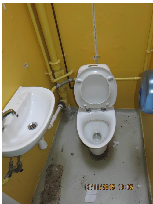
Malingslag på terrazzogulv er slidt igennem