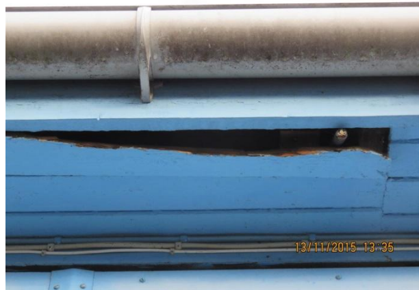
Tagrende og udhængsbrædder