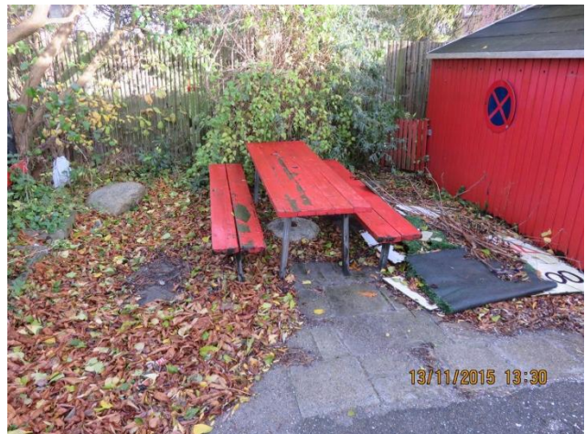
Bænk på terrasse ved legeplads