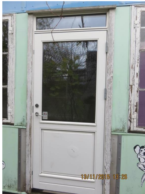
Nyere yderdør monteret i gammel ramme