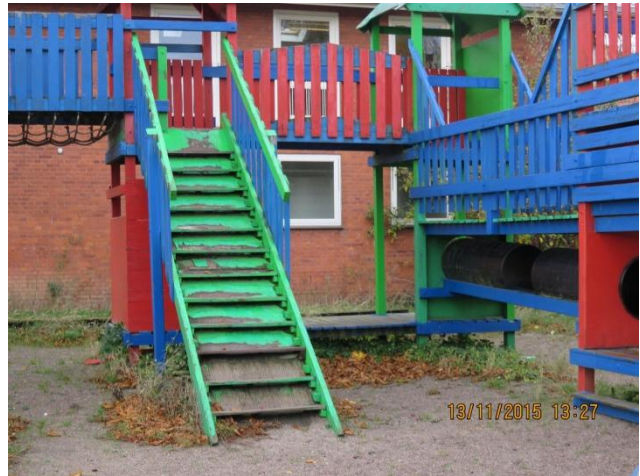
Trappe på legeplads