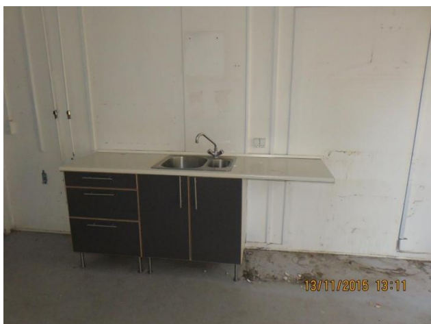
Køkken er stærkt nedslidt, hvidevarer er afmonteret