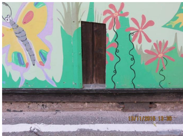
Facade mod vest, afskallet eternitbeklædning