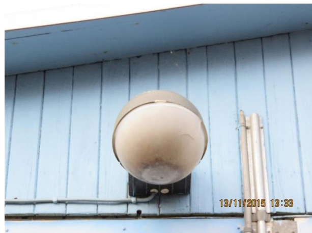
Itugået lampe, med spor efter indtrængende vand