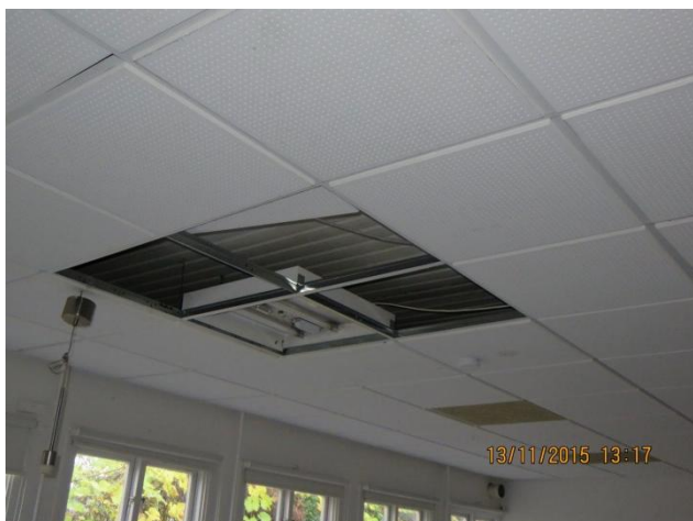
Lofter bærer flere steder præg af afmonterede armaturer mv.