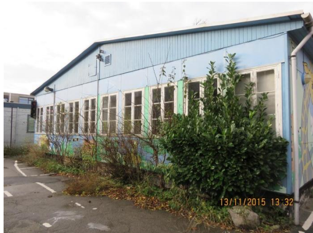
Gavl mod syd