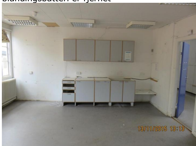
Køkken er stærkt nedslidt, hvidevarer, vask og armaturer er afmonteret