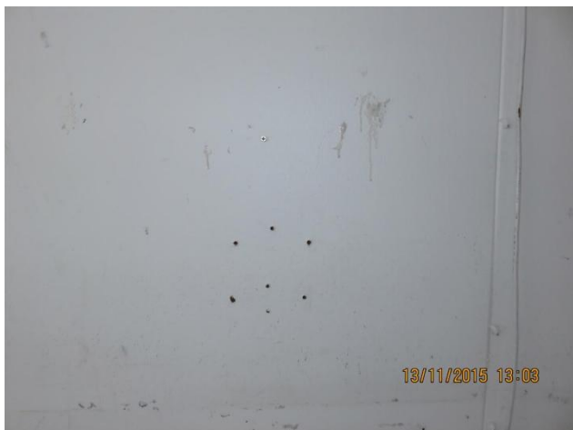
Væggene bærer præg af stærk nedslidning igennem mange år