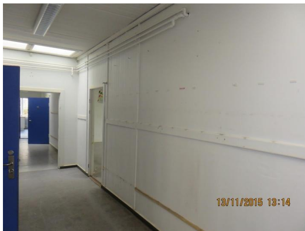
Vægoverflade skifter imellem gipsplader og de oprindelige brædder