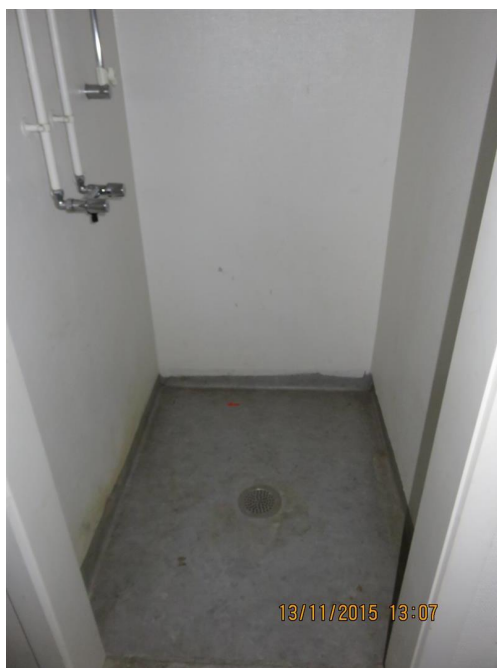
Gulv og vægge i bad er nedslidte, blandingsbatteri er fjernet