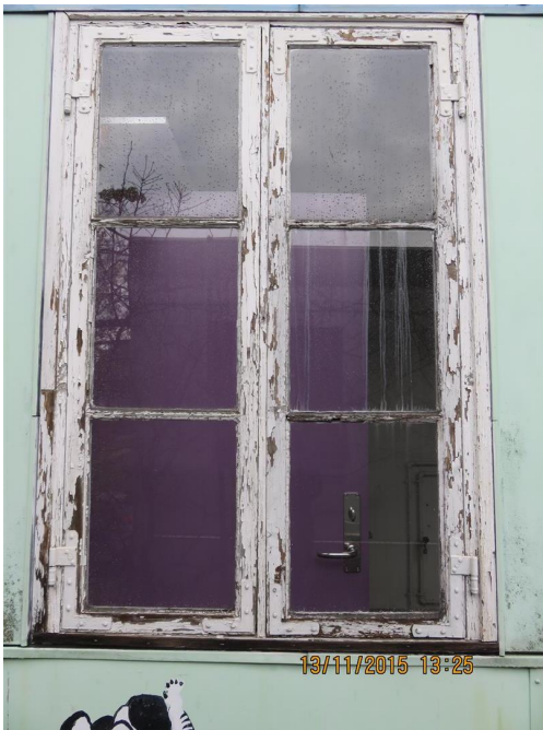
Oprindeligt vindue med enkelt glas