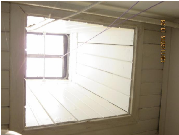
Oprindeligt tagvindue med enkelt glas