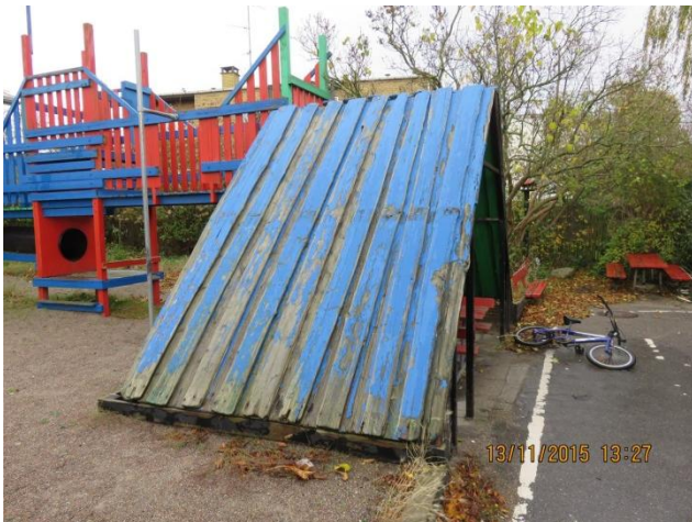
Tag på legehus