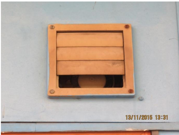
Lamelventil med manglende blad