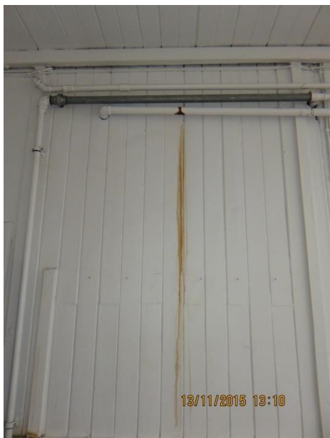
Væg med oprindelige brædder