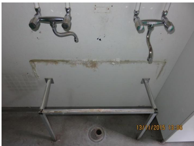
Vask + afløbsrør er fjernet på forrum til WC'er