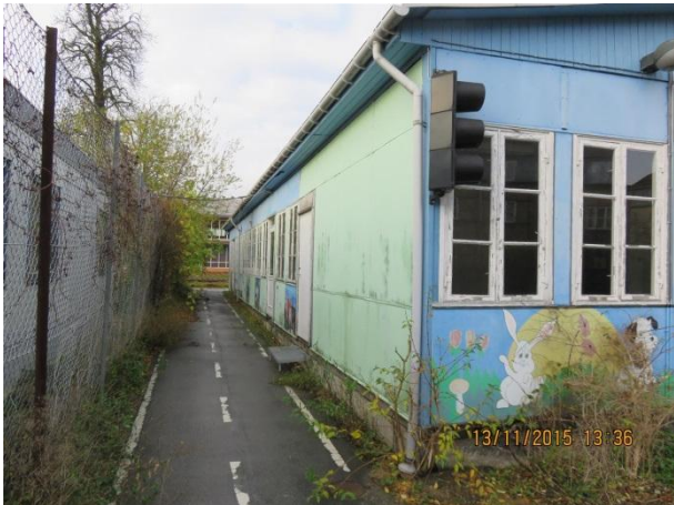
Facade mod øst