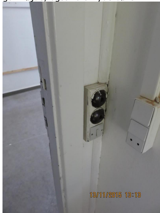
Gamle og ældre kontakter