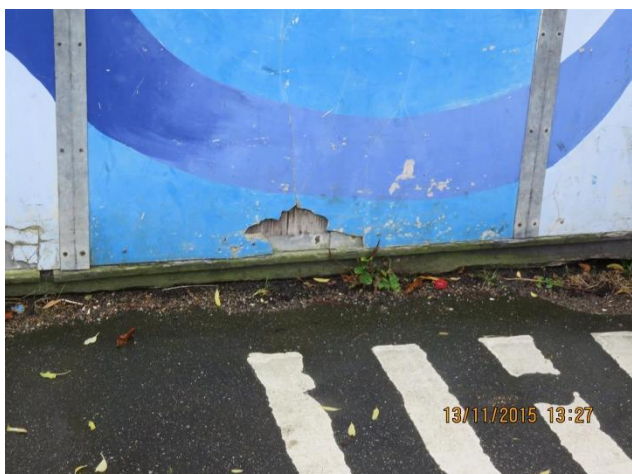
Skjult sokkel hvor dækbræt hviler af på jord