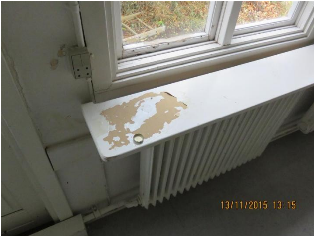
Ældre ribberadiator under vinduesplade