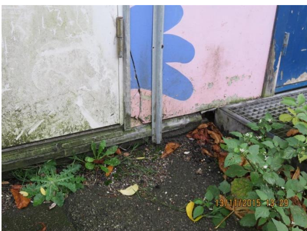
Gavl mod nord, revner i eternit beklædning