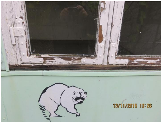
Afskallet malingslag og kitning