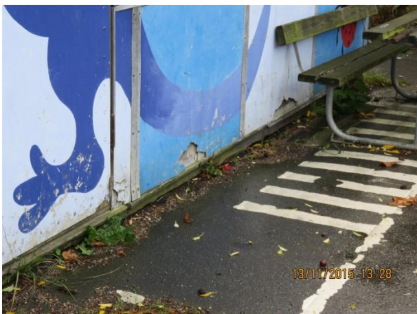
Gavl mod nord, afskallet eternitbeklædning