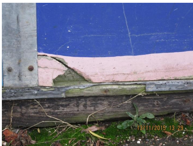
Skjult sokkel hvor dækbræt hviler af på jord