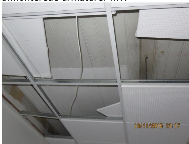
Lofter bærer flere steder præg af afmonterede armaturer mv.