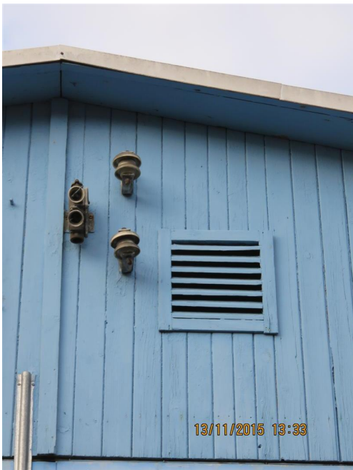
Ventilations trærist til loft, gamle forbindelser til luftledninger