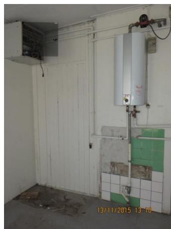
Afkoblet krydsfelt og el vandvarmer