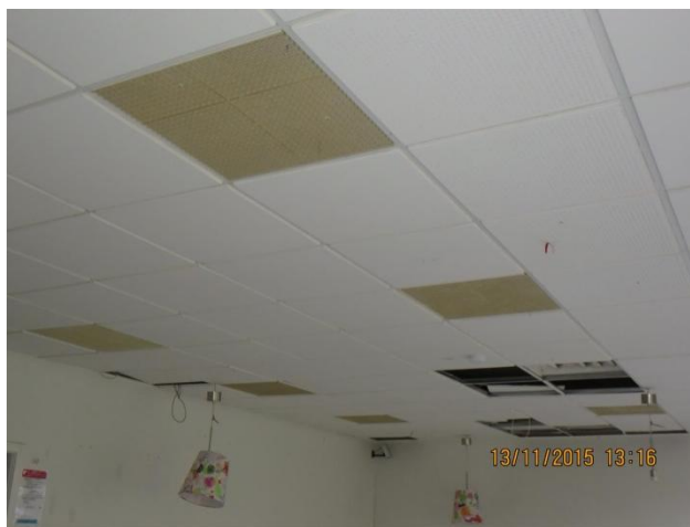
Lofter bærer flere steder præg af afmonterede armaturer mv.