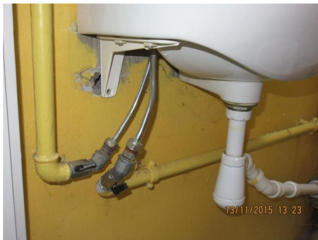
Vægge på toiletter mangler vedligeholdelse