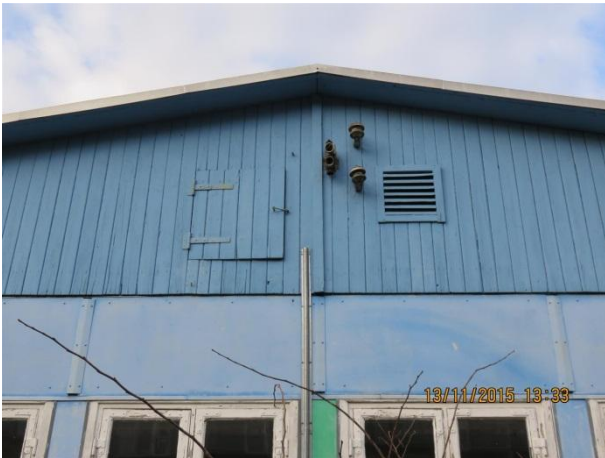
Gavl mod gade