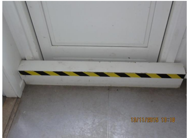
Koblingsledninger til radiatorer er alle ført i gulvhøjde, også foran yderdøre