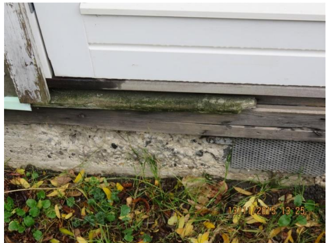
Drypkant rådnet væk ved bundstykke