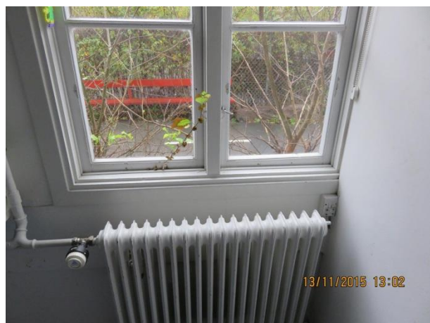
Vindue hvor grene er vokset ind i huset