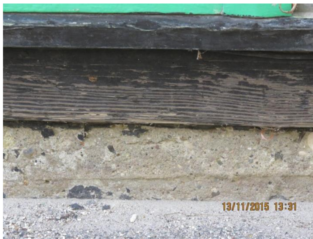
Dækbræt på synlig del af sokkel