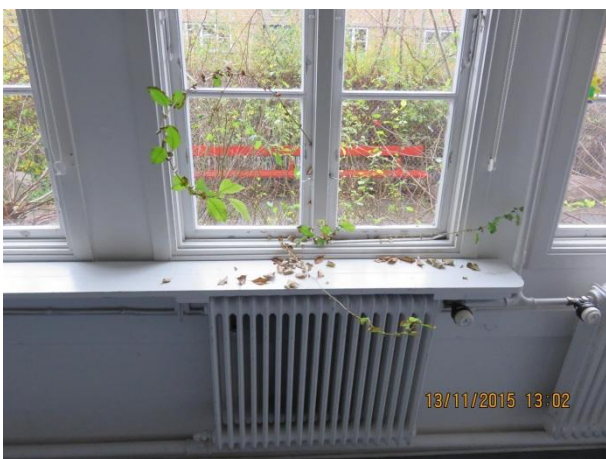
Vindue hvor grene er vokset ind i huset