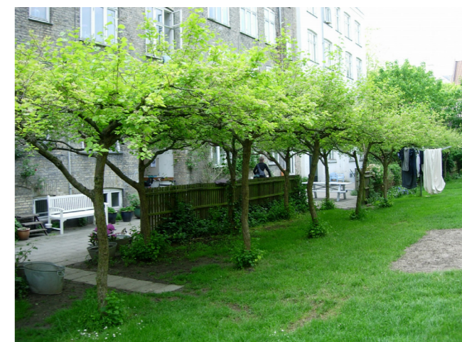
Nærophold. Referencebillede fra færdig gårdhave