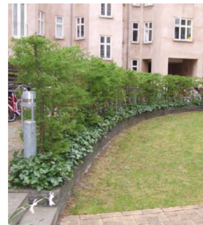
Hæk. Referencebillede fra færdig gårdhave