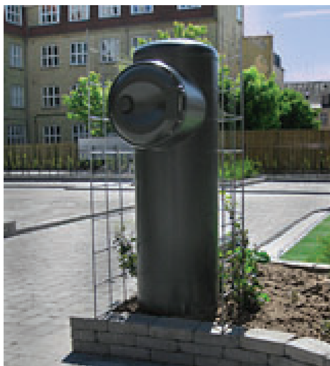
Indkast til affald. Referencebillede fra færdig gårdhave