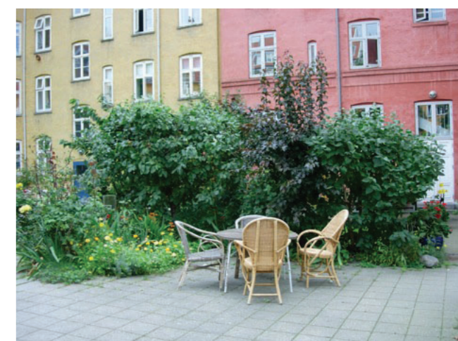
Ophold på fliser. Referencebillede fra færdig gårdhave