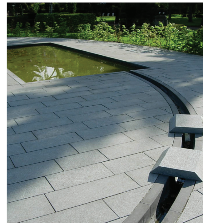
Vandrende. Referencebillede fra færdig gårdhave

Udgifterne til driften skal fordeles mellem ejendommene i forhold til disses bruttoetagearealer.