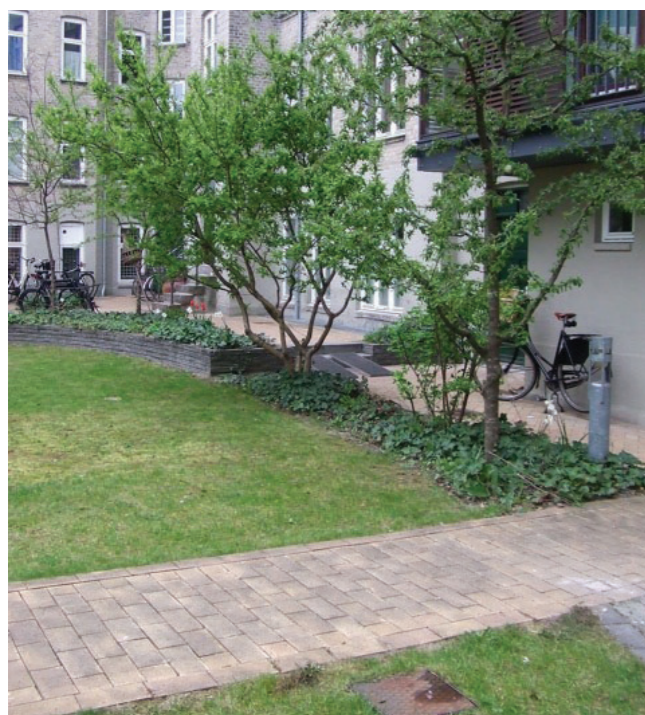
Støttevæg. Referencebillede fra færdig gårdhave

Restaffaldet pap og papir placeres i 240 l containere, dels i det eksisterende affaldshus ved gavlen af Østerbrogade 152/154 og dels i den lavere del af gården mod Vordingborggade. Containerne afskærmes med et halvtæg.