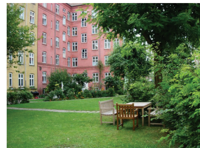
Ophold på græs. Referencebillede fra færdig gårdhave

Der udføres et underjordisk affaldssystem, et skraldsugeanlæg. Det betyder, at der i gården opstilles indkastningsstandere ved to affaldsstationer, én udfor Kertemindegade 7/9 og én nærmere Vordingborggadesiden.