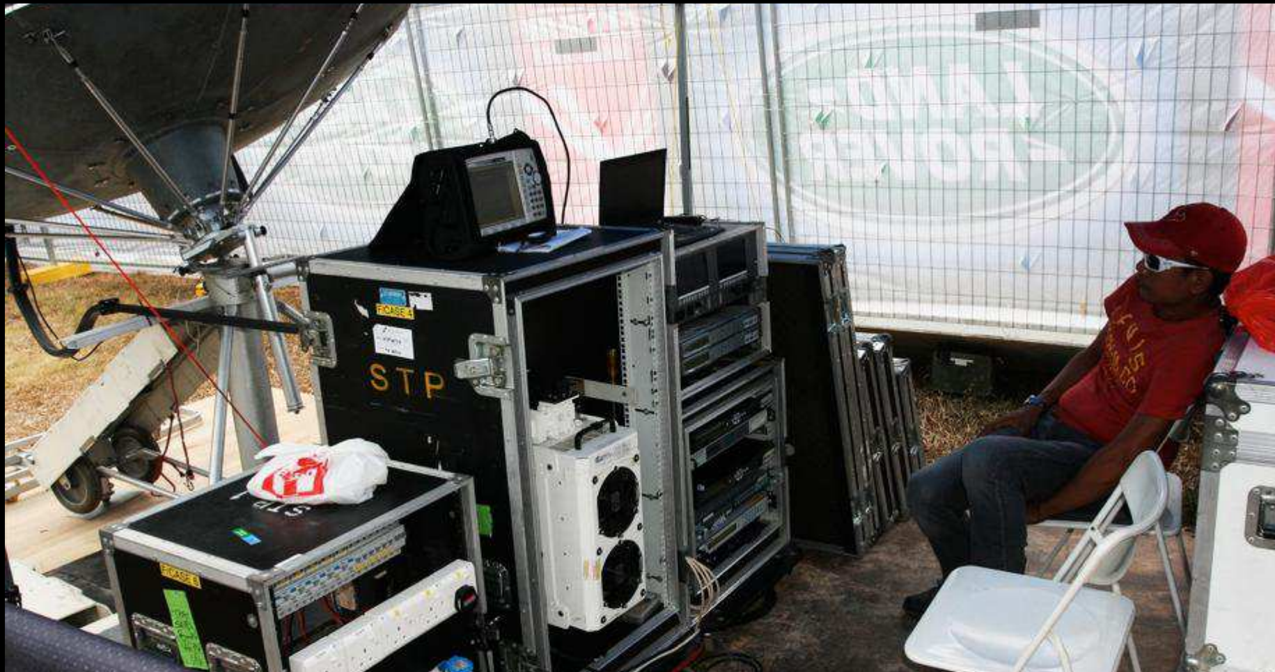
SENDING THE LIVE TV SIGNAL VIA SATELLITE WORLDWIDE