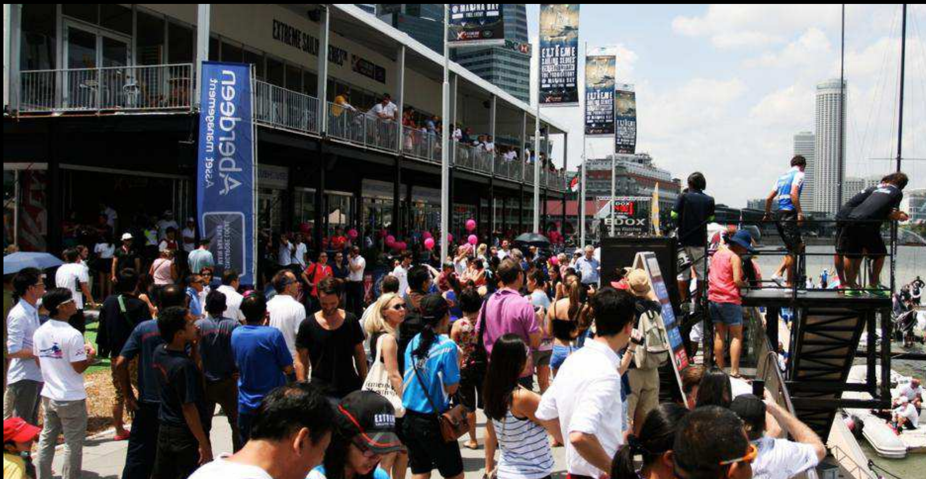
SKIPPERS PARADE TO PONTOON