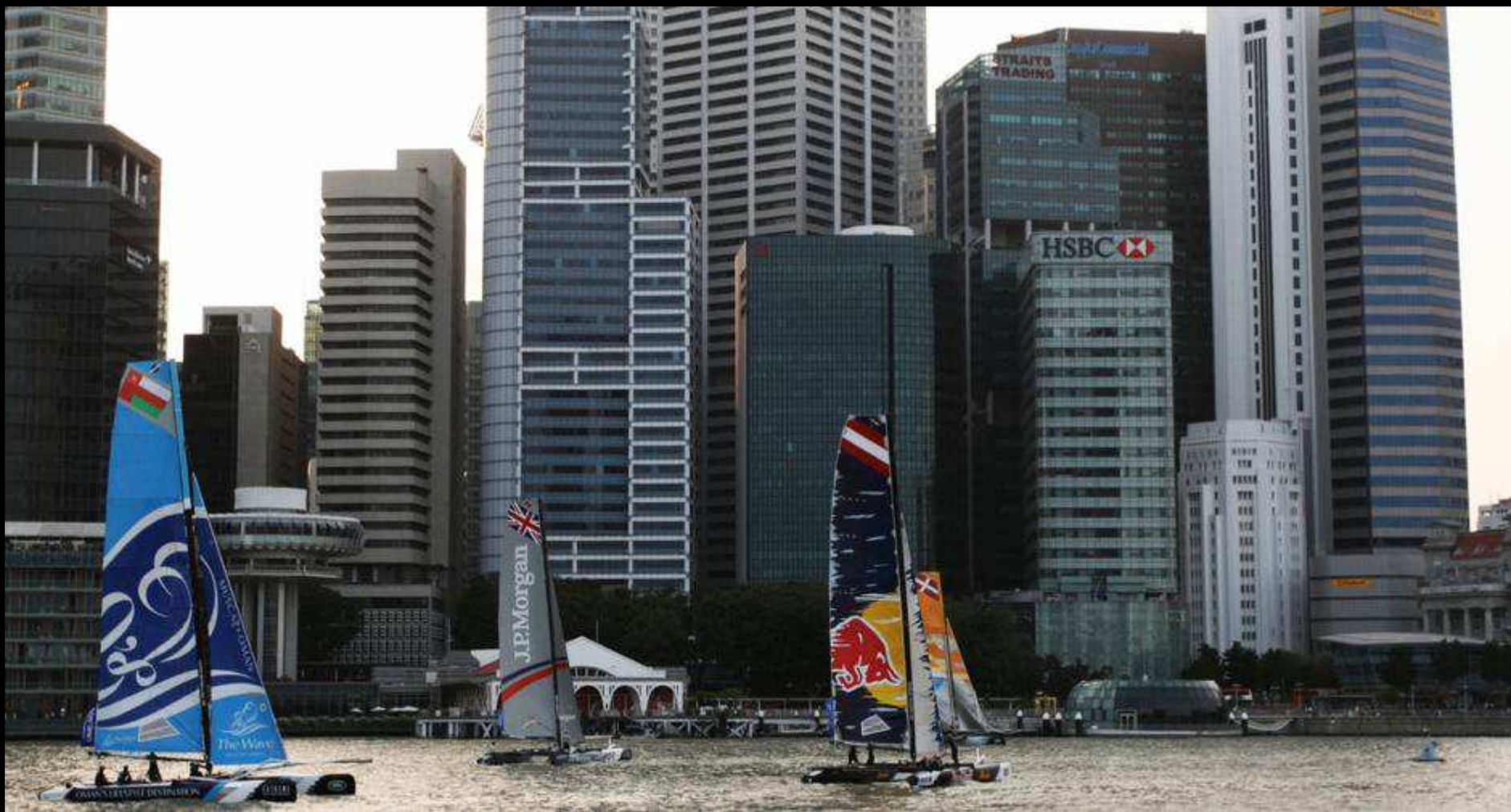
ELITE STADIUM RACING IN THE HEART OF THE CITY