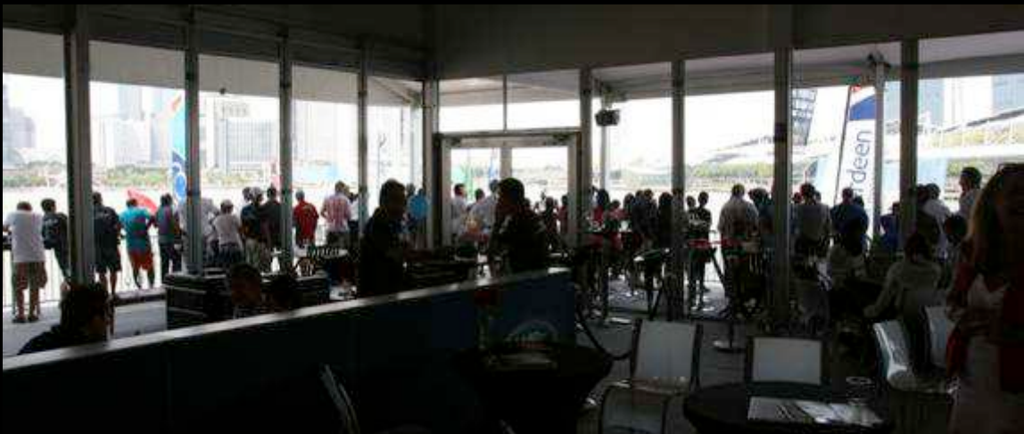
A PLACE FOR EVERYONE (SPECTATORS, MEDIA & VIPS)