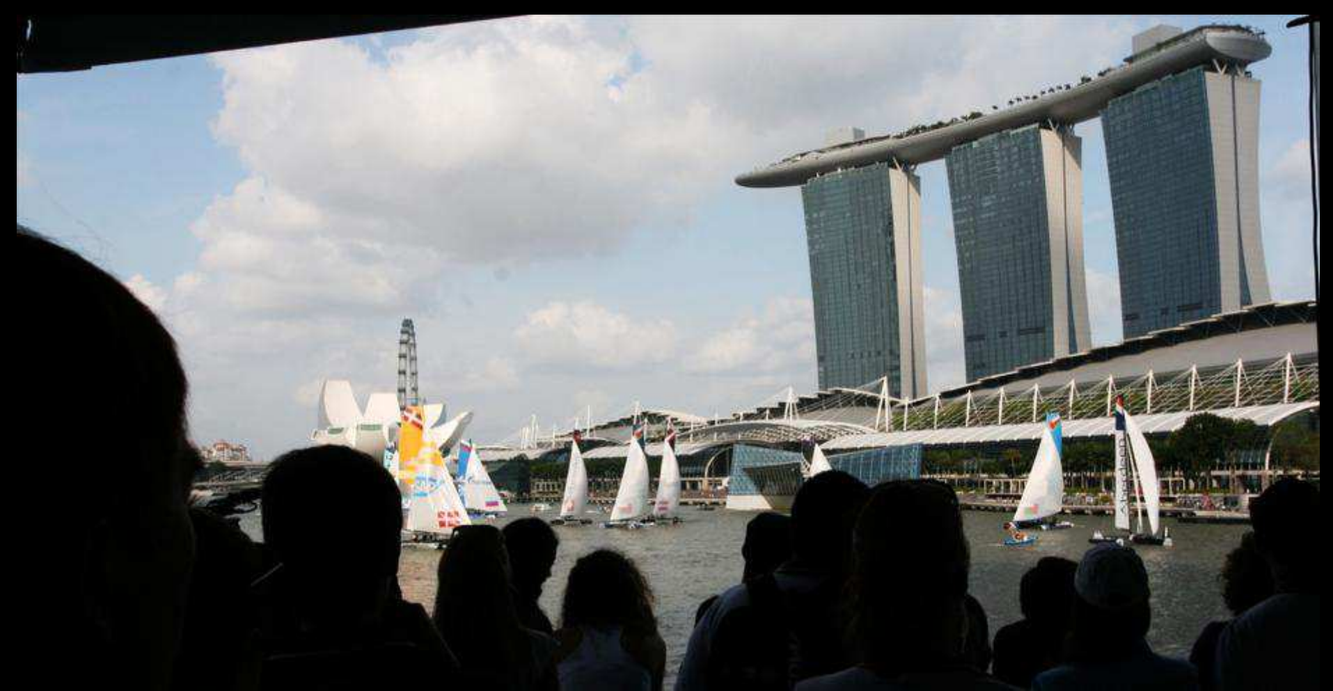
A FEW HUNDRED VIPs HOSTED IN THE EXTREME CLUB