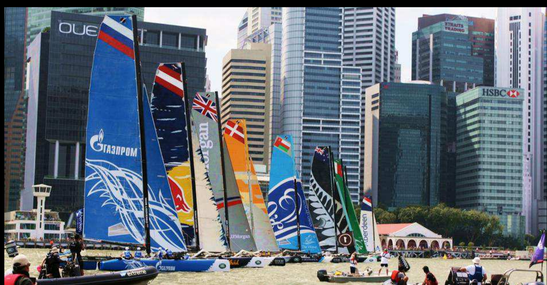
A COLORFUL SPECTACLE