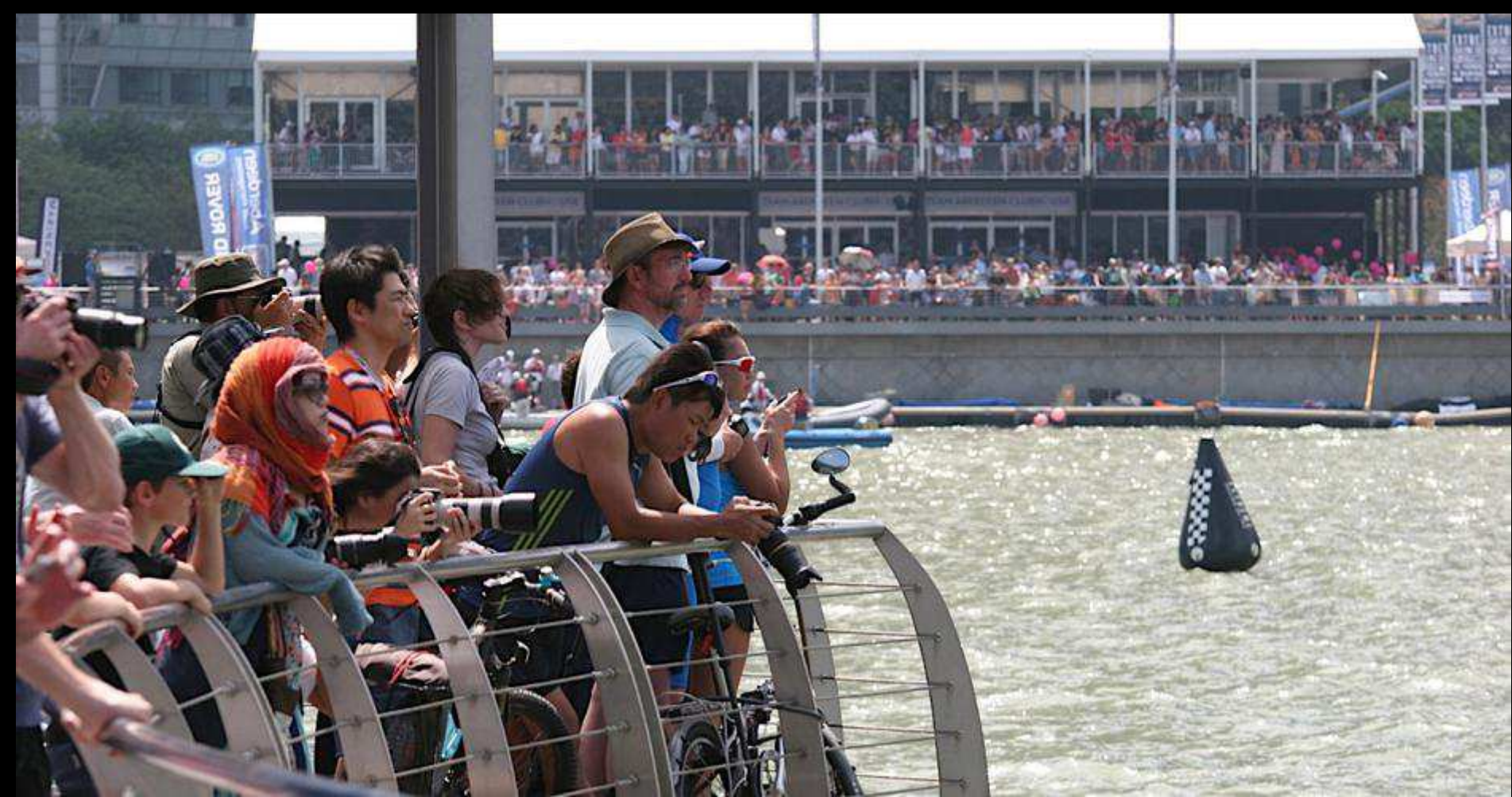
SPECTATORS ALL AROUND THE MARINA BAY