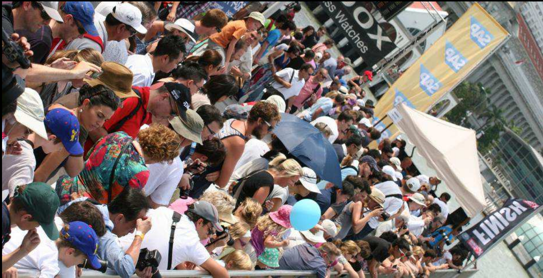
OVER 30,000 SPECTATORS WITHIN THE PUBLIC RACE VILLAGE