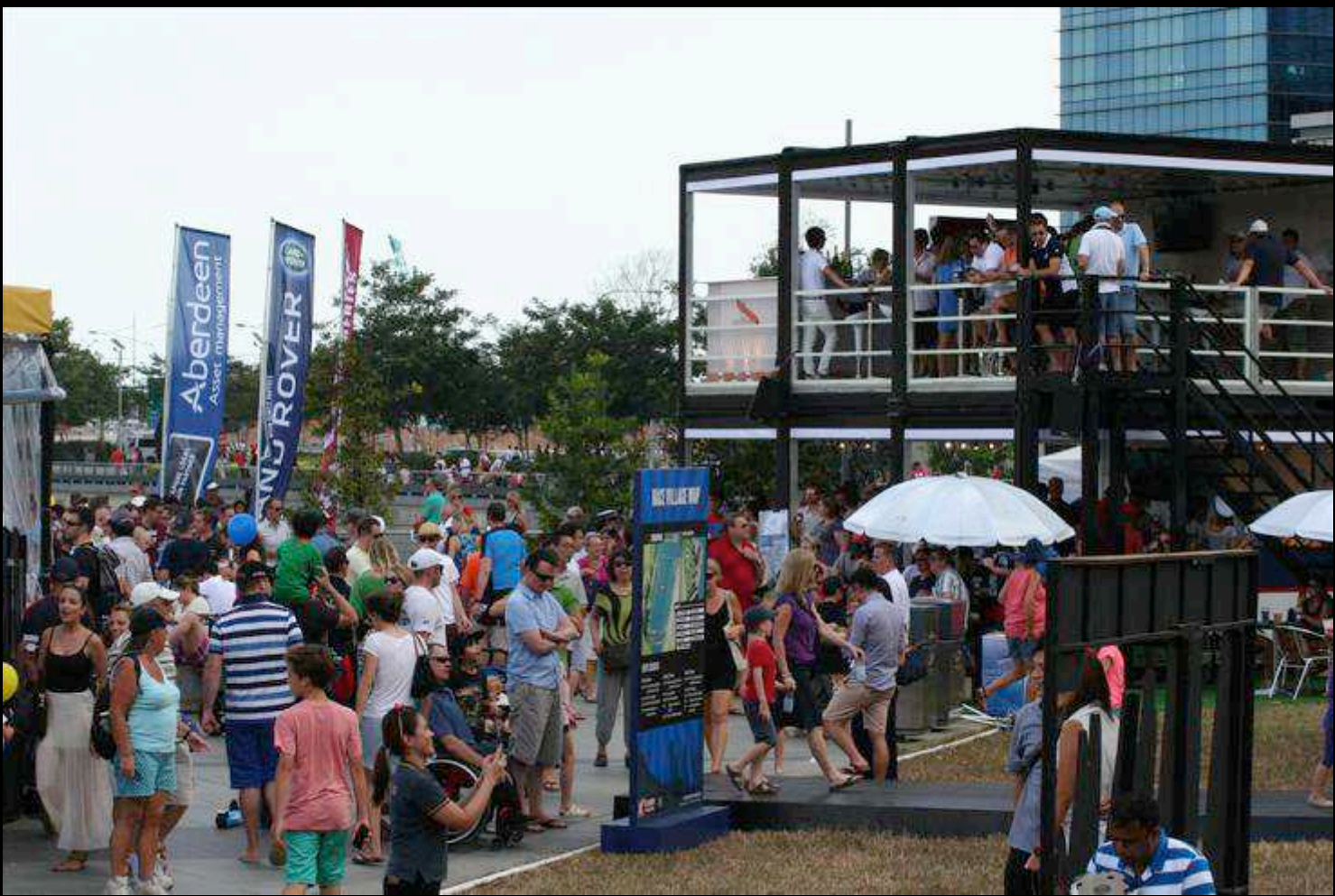
DIVERSE ACTIVATION IN THE RACE VILLAGE