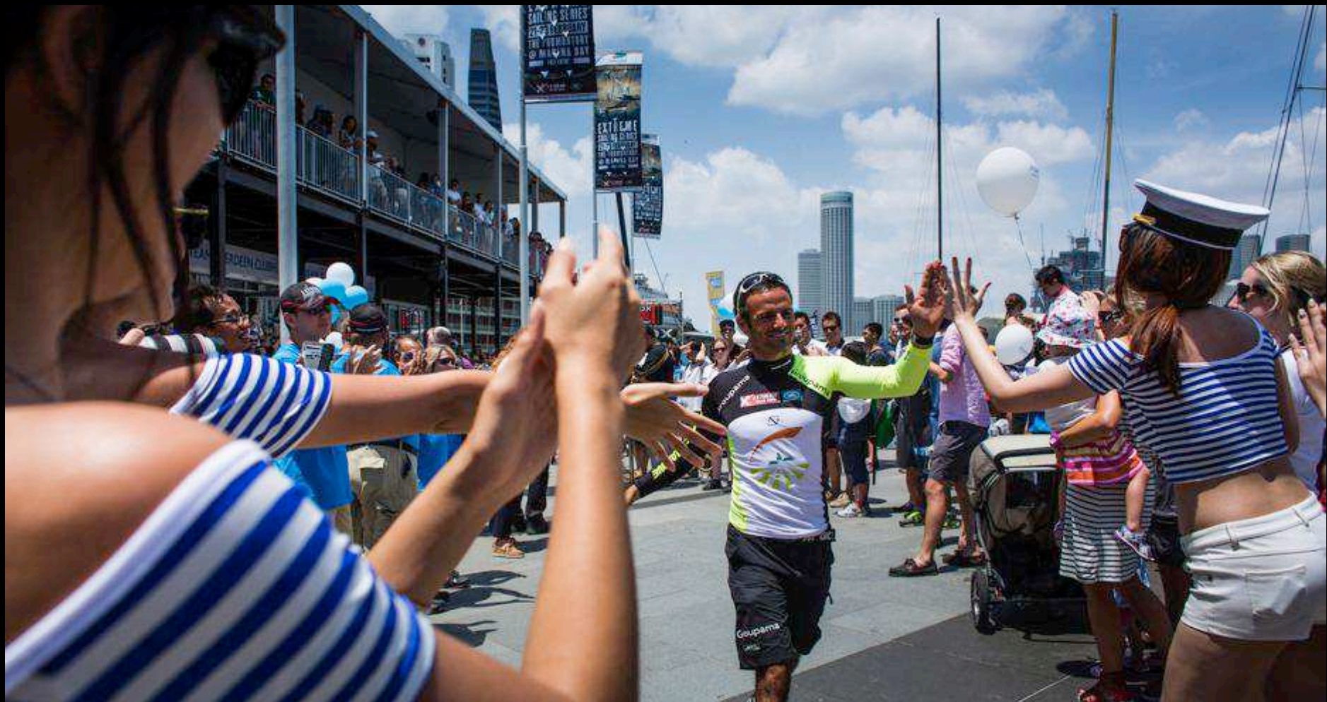
SKIPPERS PARADE TO PONTOON