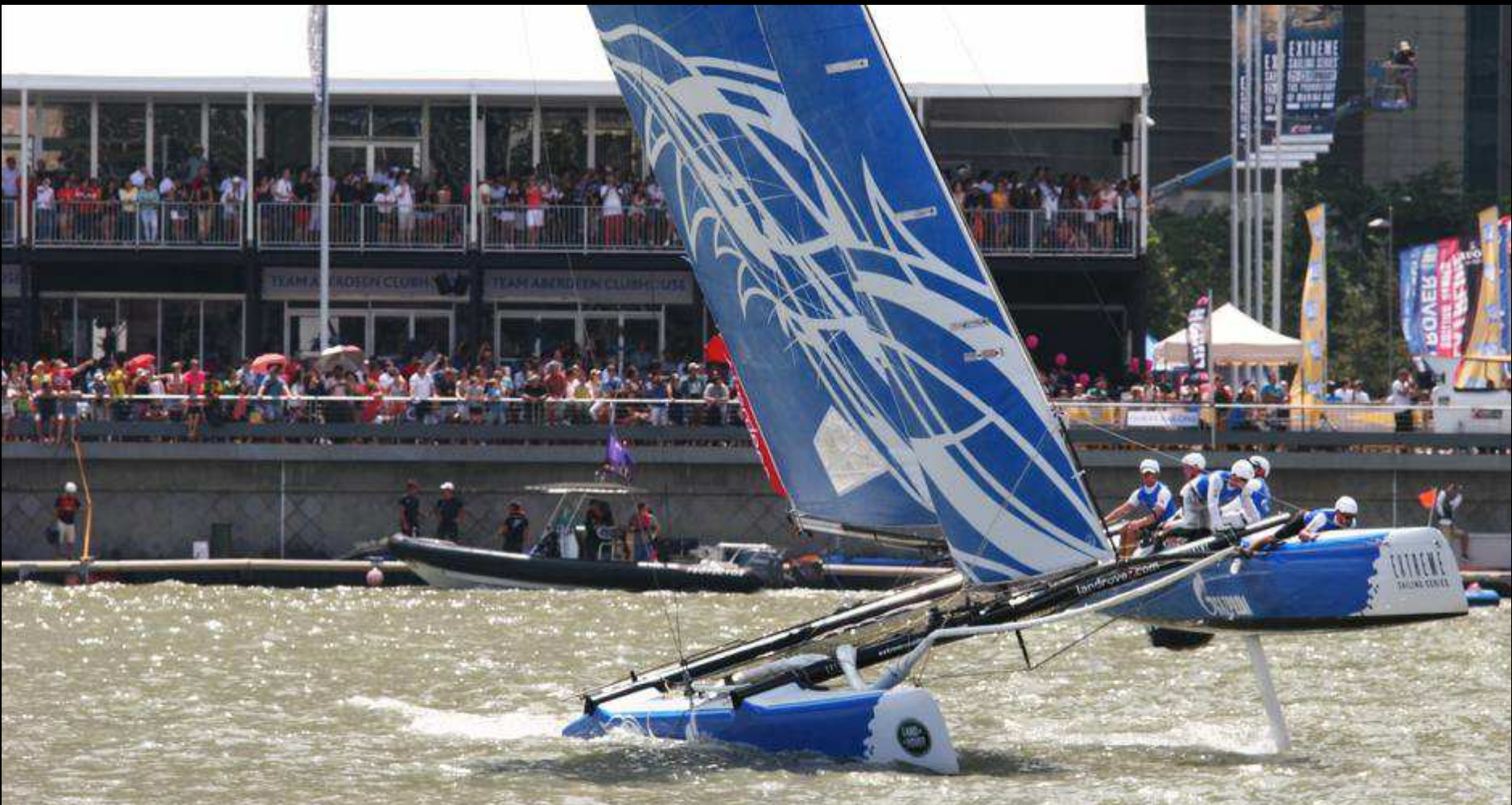
WITH THE BEST PERSPECTIVE TO WITNESS THE ACTION