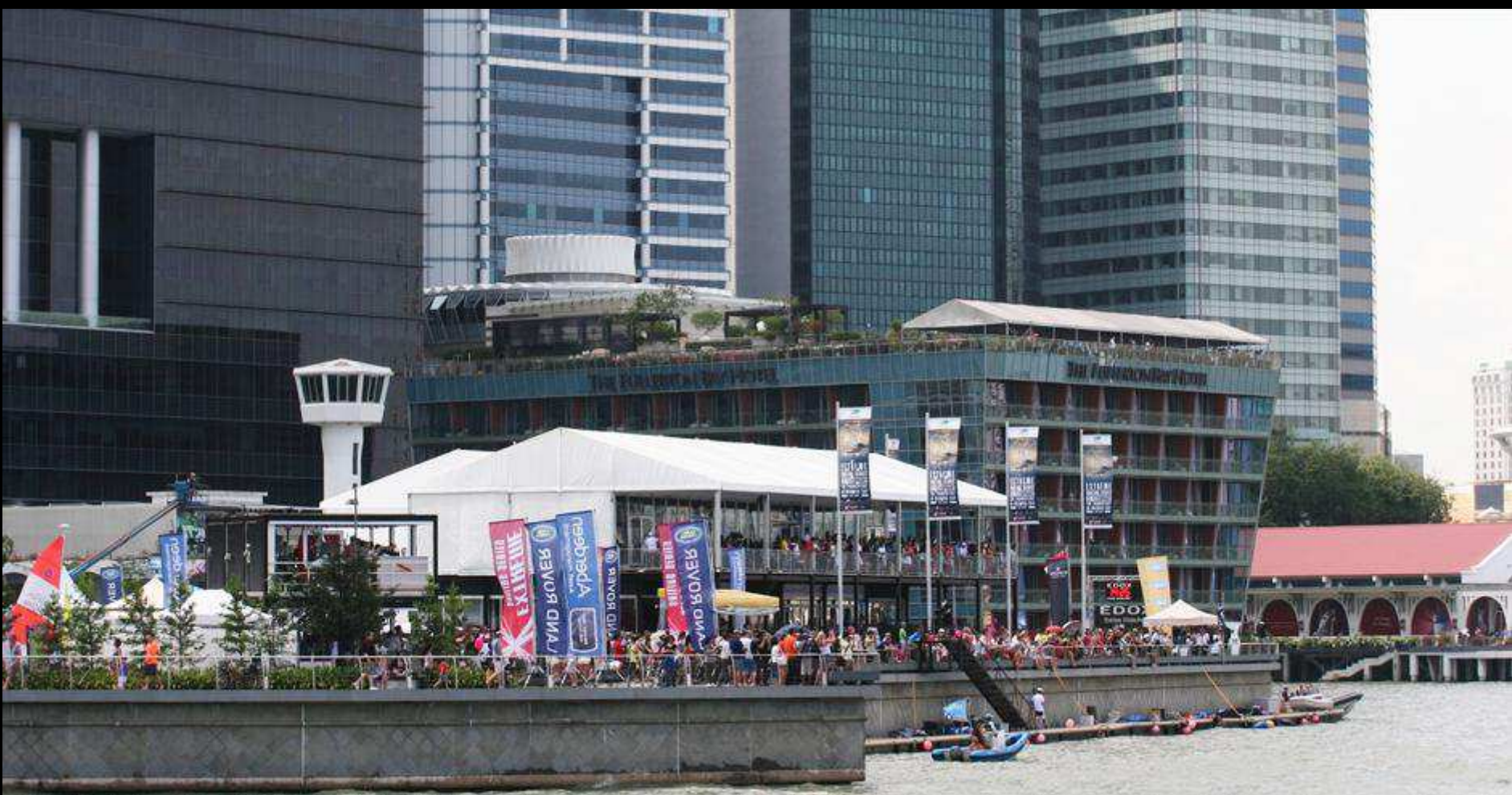
ICONIC AND ACCESSIBLE LOCATION