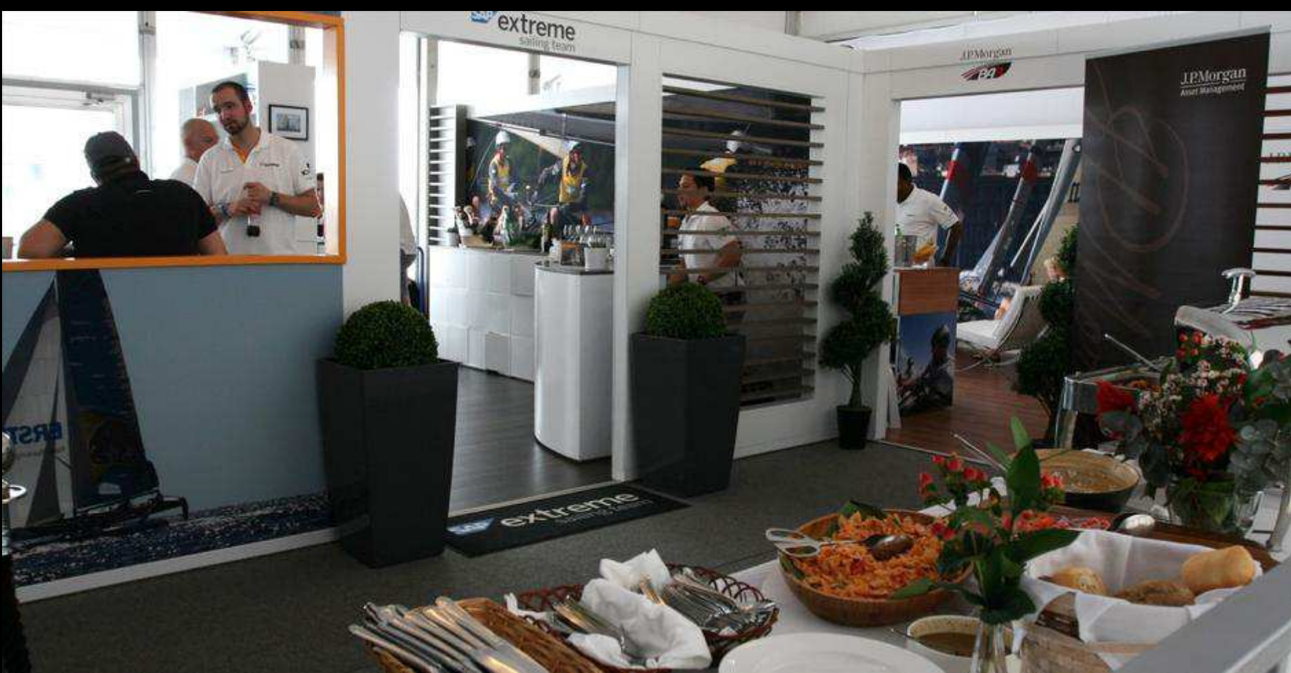
PREMIUM CORPORATE VIP GUEST EXPERIENCE (JP MORGAN & SAP SUITES)