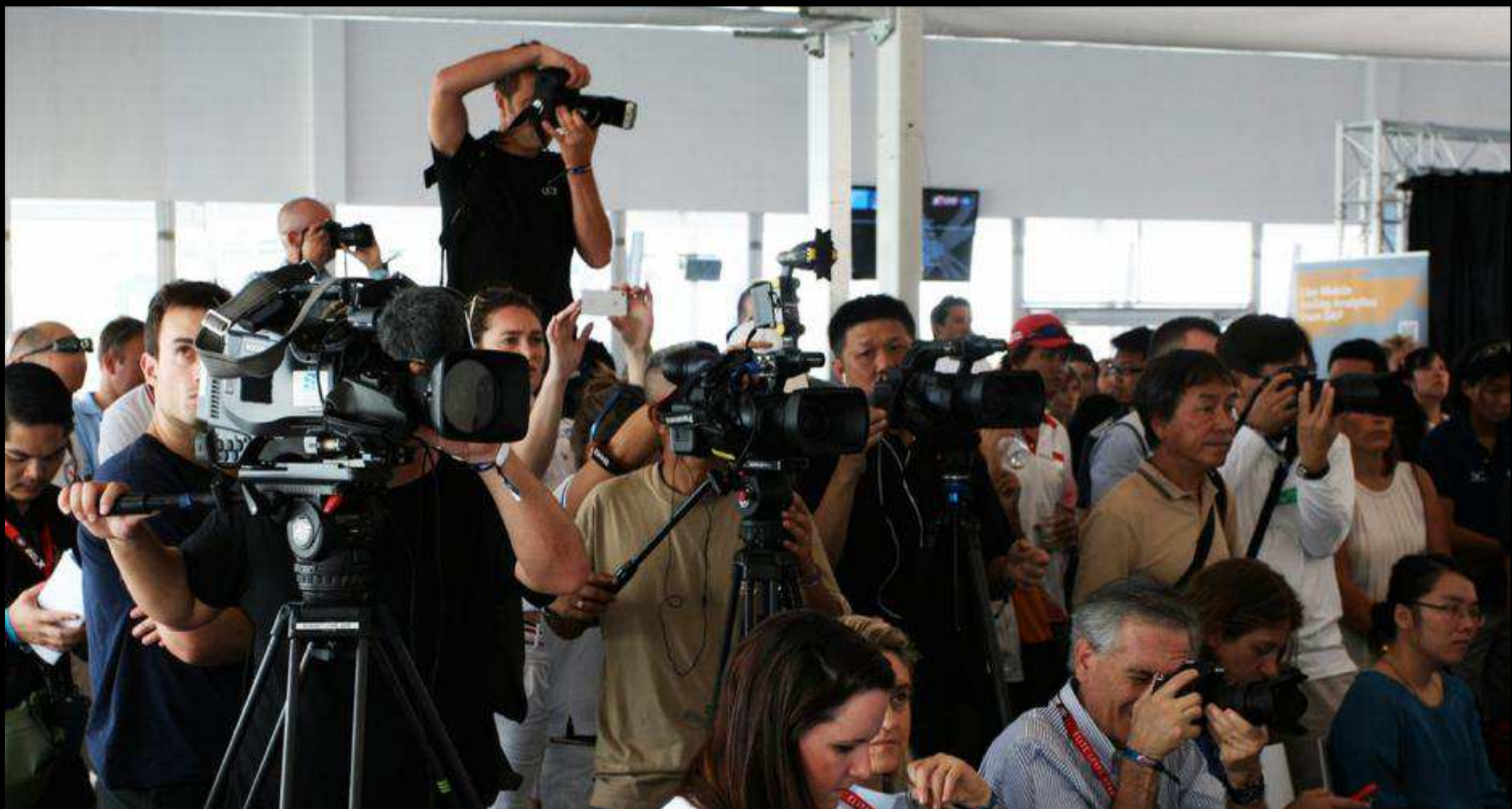
GREAT MEDIA COVERAGE