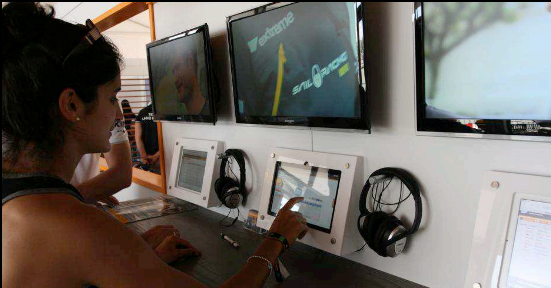
SAP ANALYTICS LIVE INFORMATION ACCESIBLE TO THE PUBLIC