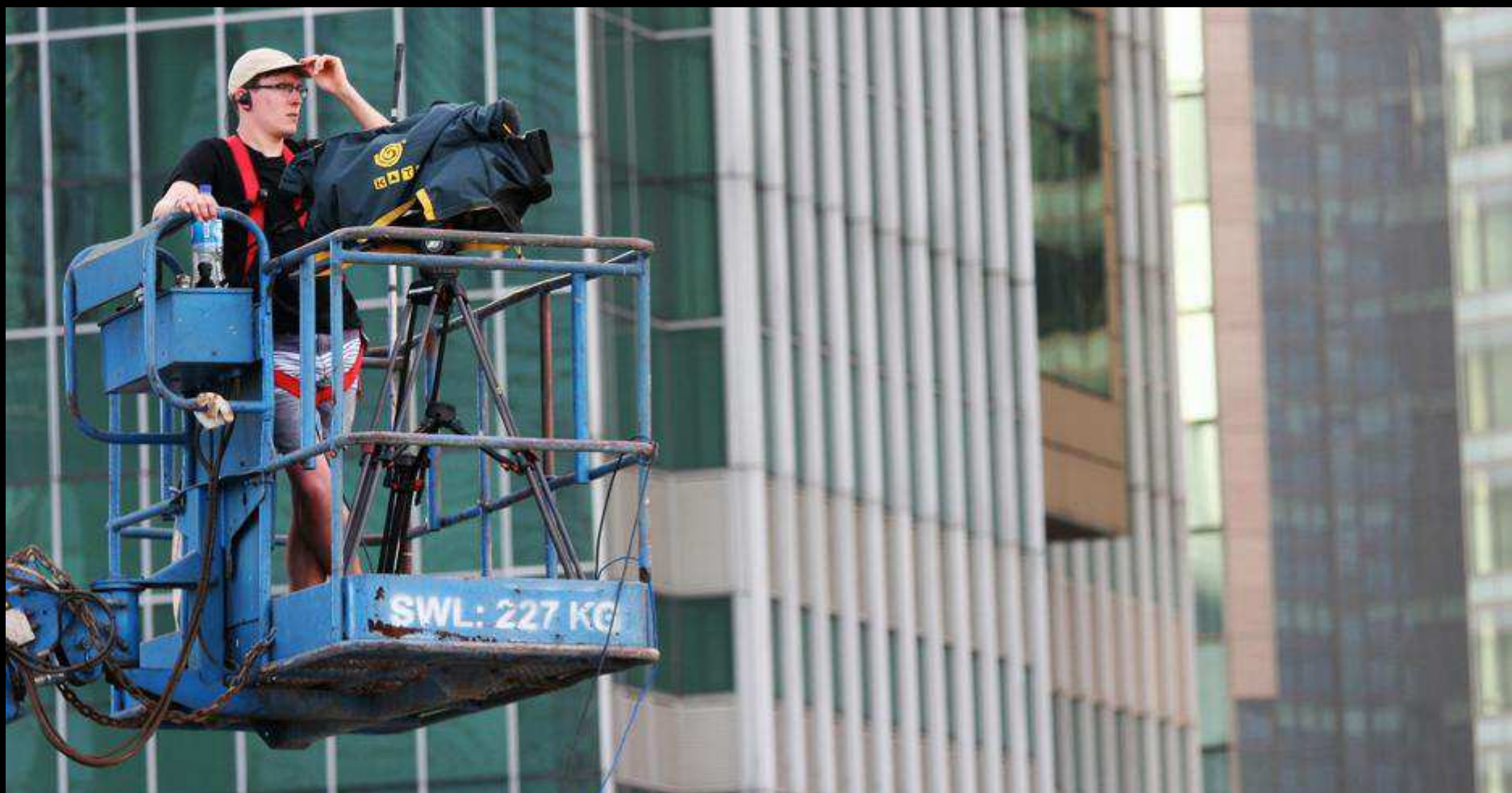
CRANE FOR AERIAL PERSPECTIVE OF TV COVERAGE