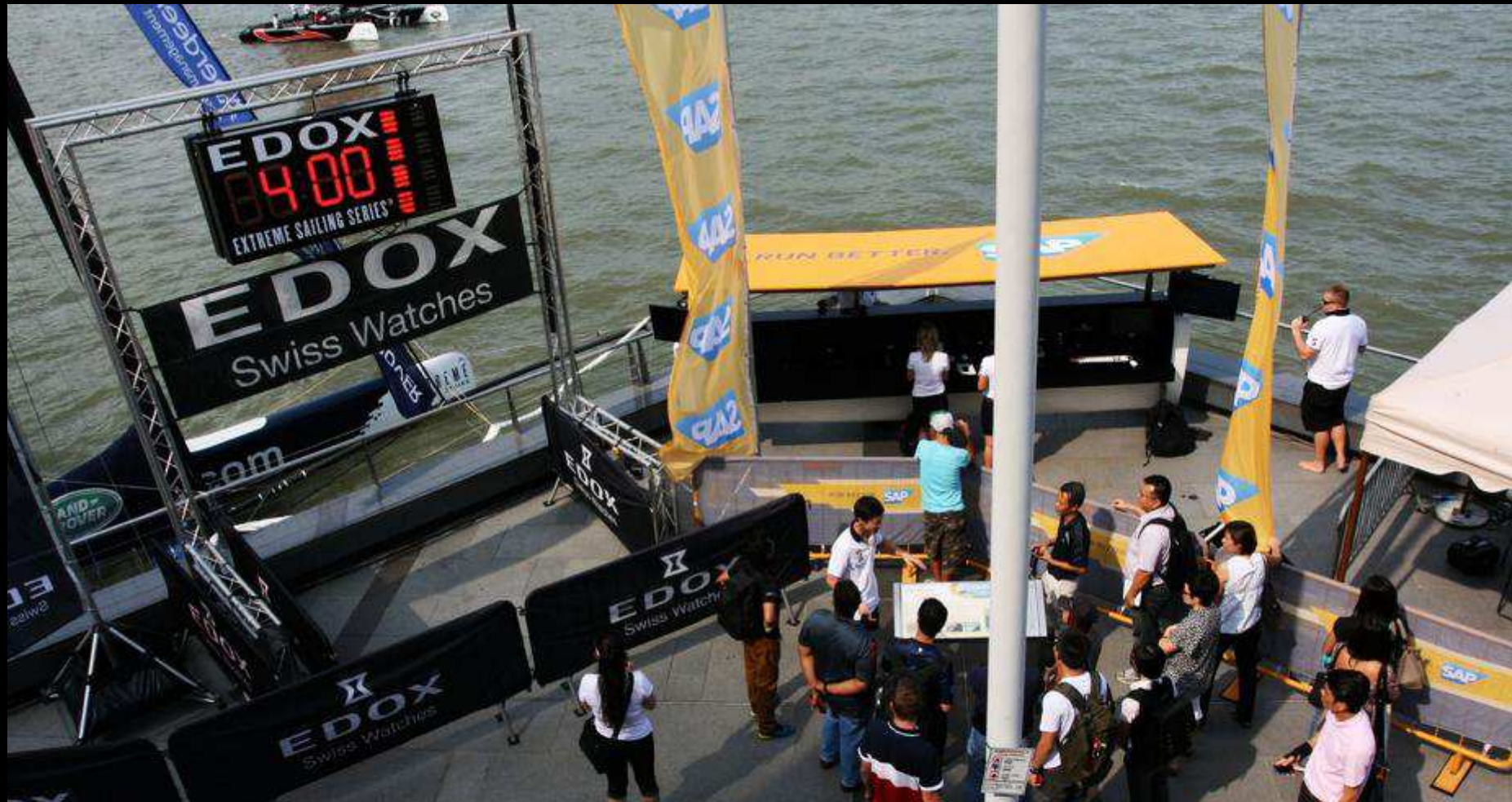
OFFICIAL TIMEKEEPER COUNTDOWN CLOCK (EDOX) & SAP COMMENTARY STATION