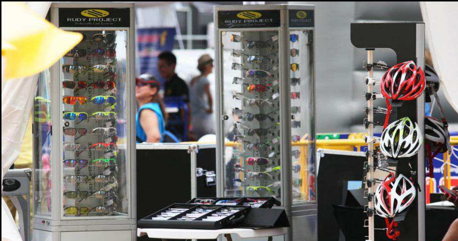
RUDY PROJECT SHOWROOM AND RETAIL ON THE RACE VILLAGE