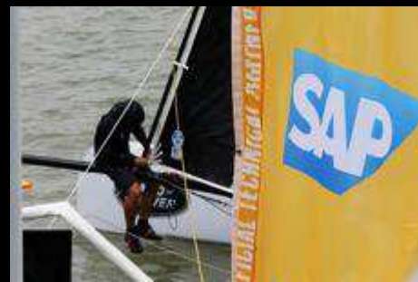
COMMENTATORS AT THE SAP STATION