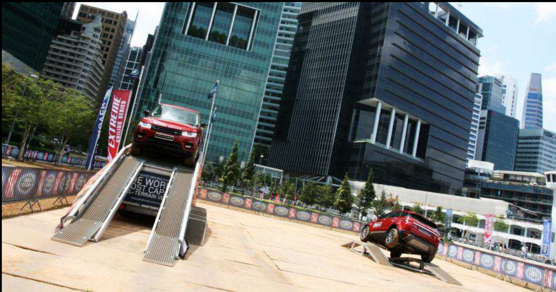
LAND ROVER DRIVING EXPERIENCE IN THE RACE VILLAGE