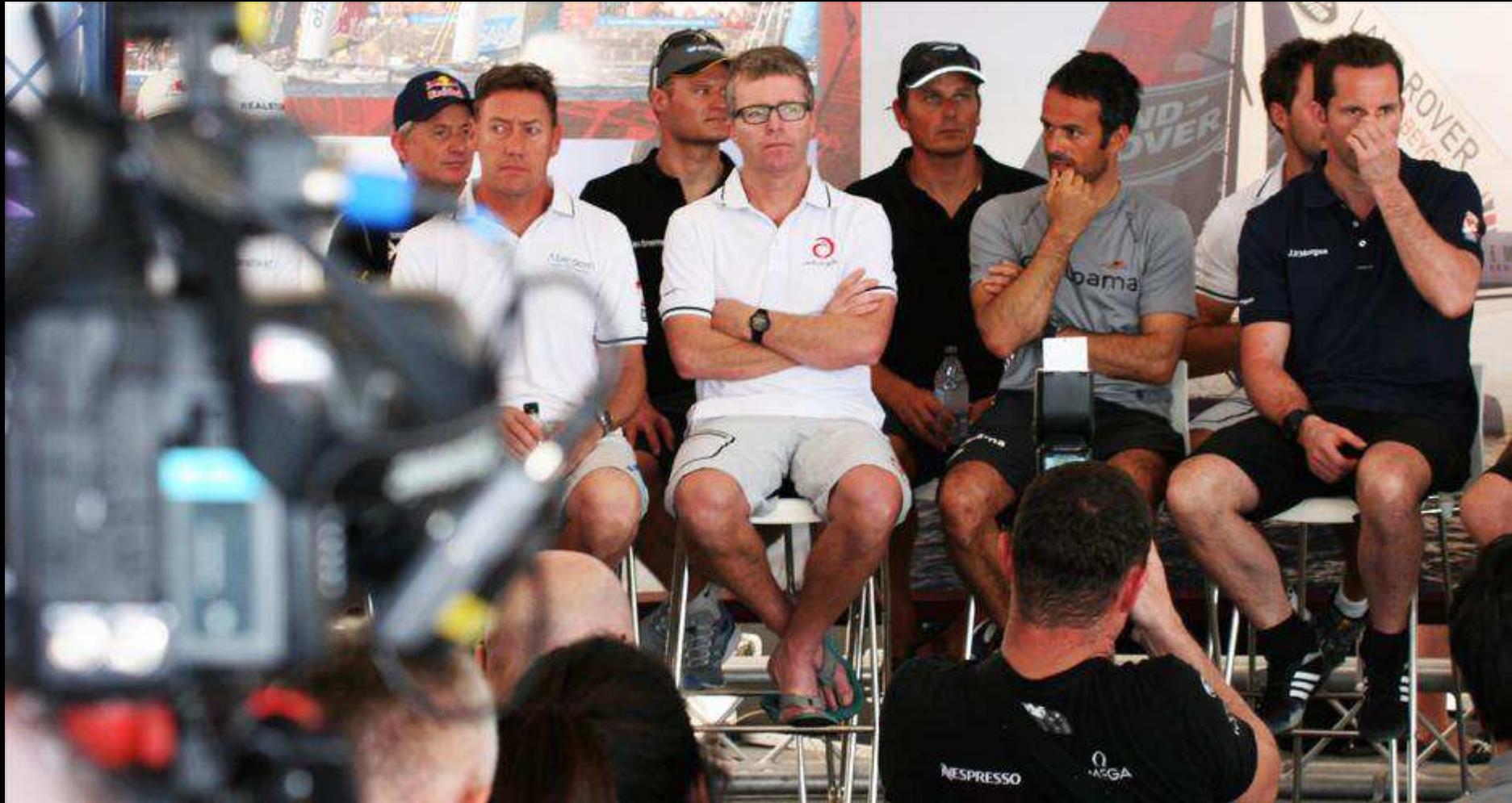
BEST TEAMS AND SKIPPERS LINE UP IN THE HISTORY OF THE SERIES