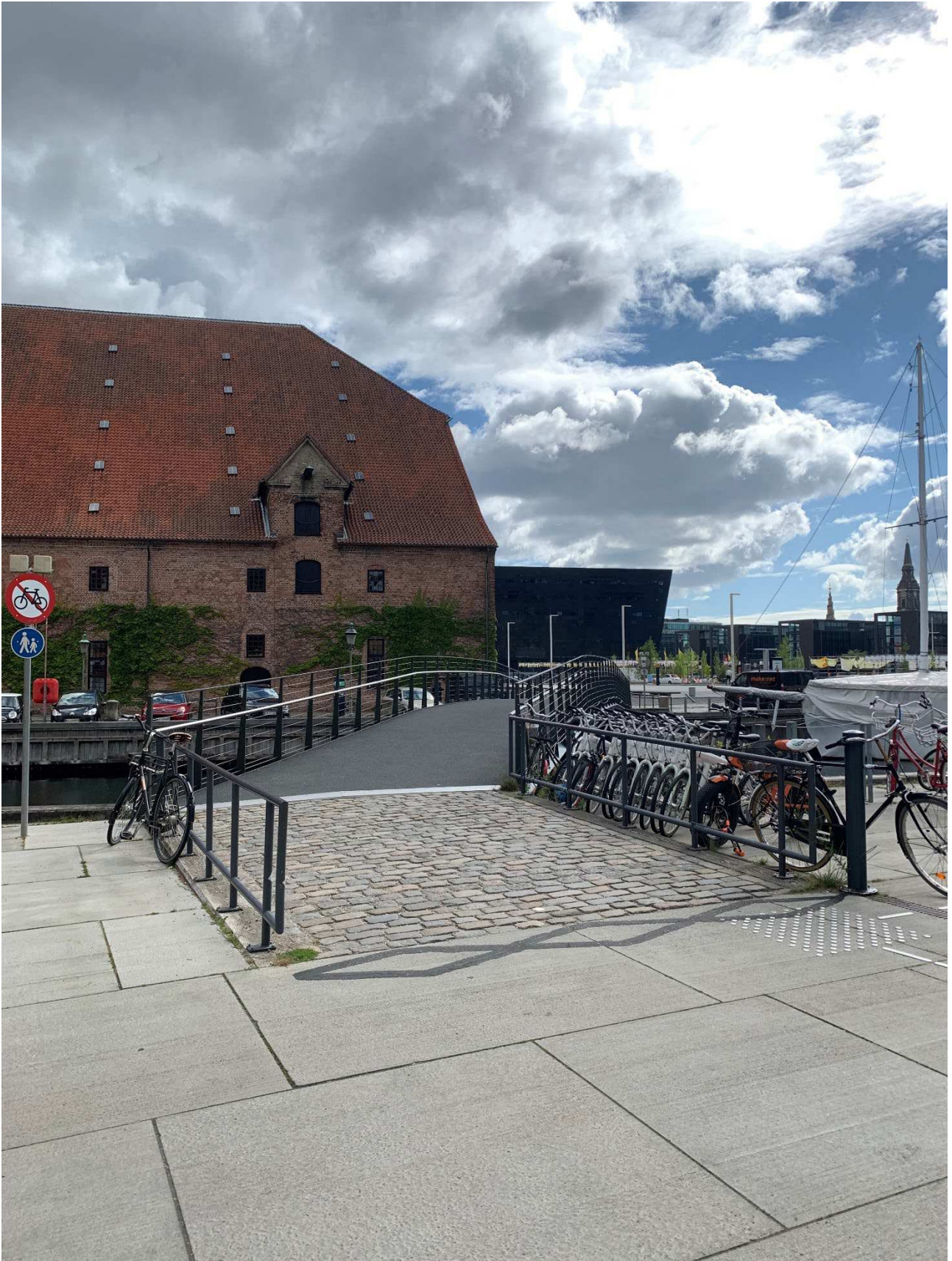
Foto af midlertidig gangbro set fra Bryghuspladsen, den 5. juli 2022.