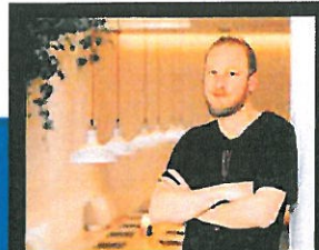
Tid til enkel og rå mad midt på torvet 11

På tur. Mange børn er sjældent på tur 14 Cityringen. Se metrobyggeriet fra oven 16