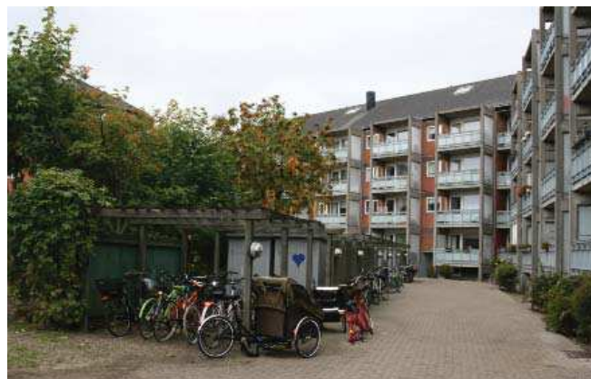
Bebyggelsens gårdrum i dag.