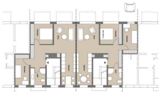
Eksempler på nye boligtyper i sammenlagte lejligheder