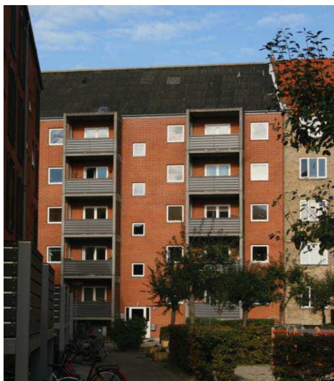
Bebyggelsen set fra gårdsiden