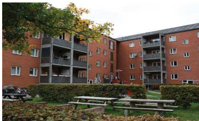
Bebyggelsen set fra gårdsiden.