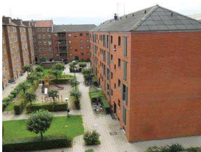
Bebyggelsen set fra gårdsiden