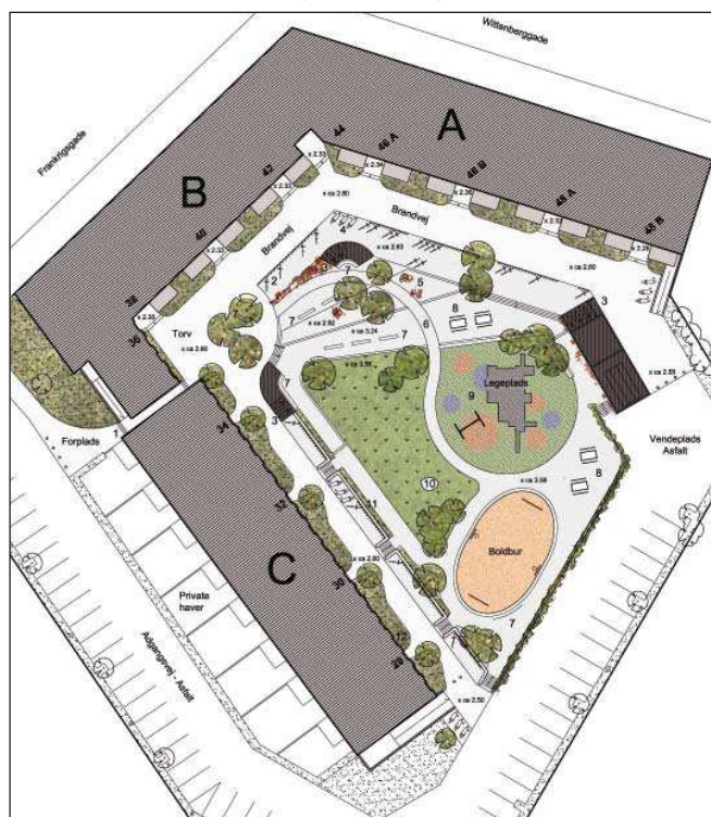
Planskitse af den nye indretning i gården.