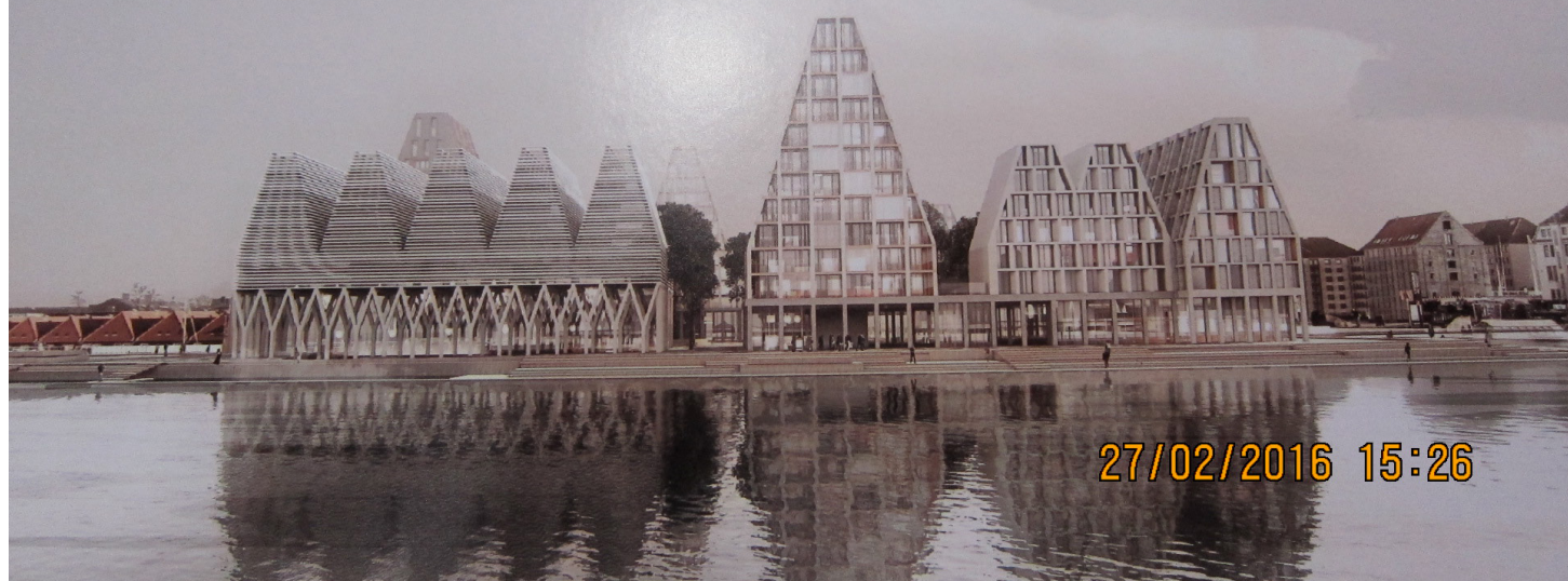
For høj bygning mod Kuglegården (Dårligt eksempel)