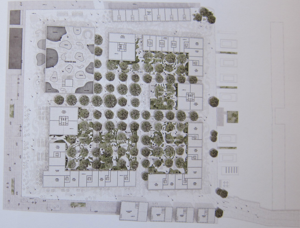
BEBYGGELSESPAN 1. SAL - 1:1500