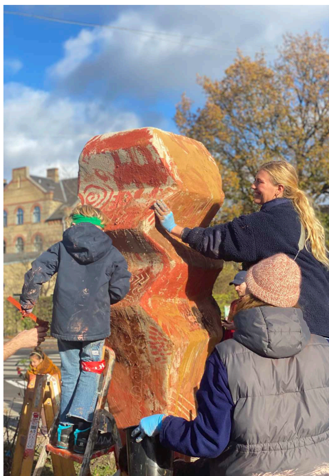
Procesbillede fra SOIL skulptur ved Filipsparken, hvor beboere udsmykkede skulpturen med kalkpigmenter som i et moderne hulemaleri.

Derudover var styregruppen positive for projektets borgerinddragende fokus. Da skulpturerne blev opsat var beboere fra Italiensvej kvarteret fx med til at flette ålegræs ind i den ene skulptur. Ved Filipsparken var beboere med til at male med kalkpigmenter som i et moderne hulemaleri. I Englandsparken kreerede børn og voksne kikkerter som de graverede med motiver fra parken. Dette stemmer godt overens med Områdefornyelsens hovedformål; at borgerne selv sætter deres præg på byen - også på byens kunst.