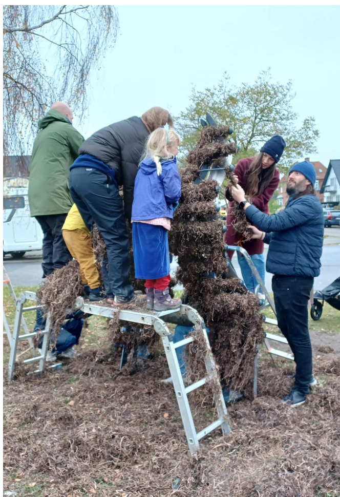
Procesbillede fra SEA skulptur ved Italiensvej og Amager Strand, hvor beboere brugte den traditionelle tæppe-metode til at beklæde skulpturen med ålegræs.