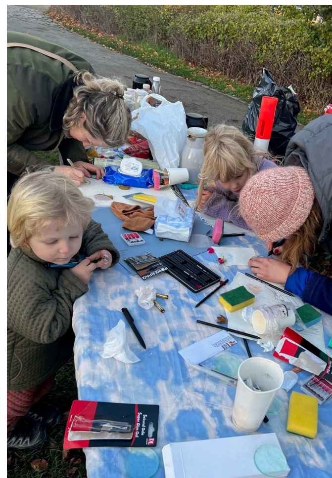
Procesbillede fra SKY skulptur ved Englandsparken, hvor beboere lavede kikkerter, hvor linserne blev graveret med motiver fra parken. Kikkerterne blev efterfølgende sat ind i skulpturen.