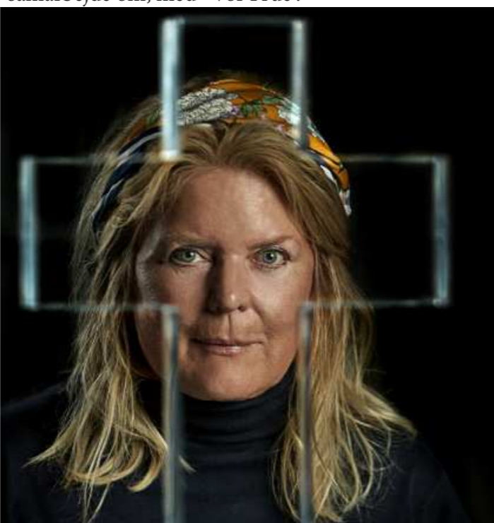
At se gennem korsets tegn. Acrylmodel i 1:5-