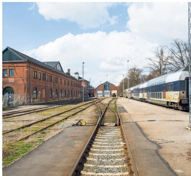
En lille, rolig lomme i København - Otto Busses Vej på jernbaneterrænet mellem Ingerslevsgade og Vasbygade. Fra bogen »Stille København« af Peter Olesen.