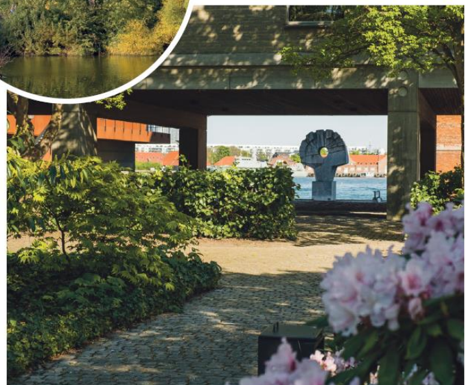
Heerup Haven bag Energistyrelsen på hjørnet af Amaliegade og Toldbodgade? Fra »Stille København« af Peter Olesen.

side af kommunegrænsen, i København, er der ro at finde. Her er stederne ikke kategoriserede som stilleområder, men ifølge journalist og forfatter Peter Olesens seneste guidebog, »Stille København«, er der rig mulighed for også at stikke af fra larm og støj i København.