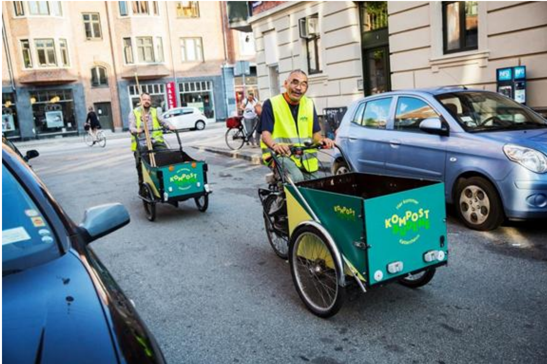
Kompostbudene på Amager