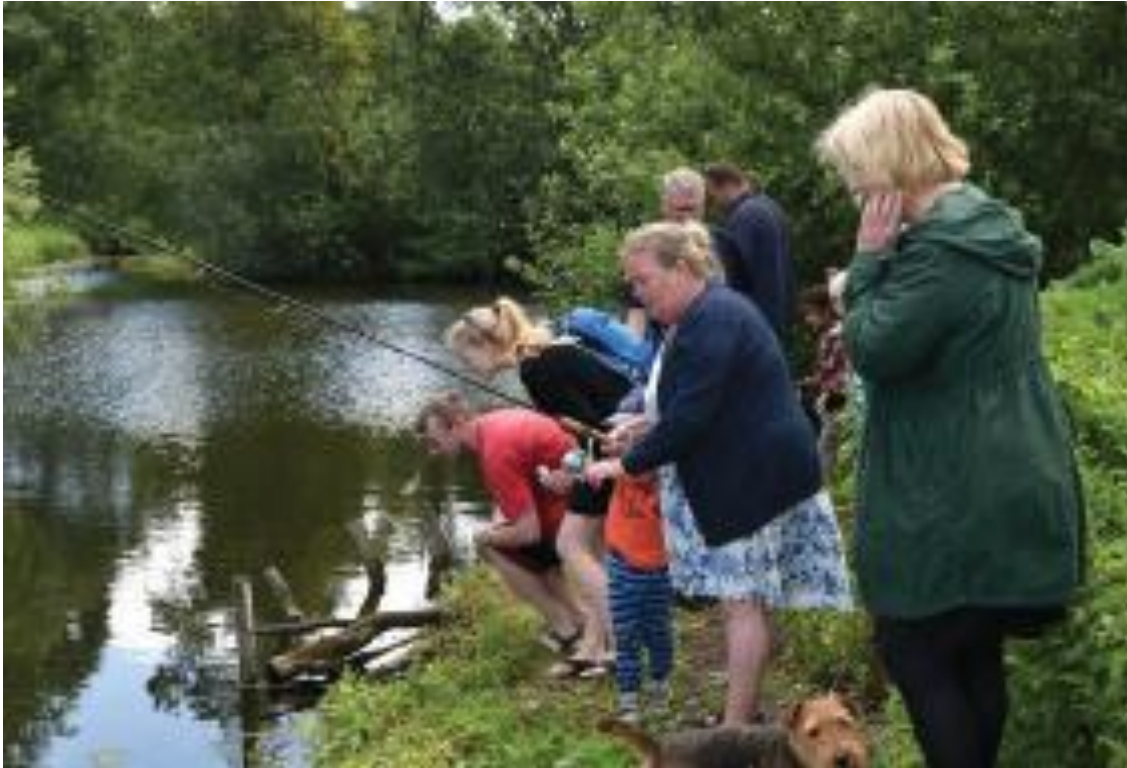
Mosetræf i Utterslev Mose