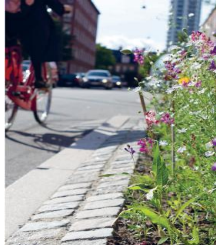
Blomstrende By på Vesterbro