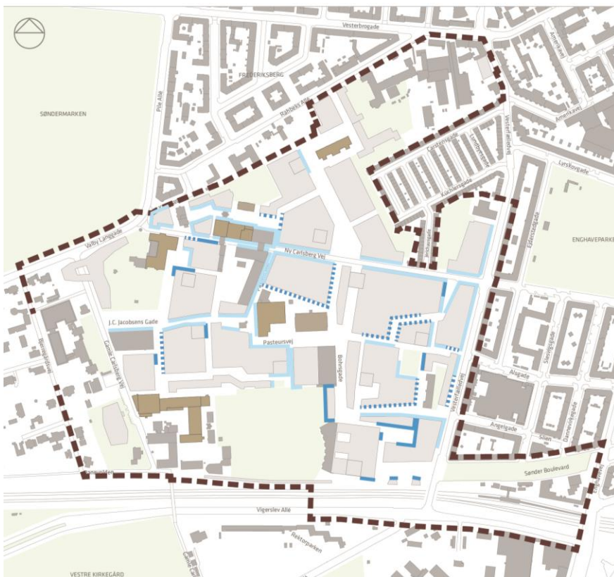
Illustration: BLÅ FACADER

Store dele af de åbne facader forbliver uændrede (sart blå linjer).