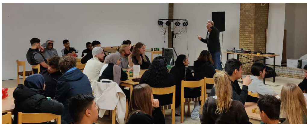
Ungeinddragelses-aften om Ungeværket

Vi er bevidste om at ungelivet ikke er lineært og ofte skiftes der retning gennem påvirkning fra de sociale arenaer de unge befinder sig i. Derfor har vi, som pædagoger, et ansvar for at være omskiftelige, og nysgerrige, og sikre at vores projekter og indsatser bedst muligt følger de unges udvikling. Dette gøres ved at inddrage dem i alle dele af projektets/indsatsens levetid.