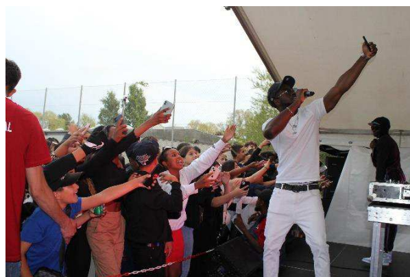
Fritidsfestivalen, en indsats i klubbydelsplanen 20-21