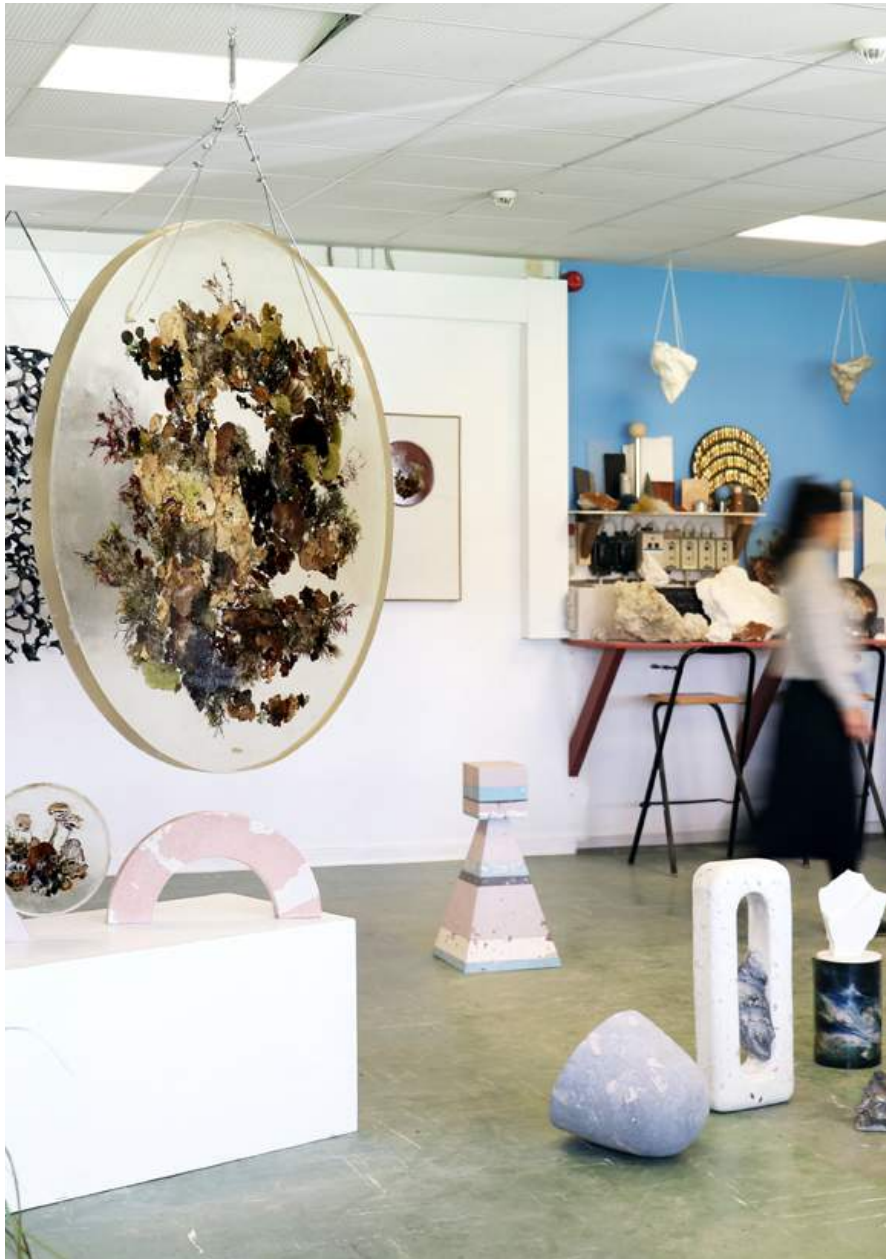
Atelier, Studio ThinkingHand