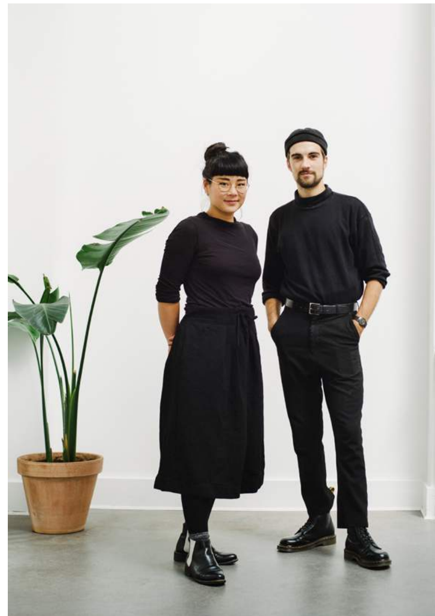
Portræt af Studio ThinkingHand