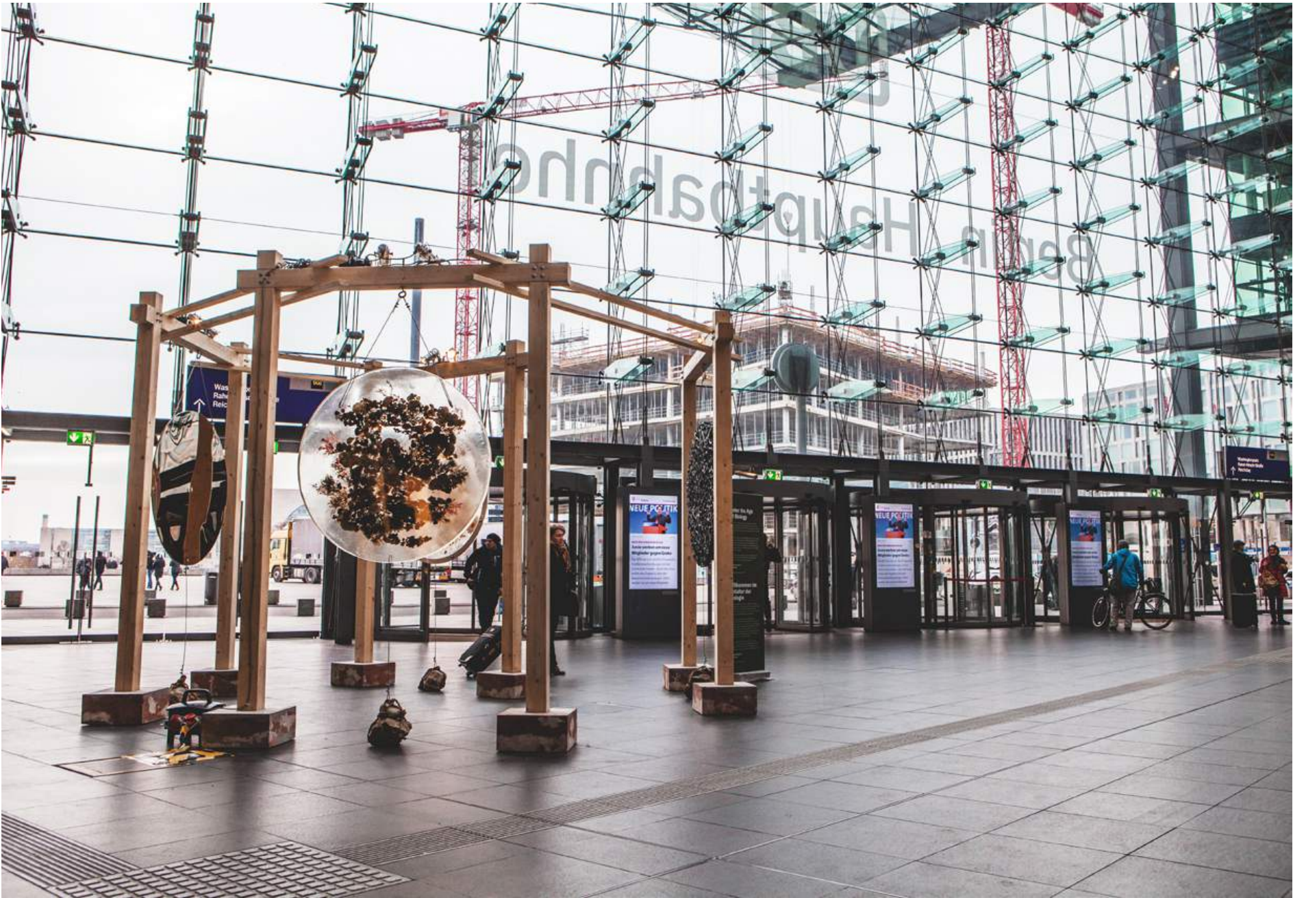
Relationscape, Age of Biology, Berlin Hauptbahnhof, 2018, Studio ThinkingHand