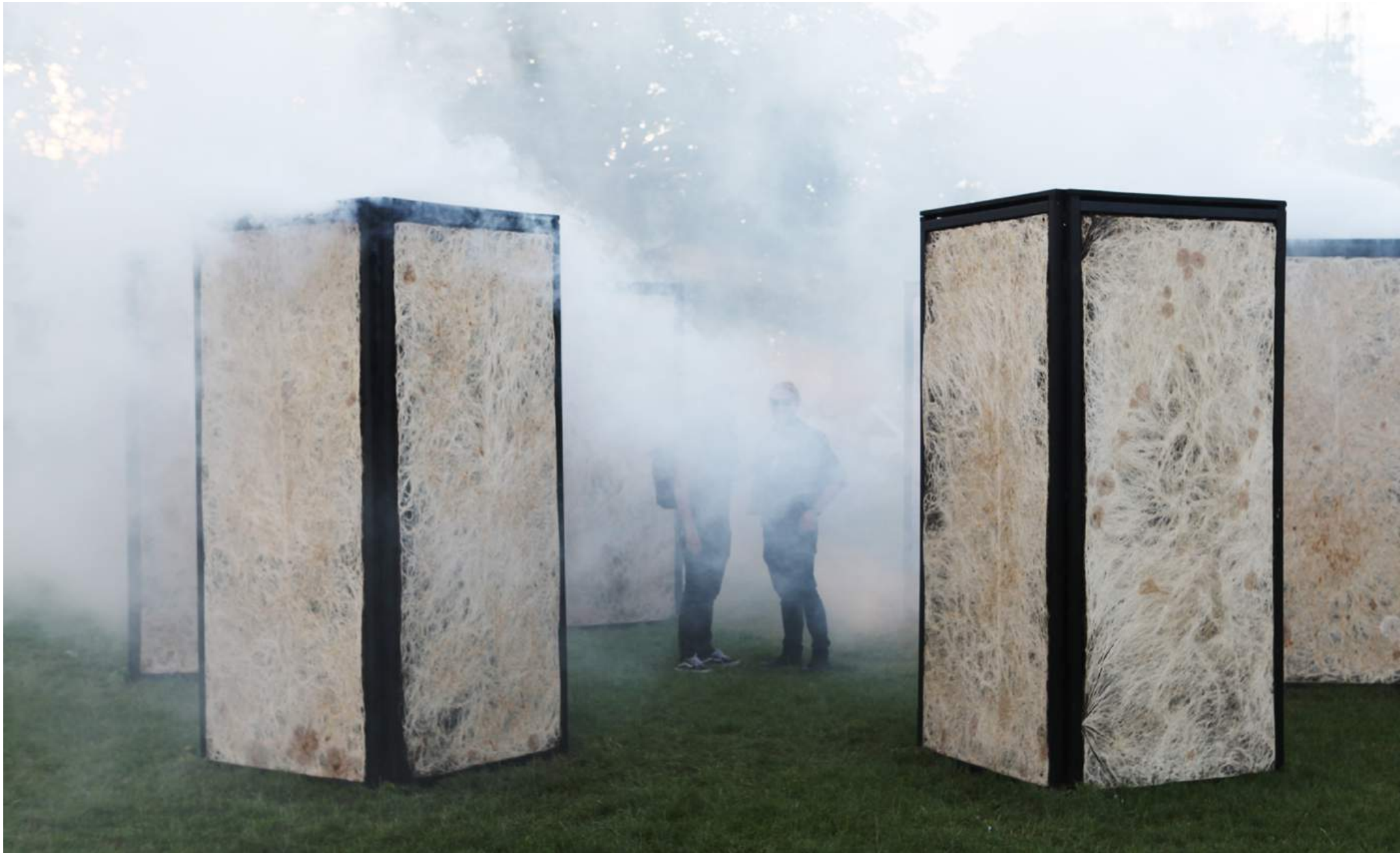
Network, Roskilde Festival, 2017, Studio ThinkingHand