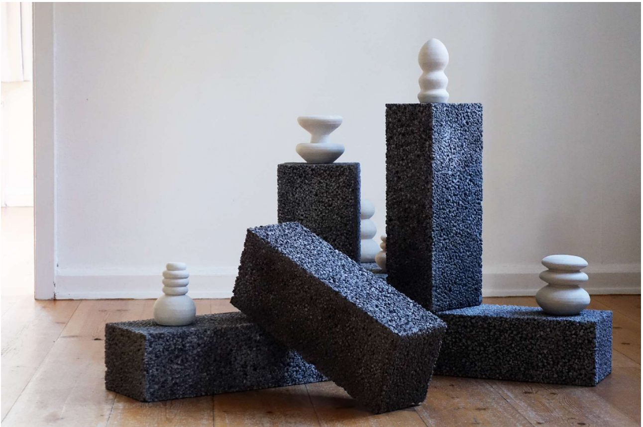
Installations view af værket Retail Serrated Knives på udstillingen The Endless Summer , Huset, Aalborg