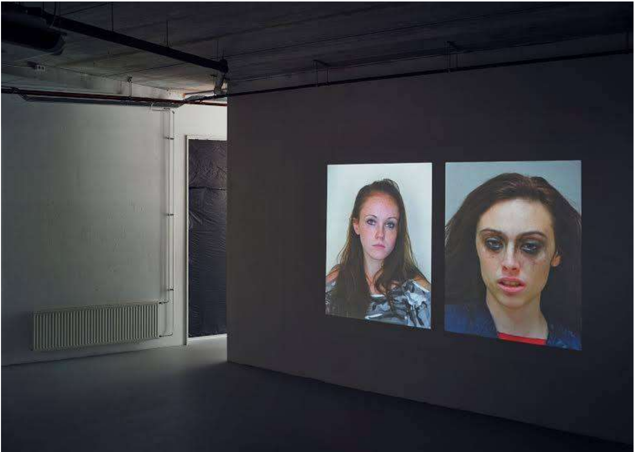
Installations view af værket Portraits 2008-2016 på udstillingen Festival of Choices, TAAK / De Punk, Amsterdam, Holland