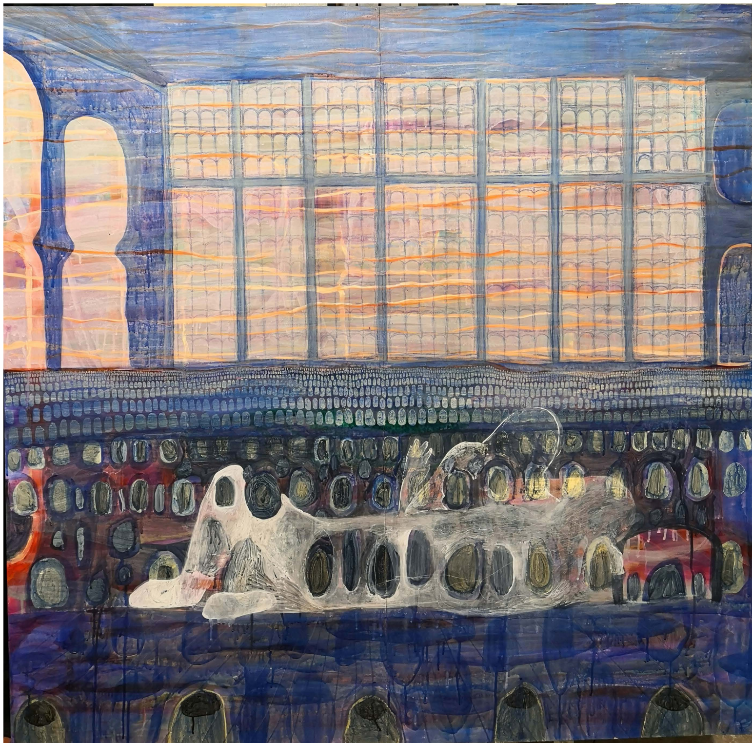
Maleri under udarbejdelse til kommende soloudstilling 'Paradis', Sydhavn Station 145cm x 155