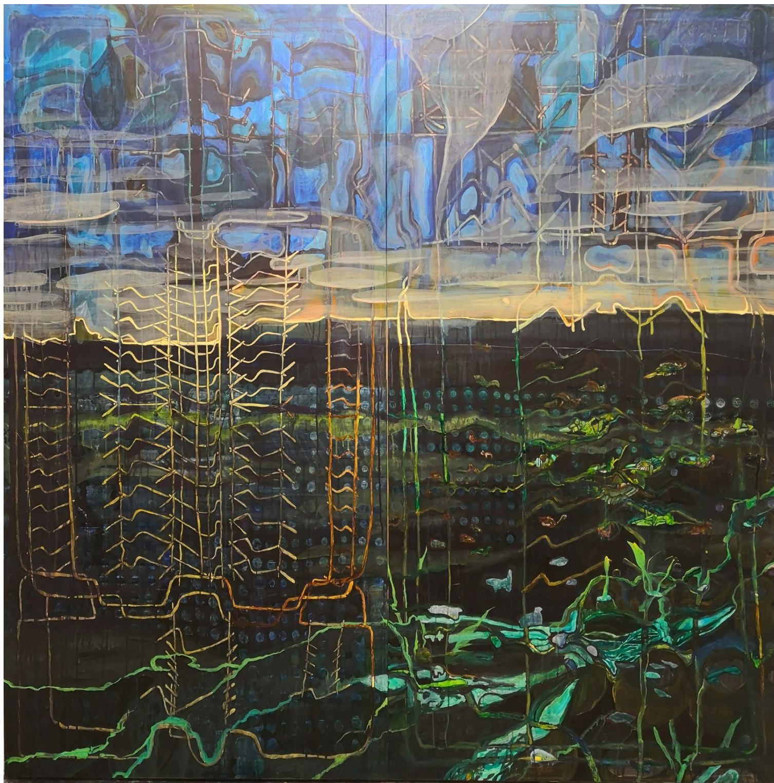
Maleri under udarbejdelse til kommende soloudstilling 'Paradis', Sydhavn Station 2m x 2m