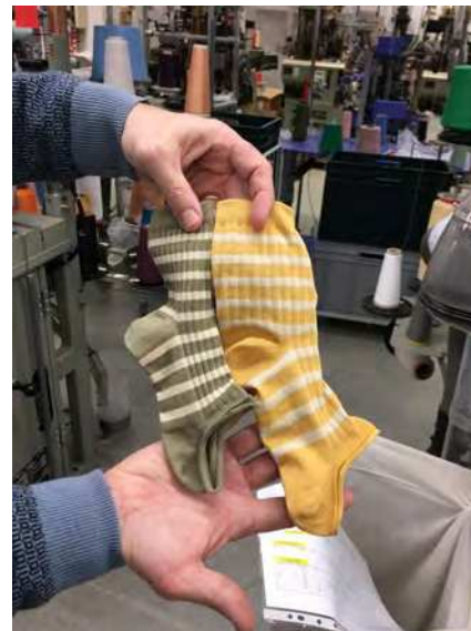
Overskudsmateriale fra MP strømper

Udstillingens værker tager udgangspunkt i overskudsmateriale fra det danske firma MP Strømper, som årligt har et samlet spild på cirka 10 ton.