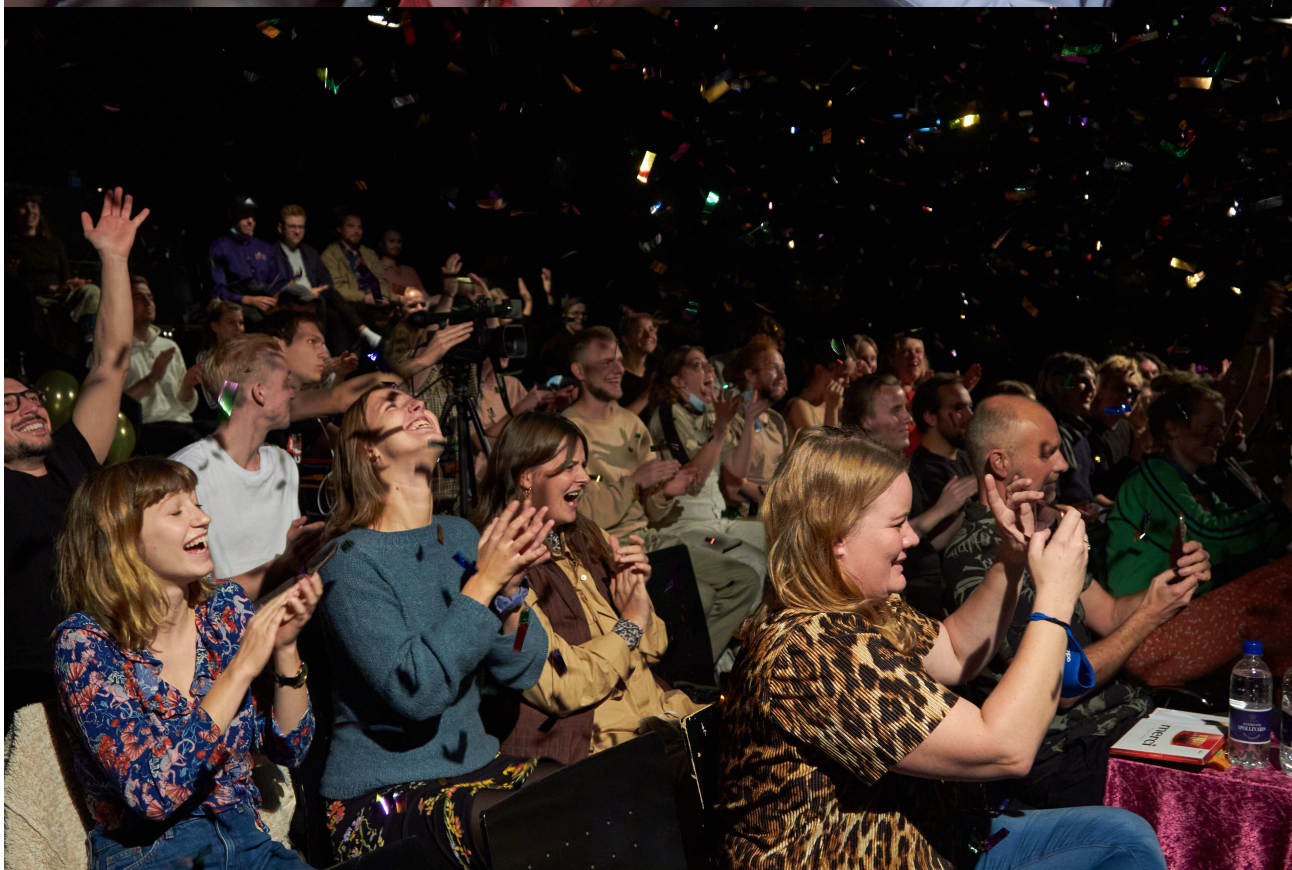
Finale til TeaterBattle 2020: glade deltagere og jury bestående af fire teaterledere fra Københavns professionelle teatre