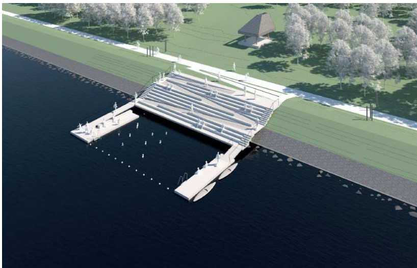
Eksempel på oplæg til nyt Blå Støttepunkt ved Kalveboderne.

Ungdommens Ø, på Middelgrundstortet, er også ved at udvikle sig til et stort nyt blå støttepunkt med mange nye aktiviteter.