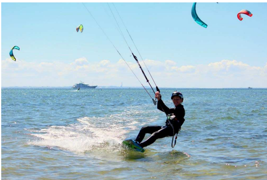
Kitesurfing (foto: Lynæs Surf Center).

Der er generelt en stor og stigende interesse for vinterbadning. Der er planer om udvidelse af Islands Brygge Havnebad og de 2 nye dypezoner fra 2020 er også særligt velegnede til vinterbadning.