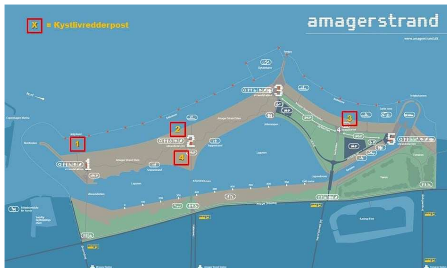
Figur 3. Kort over Amager Strandpark. Kan ses på: https://www.kk.dk/files/livredderkort-2018.jpg