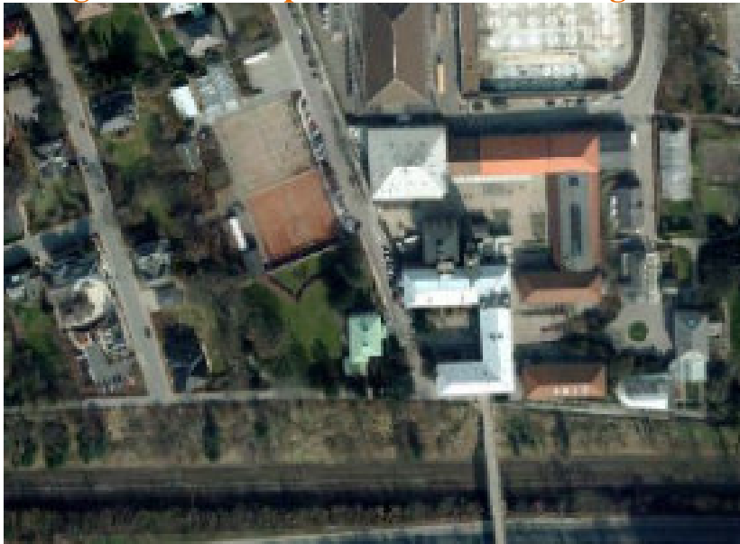
Luftfoto af lokalplanområdet med tennisbaner og Carlsberghus mod syd.