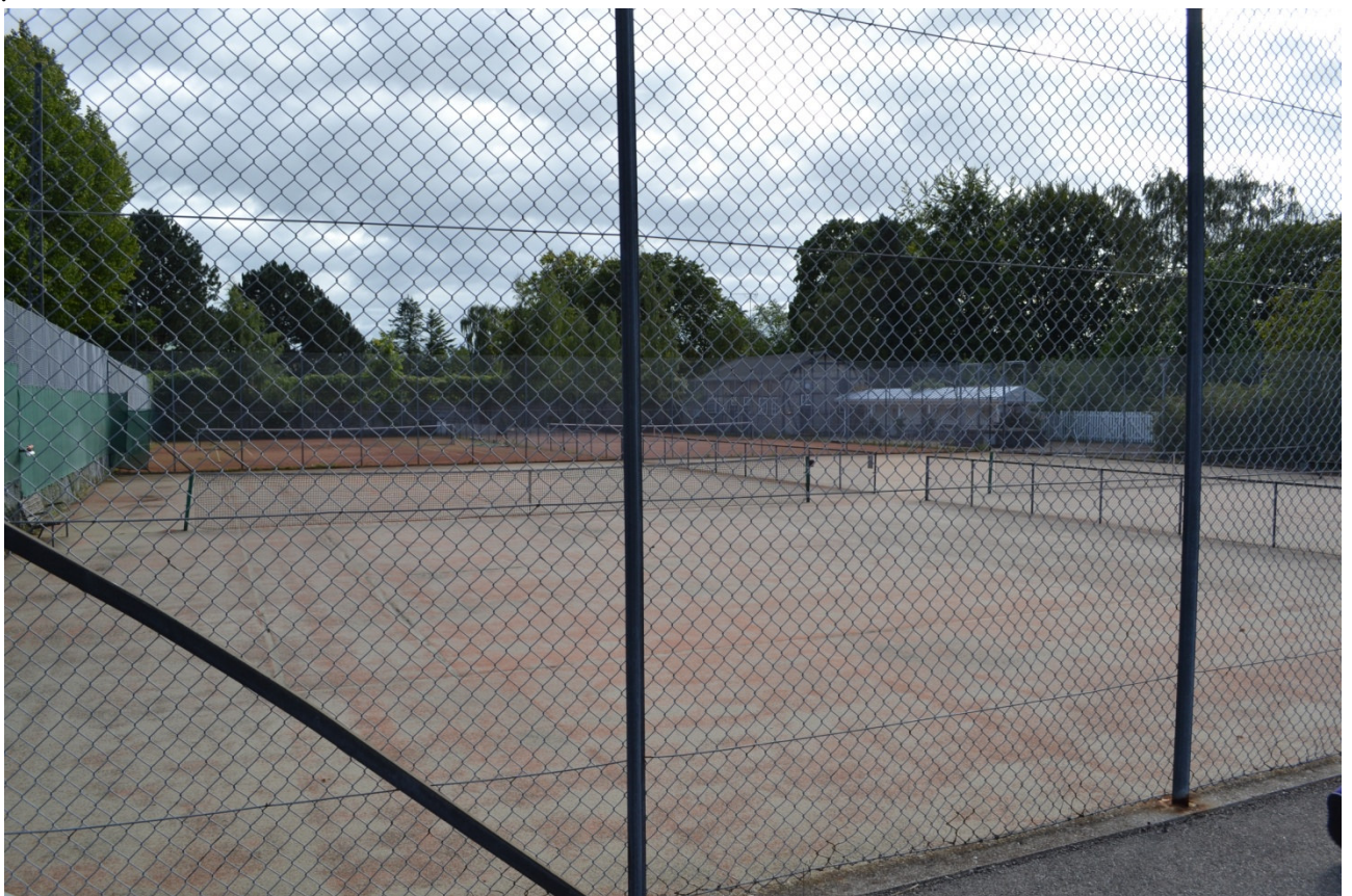
Tennisbanerne med klubhuset i baggrunden.

Tennisklubhuset forudsættes fjernet af hensyn til den bebyggelsesplan, som lokalplantillæget fastlægger. Det bevaringsværdige tennisklubhus ønskes flyttes til Bjerregårdsvej 13 eller 15, som ejes af Edlund Ejendomme.