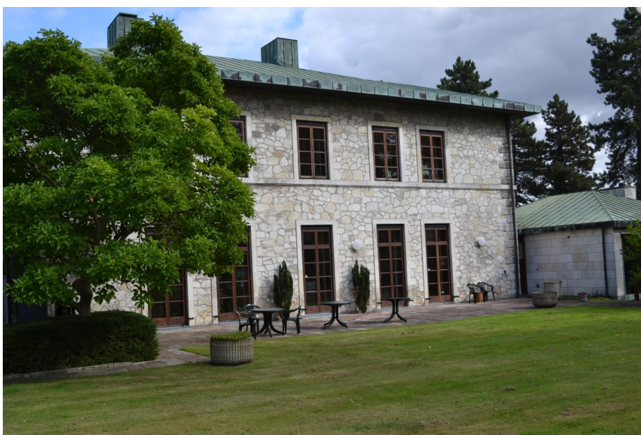
Carlsberghus (Faksehus) set fra haven. Ejendommen var tidligere direktørbolig for Gamle Carlsberg,

Bevaringsværdige bygninger på ejendommen: 8. Tennisklubhuset og 9. Carlsberghus (Faksehus). Bygninger på nord for lokalplanområdet: 5. Forskningscenter 6. Forskningslaboratorium. Bygninger på øst for lokalplanområdet: 1. Bryggerigården .