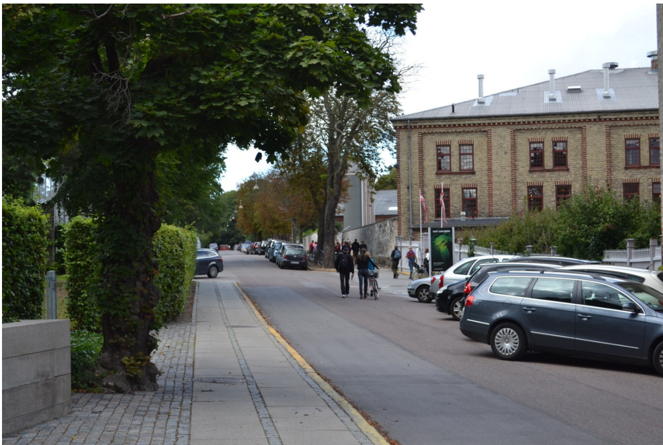
Ejendommen ligger mellem Gamle Carlsbergvej og villakvarteret mod Valby. Gamle Carlsbergvej set mod nord med ejendommen til venstre.

Med nærhed til den kommende Carlsberg Station skabes gode muligheder for at fremme byliv, bæredygtighed og økonomisk sammenhængskraft.