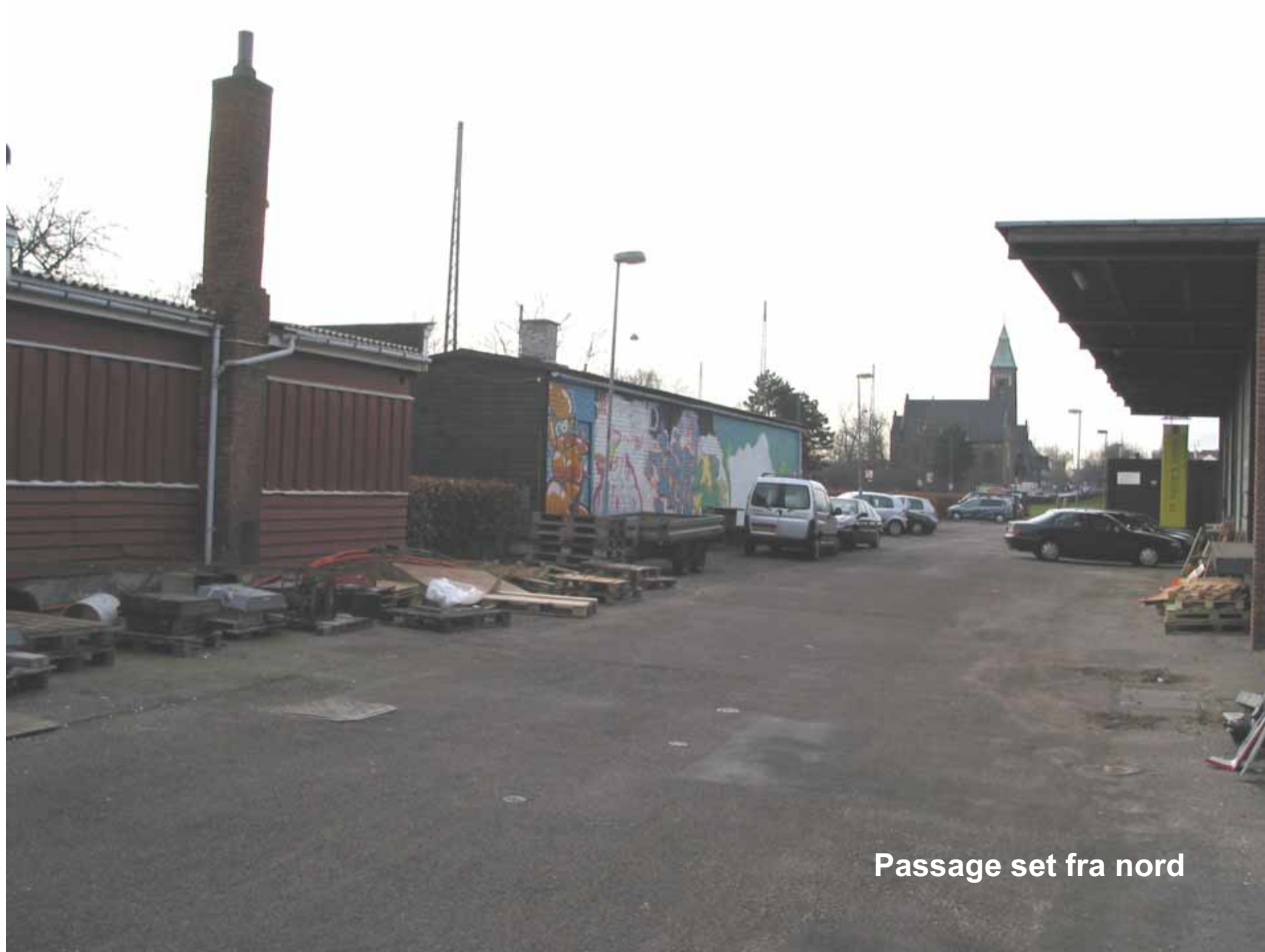
Passage set fra nord