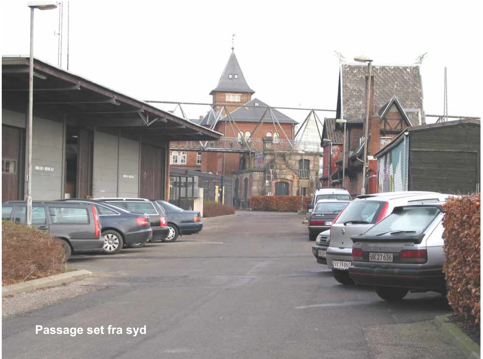
Passage set fra syd