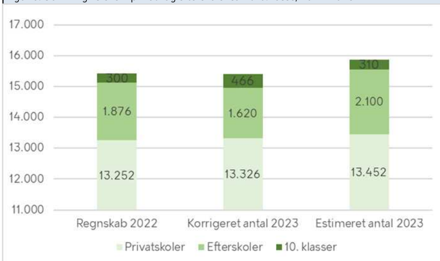
Figur 5: Udvikling i elever i privat- og efterskoler samt 10. kasse, 2022-2023