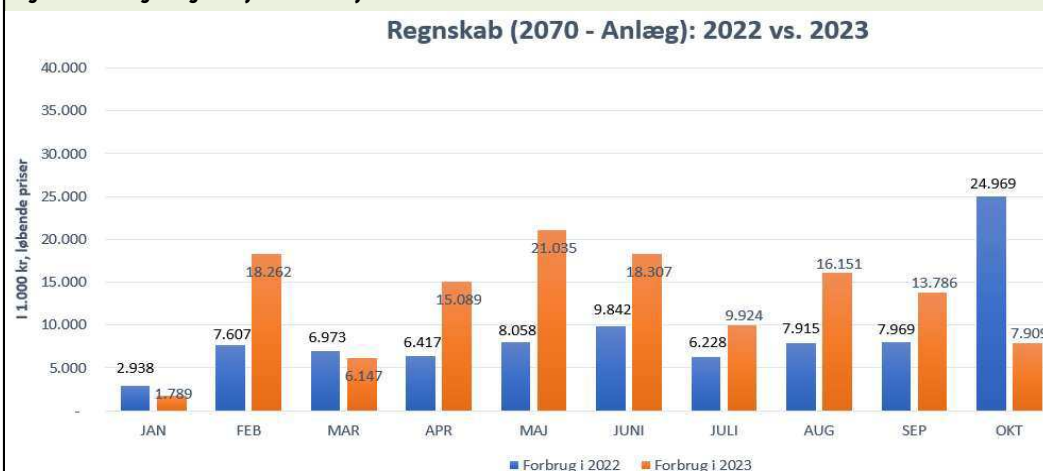
Figur 7: Anlægsudgifter januar - maj 2023 vs. 2022

Årsagen til den samlede stigning i forbrug på anlæg sammenholdt med samme periode er, at forvaltningen har en række store anlægsprojekter, hvor størstedelen af eksekveringen udføres i 2023. Et eksempel på et konkret anlægsprojekt er Udsatte Boligområder I, hvor forvaltningen alene på om- og udbygningen af Lundtoftegade 43 forventer at bruge 17,1 mio. kr. i 2023. Et andet eksempel er den store udskiftning af undervisningskærme og IT på Københavns Folkeskoler