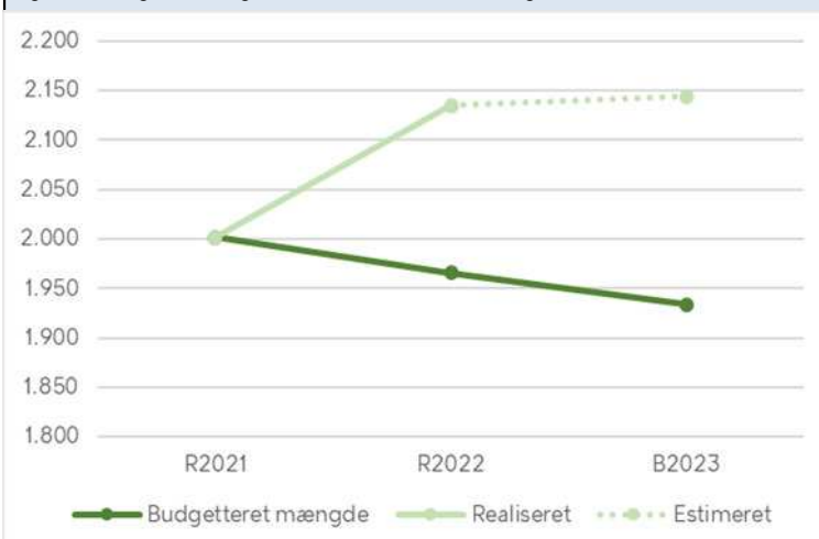
Figur 3: Budgetteret og realiseret/estimeret mængde 2021-2023 – Private institutioner

Det samme gør sig gældende i figur 3, som viser udviklingen for de private institutioner. Forvaltningens estimerede antal børn vedrørende de private institutioner er på niveau med Regnskab 2022, men det budgetterede antal børn er faldet pga. faldende demografitildeling.