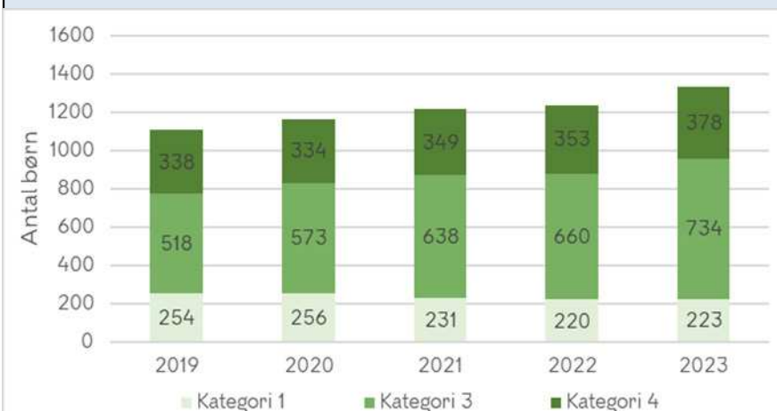
Figur 4: Udvikling på specialfritid i fordeling af børn i kategori 1-4, 2019-2023

Udviklingen er illustreret i figur 4, hvor det ses, at der er sket en stigning i antallet af kategori 3 børn fra 518 i 2019 til estimeret 734 børn i 2023.