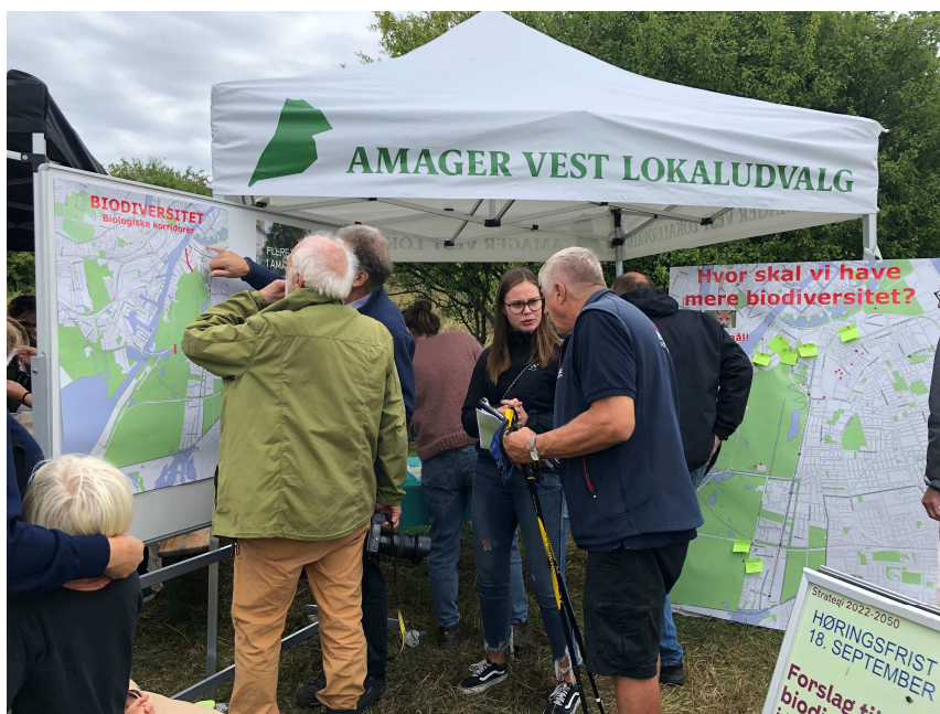
Fra Fælledens Dag 11.9.22

Her på den korte bane deltog lokaludvalget i orienteringsmødet d.1. september og borgermødet d.13.september 2022.