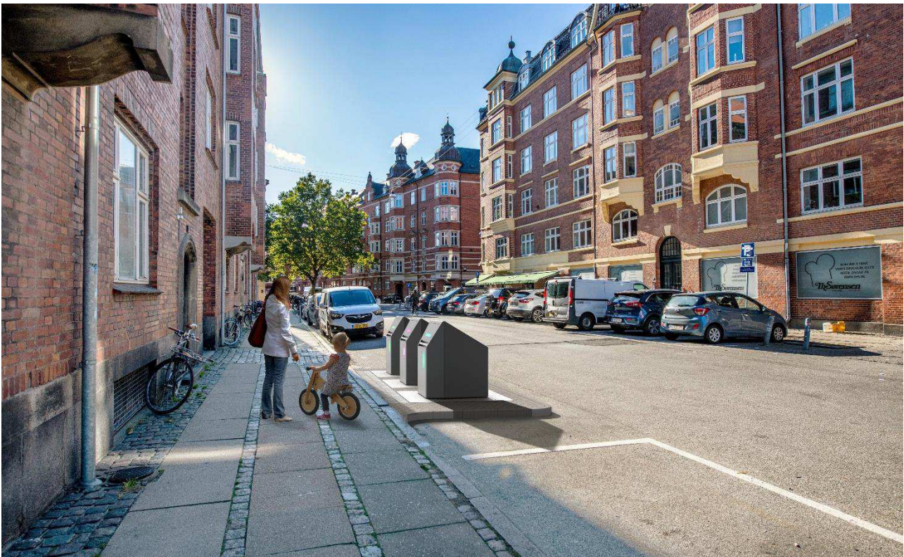
Eksempel på sorteringspunkt med tre nedgravede beholdere. Placering samt udformning af affaldsløsninger og anlæg er ikke nøjagtig gengivelse af hvordan et sorteringspunkt kommer til at fremstå.

Særligt i Indre By, men også på Christianshavn, er der pres på byrummet grundet en høj koncentration af butikker, natklub- café- og restaurationsmiljøer, markante kulturinstitutioner og utallige turistattraktioner. Bydelen tiltrækker og bruges af både lokale og turister hele døgnet og hele året.