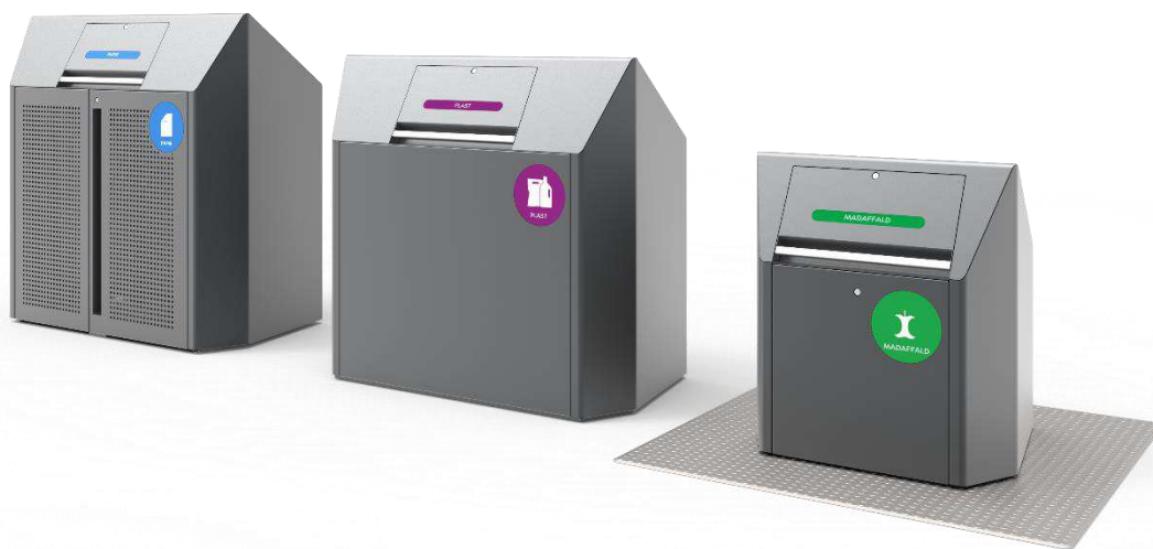
Illustrationen viser de tre typer beholdere, som et sorteringspunkt kan bestå af: (fra venstre) skjul, kuber eller nedgravede beholdere.

I forbindelse med forberedelse af anlægsarbejdet skal sorteringspunkterne projekteres. Projekteringen kan afdække eksempelvis anlægs- eller driftstekniske forhold som medfører, at forvaltningen kan være nødt til at justere et sorteringspunkt, sløjfe et sorteringspunkt eller ændre på hvilke parkeringspladser, der skal nedlægges. Som led i myndighedsbehandlingen af sorteringspunkterne skal der udføres parts- og nabohøringer samt eventuelt dispenseres for bestemmelser i lokalplaner i forbindelse med nogle af sorteringspunkterne. I begge tilfælde kan det give anledning til at justere eller helt sløjfe et sorteringspunkt.