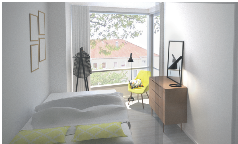
Eksisterende køkken i 1-værelses lejlighed udvides med karnap og omdannes til værelse, mens det eksisterende værelse omdannes til køkken-almrum