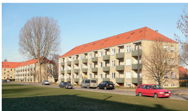
Typisk havefacadermed skrå altaner i murede nicher

Den gennemsnitlige husleje for almene boliger i kommunen er 947 kr. pr. m 2