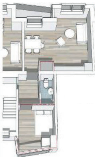
Plantegning af 1-værelsesbolig efter renoveringen