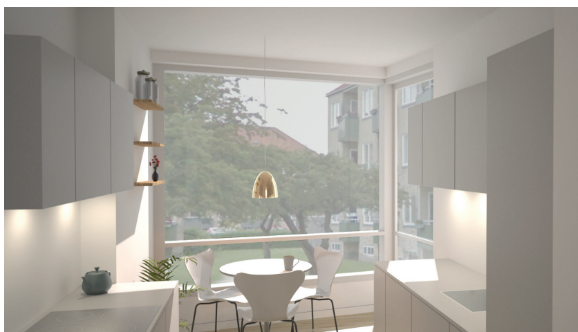
Eksempel på køkken der udvides med karnap og dermed spiseplads