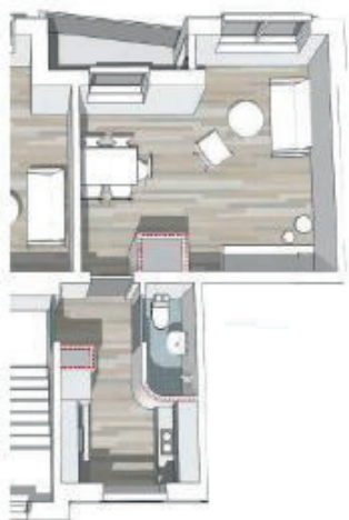
Plantegning af 1-værelsesbolig før renoveringen