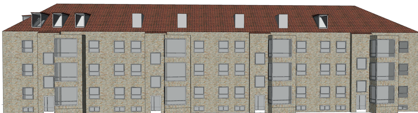
Eksempel på fremtidig ankomstfacade