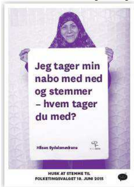
Illustration fra Demokratispejderne ved Folketingsvalget 2015