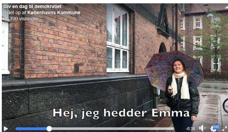
Valgfilm til rekruttering af tilforordnede ved kommunal- og regionalvalget 2017. Valgfilmen havde en rækkevidde på 143.000 personer.