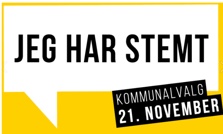
Vælgere kunne dele dette billede på Facebook, når de havde stemt. Kampagnen havde en rækkevidde på 69.830 personer.