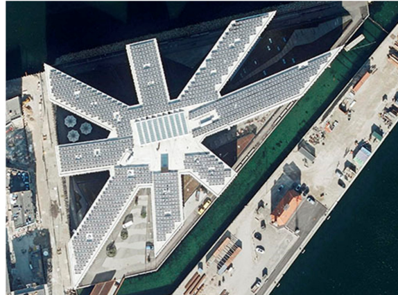
Etager: 6 Netto bebyggelsesprocent: ca. 316