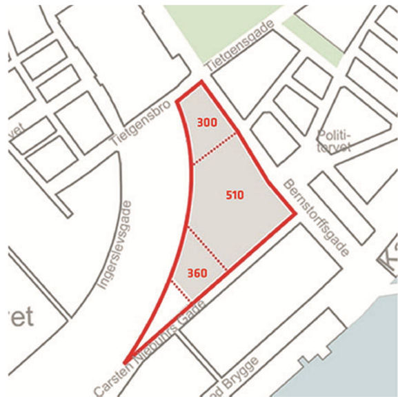
Netto bebyggelsesprocenter på postgrunden jf. startredegørelse