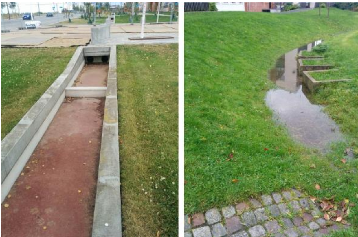
LAR-løsning i København 2015 sat over for Malmö-løsning fra 90'erne (Augustenborg). Der er lang vej endnu