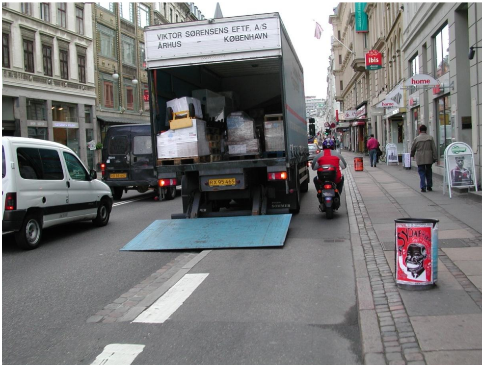
Vesterbrogade ved Gasværksvej