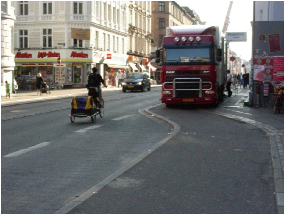
Vesterbrogade ved Kaalundgade