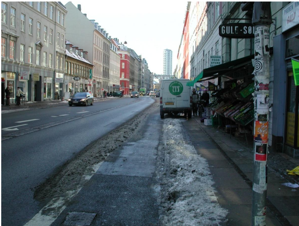
Vesterbrogade ved Kingegade