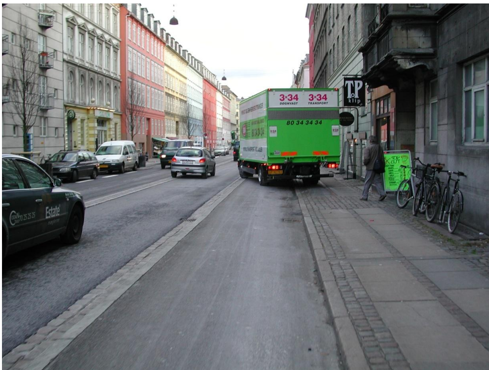
Vesterbrogade ved Amerikavej