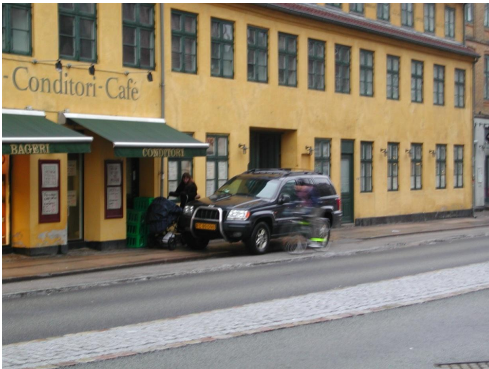
Vesterbrogade mellem Amerikavej og Platanvej