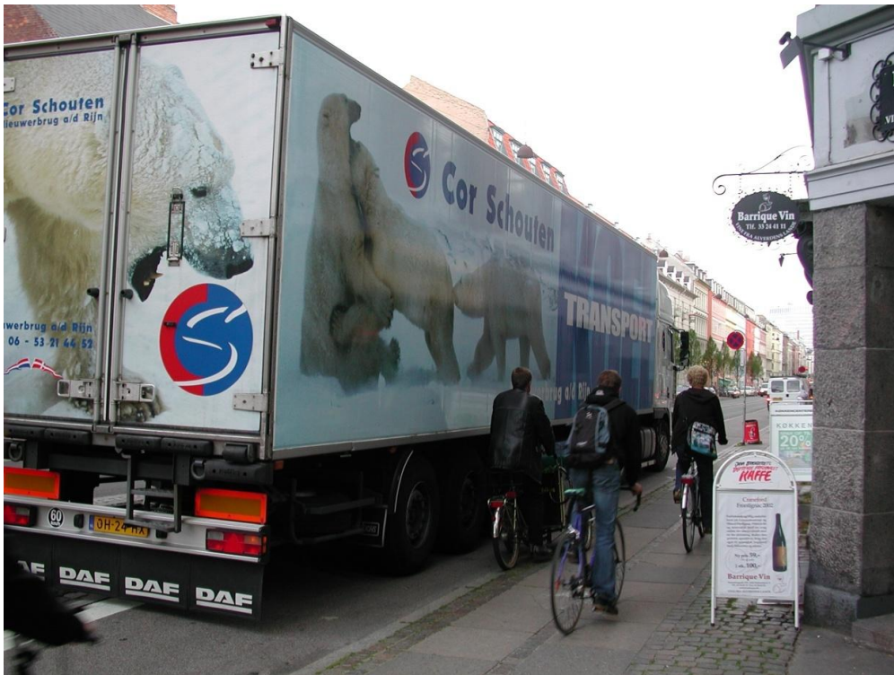
Vesterbrogade ved Amerikavej