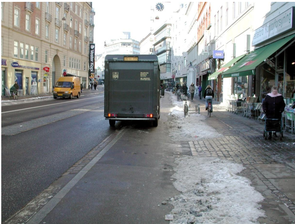
Vesterbrogade ved Dannebrogsgade