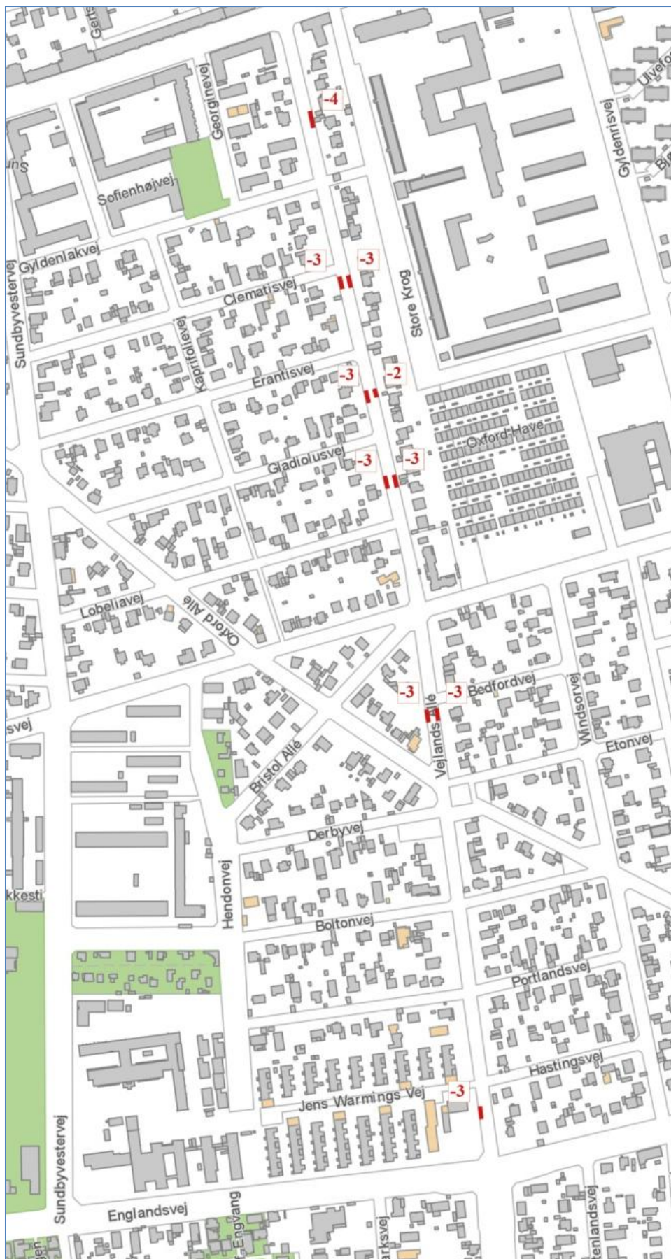
Kortet viser nedlæggelse af parkeringspladser på Vejlands Allé