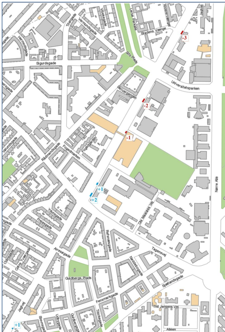
Kortet viser nedlæggelse (rød) og oprettelse (blå) af parkeringspladser på Jagtvej.

På Jagtvej nedlægges seks parkeringspladser, og der etableres fire parkeringspladser i forbindelse med projektet. Nedlæggelsen af parkeringspladserne finder sted i blå betalingszone i beboerlicenzonen FP (Fælledparken)