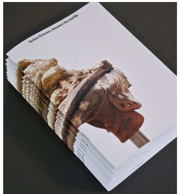
Torben Ebbesen, publikation