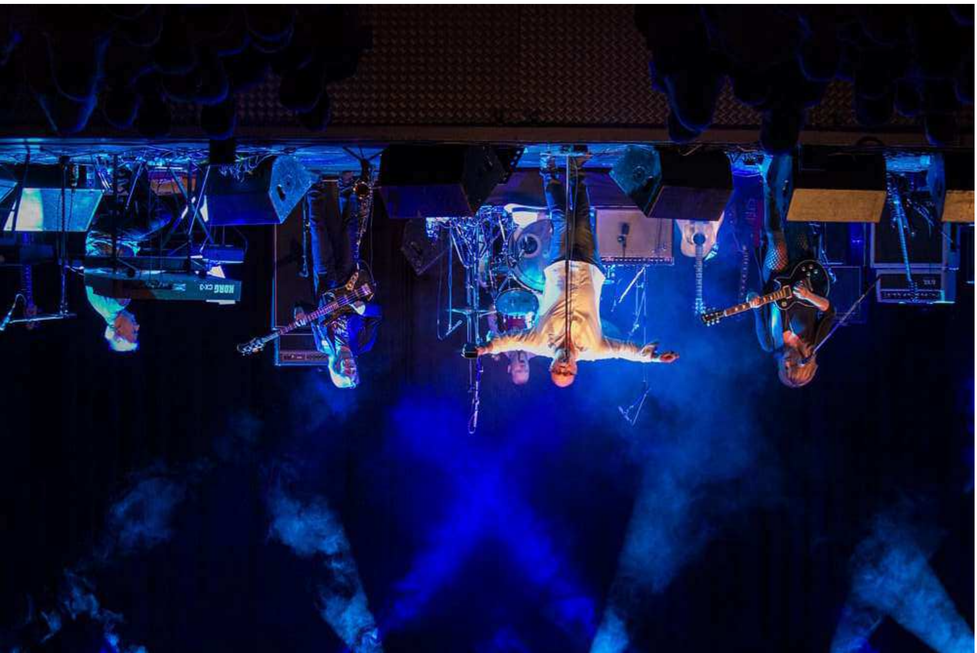
Fra Frede Norbrink