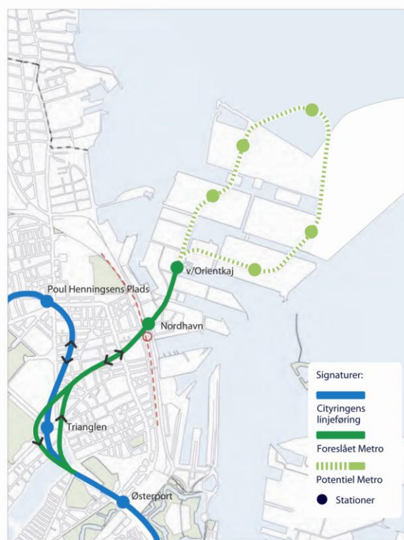
Cityringens afgrening til Nordhavn.

Sø slipper derudover for, at søen omdannes til byggeplads ad to omgange.