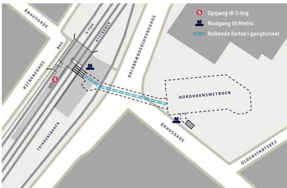
Skitsetegning af adgangs- og skifteforhold ved Nordhavn Station.

Samtidigt med beslutning om igangsættelse af projekt Metro til Nordhavn har staten, By & Havn og Københavns Kommune indgået aftale om en ombygning af Nordhavns Station, således at S-togsstationen og metrostationen vil fremstå som ét trafikknudepunkt, idet der etableres perronadgang til S-togstationen fra Århusgadeviadukten. I samme område placeres trappe og elevator fra den underjordiske metrostation, således at der bliver korte og let tilgængelige skifteveje mellem de 2 togsystemer.