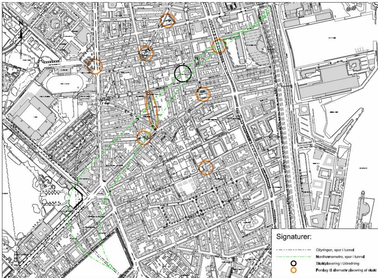
Foreslåede placeringer af nødskakt