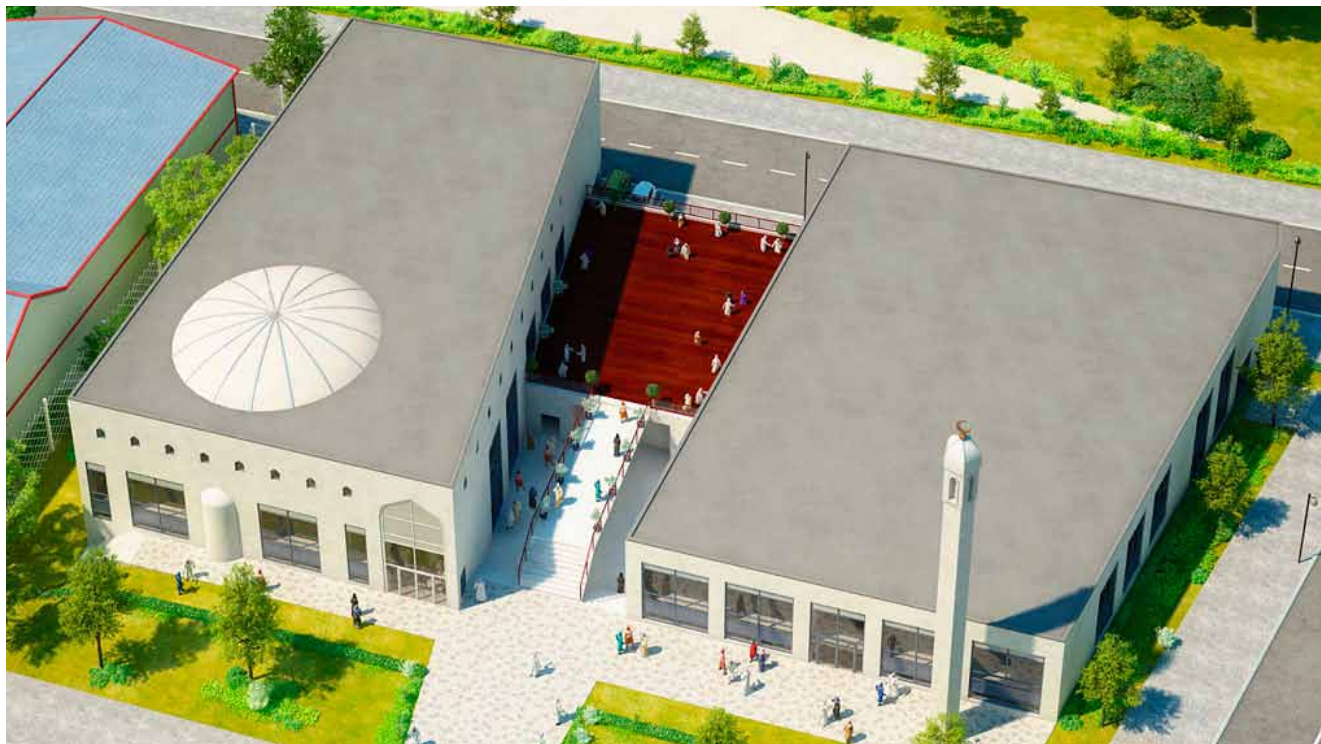
3D-illustration af projektet