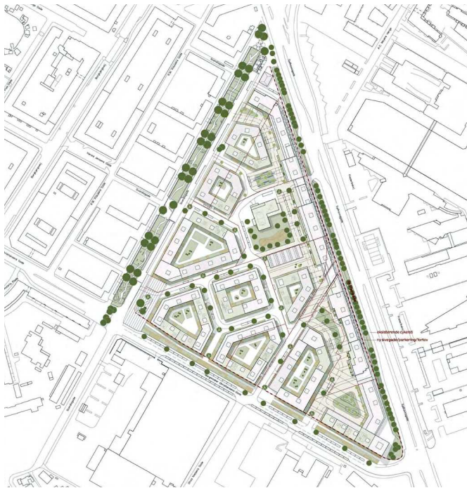
Situationsplan. Illustration af Vandkunsten.

nyplantning af træerækken efter Københavns Kommunes retningslinjer kan give disse træer bedre vækstbetingelser end de eksisterende, der har spor efter skader, samtidig med at risikoen for at skade de eksisterende træer gennem en kommende byggeproces fjernes. Det skal frem mod lokalplanforslaget undersøges, om der kan indgås en aftale med grundejerne om nyplantning af træerækken, hvor Københavns Kommune bl.a. opnår bedre vækstbetingelser end de eksisterende træer har i dag.