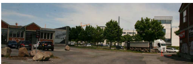
Billedet viser områdets karakter, Sydhavnsgade samt til venstre en del af en industribygning, der foreslås delvist bevaret.

Når metroens sydhavnslinje åbner i 2024, bliver området yderst stationsnært med stationen Mozarts Plads ca. 200 m vest for og stationen Sluseholmen ca. 250 m øst for lokalplanområdet. Sydhavn Station er beliggende ca. 500 m nord for lokalplanområdet. Sydhavnsgade udgør