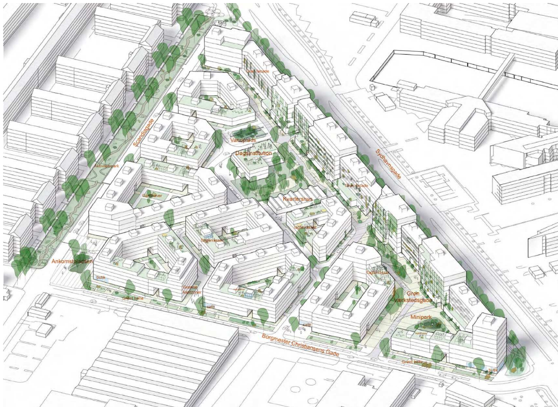
Volumenmodel over området. Illustration af Vandkunsten.

kan den maksimale højde mod Sydhavnsgade fastsættes til maksimalt 29 m, og mod hjørnet ved Sydhavnsgade-Borgmester Christiansens Gade, kan den maksimale højde fastsættes til 40 m. Det foreslås, at området indgår i byudviklingsområde Sydhavnen, hvorved parkeringsdækningen kan fastlægges til 1:150 m 2 .