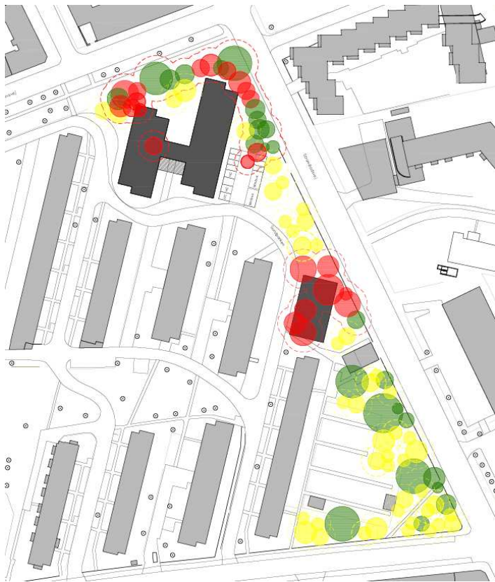
Situationsplan, der viser træer, som forventes fjernet (røde) ved de ønskede projekter samt eksisterende træer (grønne). Nye træer (gule) fordeles langs hele området langs Strandlodsvej.