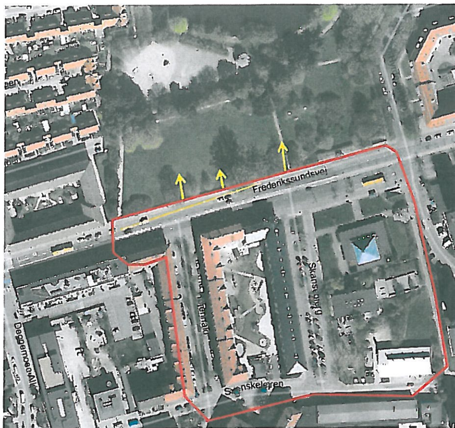
Figur 12. Opland til Brønshøjparken med flere udledningspunkter

Overfladevand ledes fra Frederikssundsvej og direkte til parken ved at føre vandet under cykelstien og fortovet mellem Frederikssundsvej og Brønshøjparken. I tilfælde af kraftig regn vil højdeforskellen sørge for at lede regnvandet til "Louisehullet" gennem en regnvandskanal i Brønshøjparken.