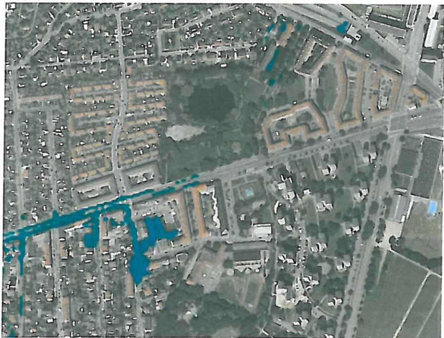
Figur 11 Simuleret oversvømmet areal ved en 100- års regnhændelse i 2010

Formålet er at mindske risikoen for oversvømmelse ved at etablere mulighed for at overfladevand kan løbe fra Frederikssundsvej til Brønshøjparken/Louisehullet i forbindelse med ekstremregn.