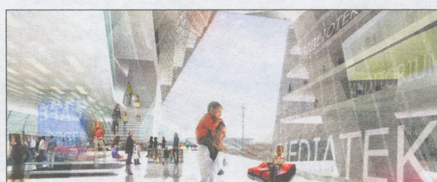
Projektet der forblev en drøm. Henning Larsens tegnestue forestillede sig i 2007 et 80 meter højt svar på Pompidou-centeret i Paris, en bygning med to plateauer med udsigt over København. (Ill: HLA)

- Generelt kan man sige, at der er interesse i at fortætte et stationsområde, det er med til at skabe en bæredygtig og mere intens bydel, men højhusarkitektur er en særlig disciplin, der kræver megen stillingtagen til, hvad