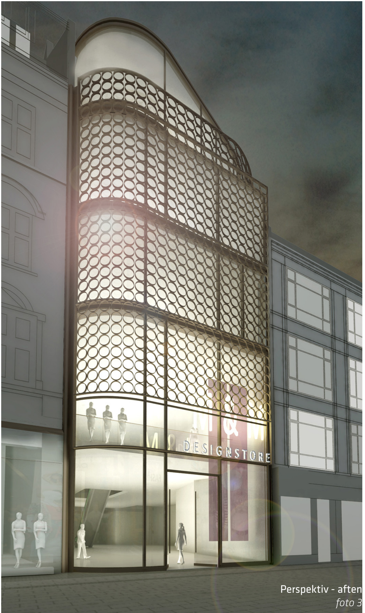
Perspektiv - aften foto 3