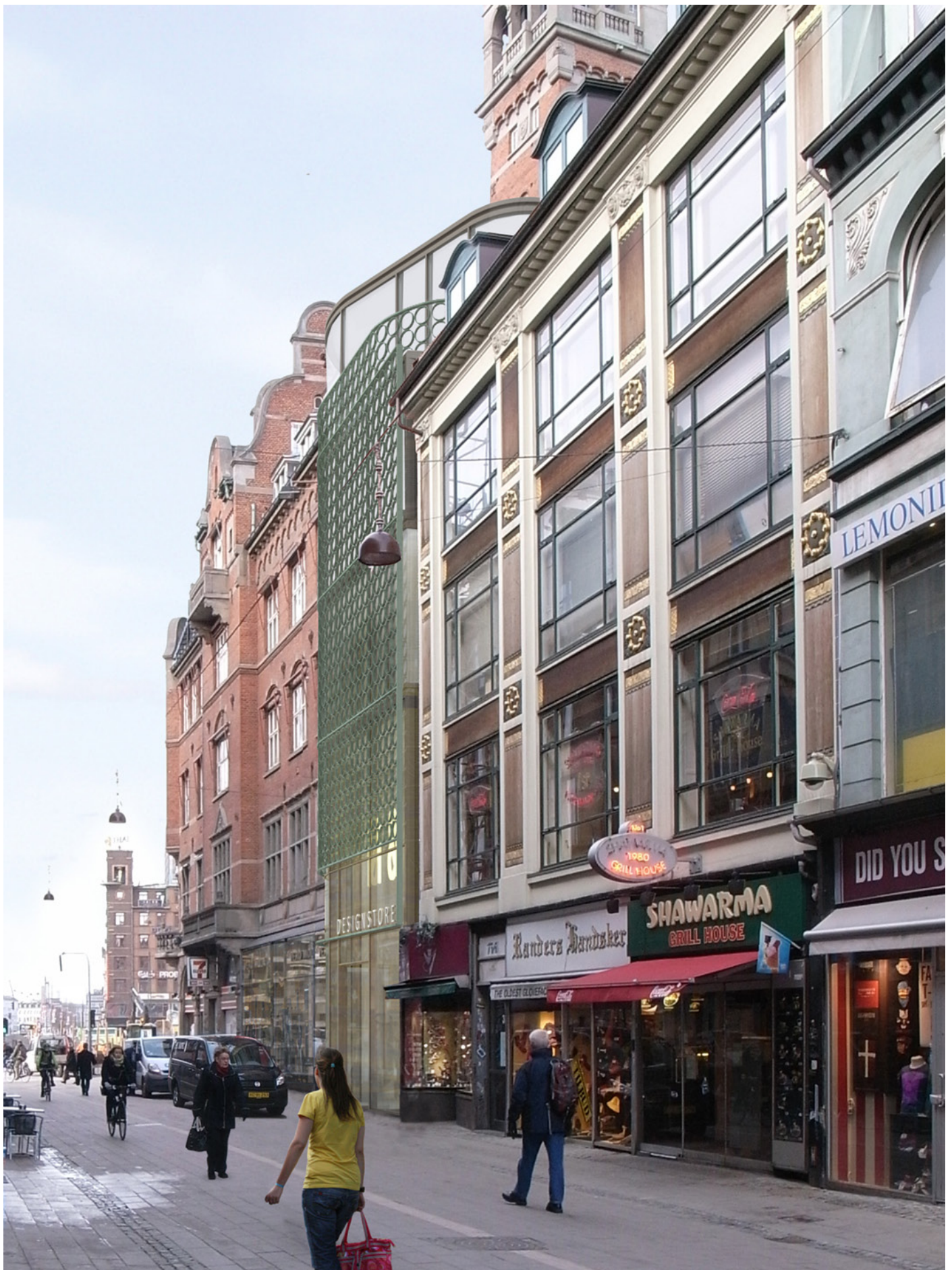
Perspektiv set mod Rådhuspladsen foto 2