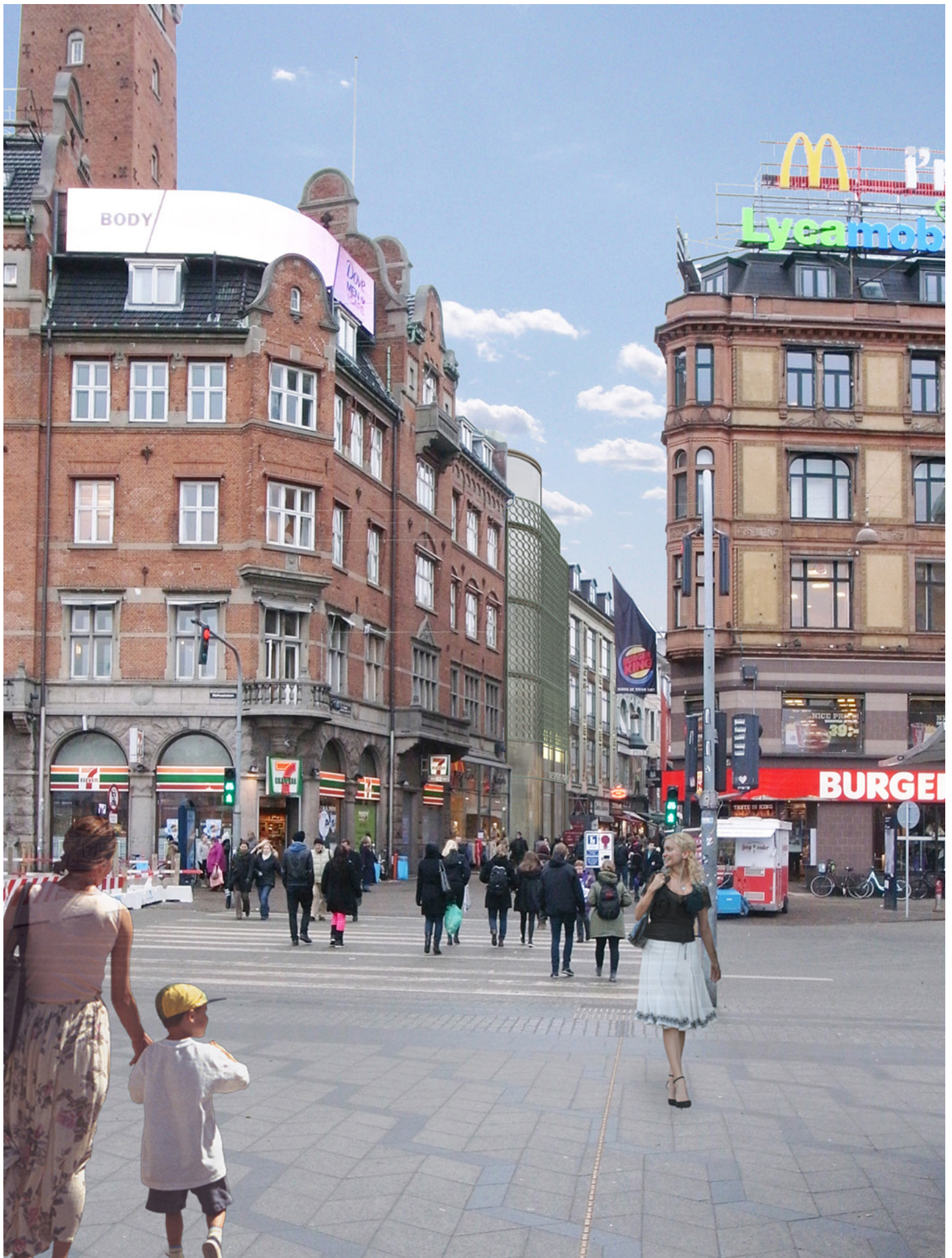
Perspektiv set fra Rådhuspladsen foto 1