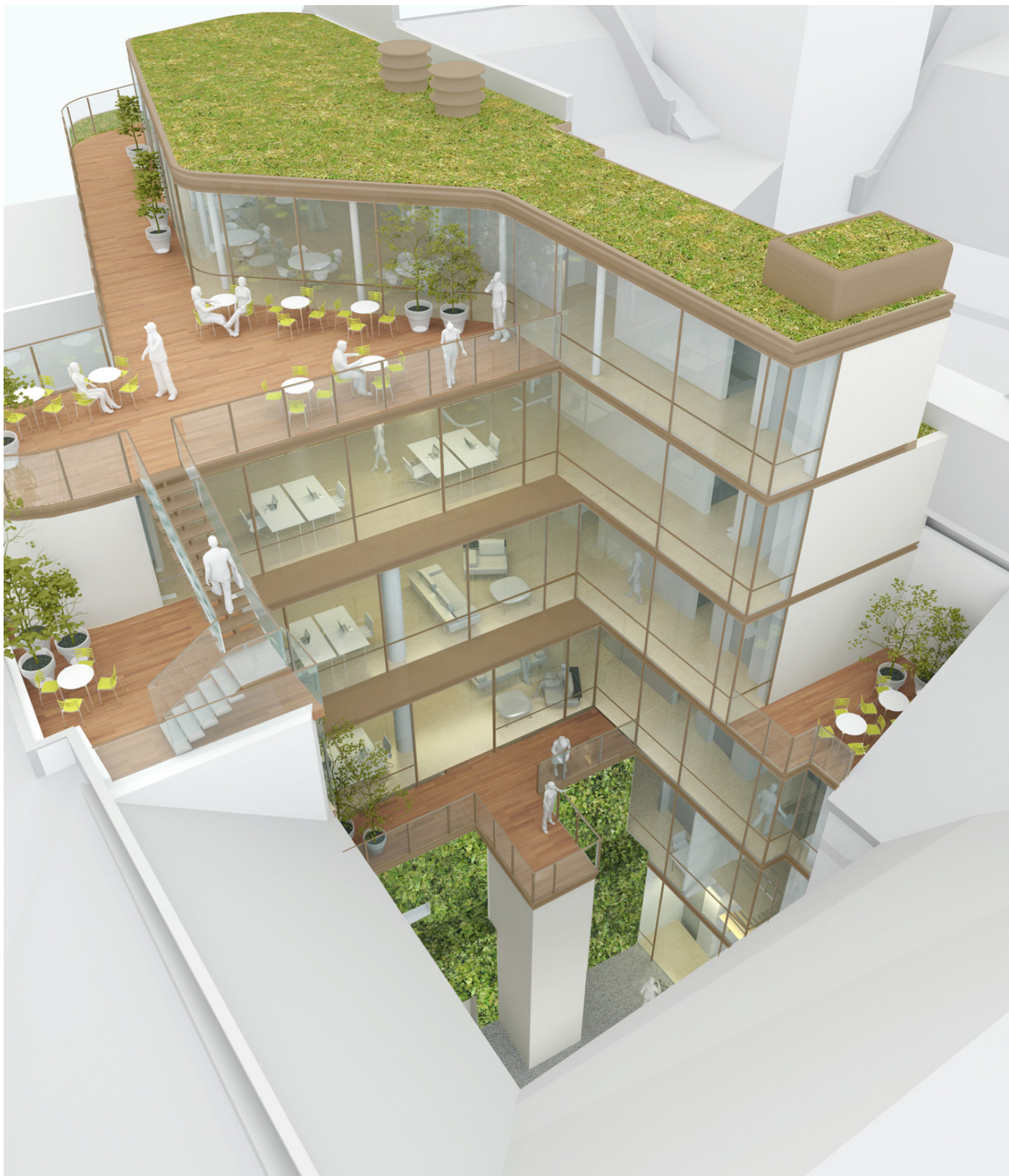
Gårdfacaden mod Vestergade 33