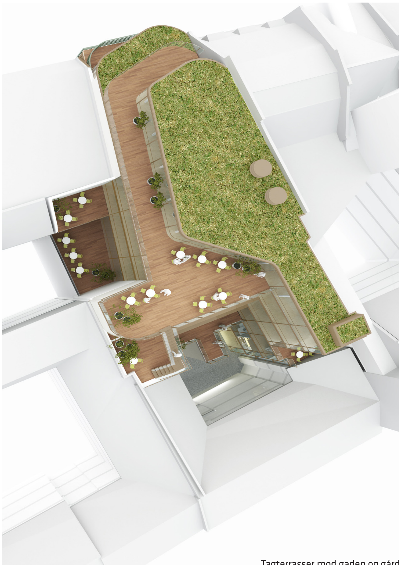
Tagterrasser mod gaden og gård