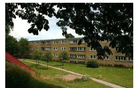
Terrænforskelle i haverum