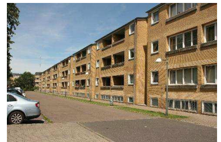
Facader mod gade med opdeling i mindre enheder

De miljømæssige bevaringsværdier knytter sig til byplanen og det særlige kurvede gadeforløb med den homogene og samtidig afvekslende bebyggelse i en menneskelig skala. Tilsammen giver dette både en sammenhæng og en variation med gadeforløb, der veksler med store grønne rum mellem boligblokkene med C. Th. Sørensens landskabsplan, og knytter sig på et mere overordnet plan til bebyggelsens samlede og sluttede karakter, der ligger som en meget klart defineret bebyggelse midt i de omkringliggende naturområder.