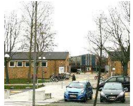
Skolen set fra Ruten

C. Th. Sørensens landskabsplan for Tingbjerg fremhæver bebyggelsesplanens store linjer og træk i Tingbjerg, der i dag også kan genkendes i bebyggelsen. Hovedideen var at skabe de bedste forudsætninger for et socialt liv udenfor både for børn, unge, voksne og ældre med hver deres behov. Det var C. Th. Sørensens idé, at børn og voksne skulle have adgang til de samme landskabstyper, som man kender fra landet: Sandstranden, engen og lunden. Landskabstyperne stiliseres til sandkasser, til græsplæner og til beskyttende og skyggegivende beplantninger. Med randbeplantning, træerækker og plateauer og terrænbearbejdning