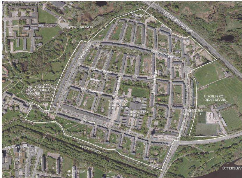
Luftfoto af Tingbjerg med lokalplanafgrænsningen markeret med hvidt.

Vejbetjening sker med et net af veje, der via et ringvejssystem (Ruten-Terrasserne-Gavlhusvej-Langhusvej) er koblet til det overordnede vejnet. For at undgå en monoton bydel har Steen Eiler Rasmussen søgt at gøre vejene så karakterfulde som muligt. Dette er løst ved at differentiere gadenettet, så hver vej og gade er udformet efter sin specielle placering og funktion inden for området, og ved at vejene krummer.