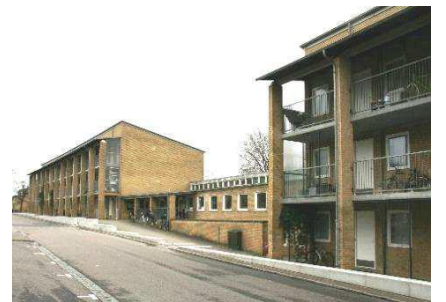
Arkaderne mod øst med en 1-etages institution

Tingbjerg er opført på grundlag af en bebyggelsesplan udarbejdet i 1950 af Arkitekt Steen Eiler Rasmussen i samarbejde med havearkitekt C. Th. Sørensen. I 1956 påbegyndtes byggeriet og størstedelen af bebyggelsen var færdigopført i 1970. I 2018 er der opført et kulturhus tegnet af arkitektfirmaet COBE. Bygården mod Ruten stod i medio 2020 færdigbygget med butikker og private boliger på det førhenværende Lille Torv.