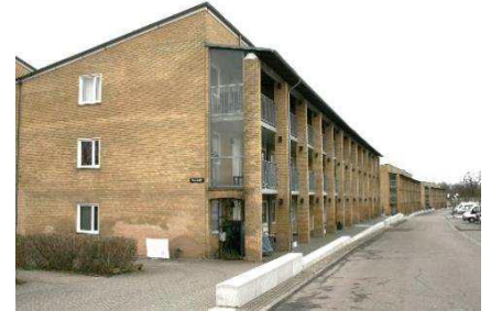
Arkadernes kurvede forløb set mod vest