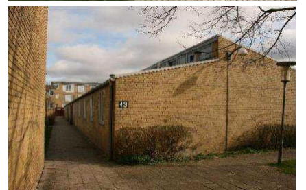
Institutionsbygninger i 1 etage og med forskudte tage