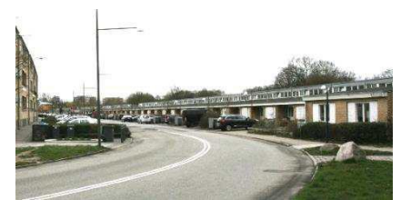
Rækkehuse ved Langhusvej