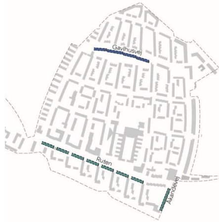
Illustration 1: Kort over foreslåede placeringer for nye tagetager. Illustration: Vandkunsten

Påbygningen af en ekstra etage foreslås placeret på bygninger langs hovedgaden Ruten og gaden Gavlhusvej. Herudover ønsker bygherre at placere tagboliger på Åkandevej. Bygherre/rådgiver vurderer, at det på disse placeringer kan ses som en kvalitet at gå op i mere end tre etager, og dermed være med til at understøtte de nærliggende byrums betydning. Forvaltningen vurderer, at tagboliger på eksisterende boliger mod Åkandevej vil stå arkitektonisk og skalamæssigt uden sammenhæng med Tingbjergs øvrige helhed.