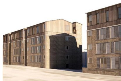
Facade med ny tagetage på Ruten, set mod syd/øst. Illustration: Vandkunsten