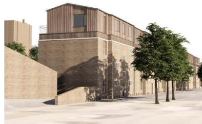
Facade med ny tagetage på Åkandevej, set mod nord. Illustration: Vandkunsten