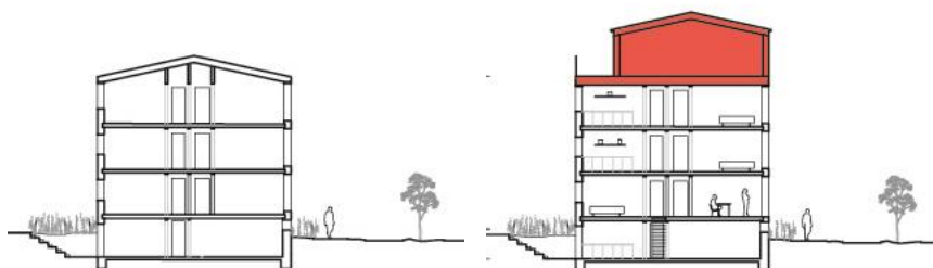
Snit ved Ruten. Eksisterende ejendom. Illustration: Vandkunsten