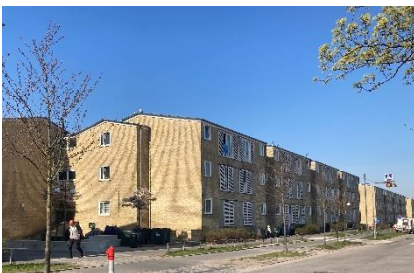
Facade med ny tagetage på Ruten, set mod vest.