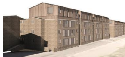
Facade med ny tagetage på Ruten, set mod vest. Illustration: Vandkunsten