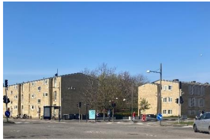
Nuværende facade på Åkandevej, set mod syd/vest.