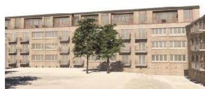
Haveside med ny tagetage og altaner på Ruten, set mod nord. Illustration: Vandkunsten