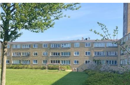
Haveside på Ruten, set mod nord.