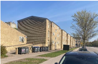
Nuværende facade på Åkandevej, set mod nord.