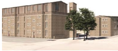
Facade med ny tagetage på Åkandevej, set mod syd/vest. Illustration: Vandkunsten