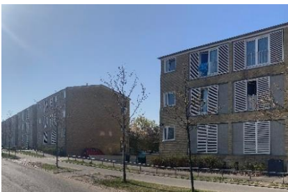
Facade med ny tagetage på Ruten, set mod syd/øst.