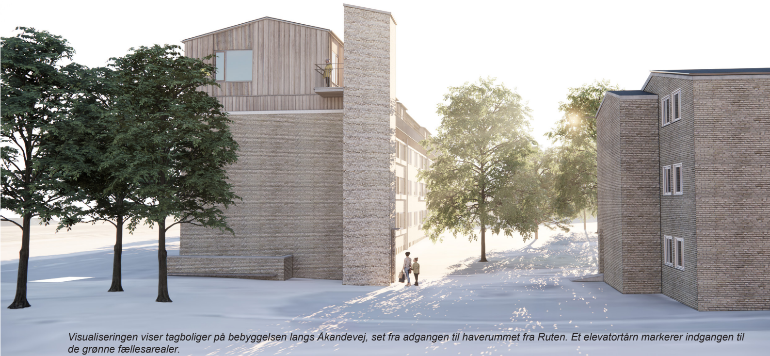
Visualiseringen viser tagboliger på bebyggelsen langs Åkandevej, set fra adgangen til haverummet fra Ruten. Et elevatortårn markerer indgangen til de grønne fællesarealer.