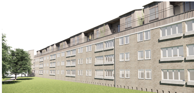
Visualiseringen viser haverummet ved Åkandevej med nye tagboliger. Haverummet ved Åkandevej er Tingbjergs største og har potentiale for at rumme flere nære beboere.