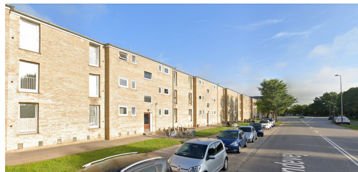
Ankomsten til Tingbjerg langs Åkandevej idag. Visualiseringen nedenfor viser Åkandevej med nye tagboliger og ankomst ved hjørnet for Ruten.