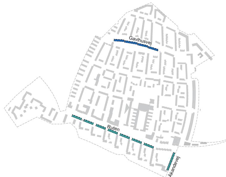
Tagboliger langs Tingbjergs større veje, markeret med blå for fsb og grøn for SAB.